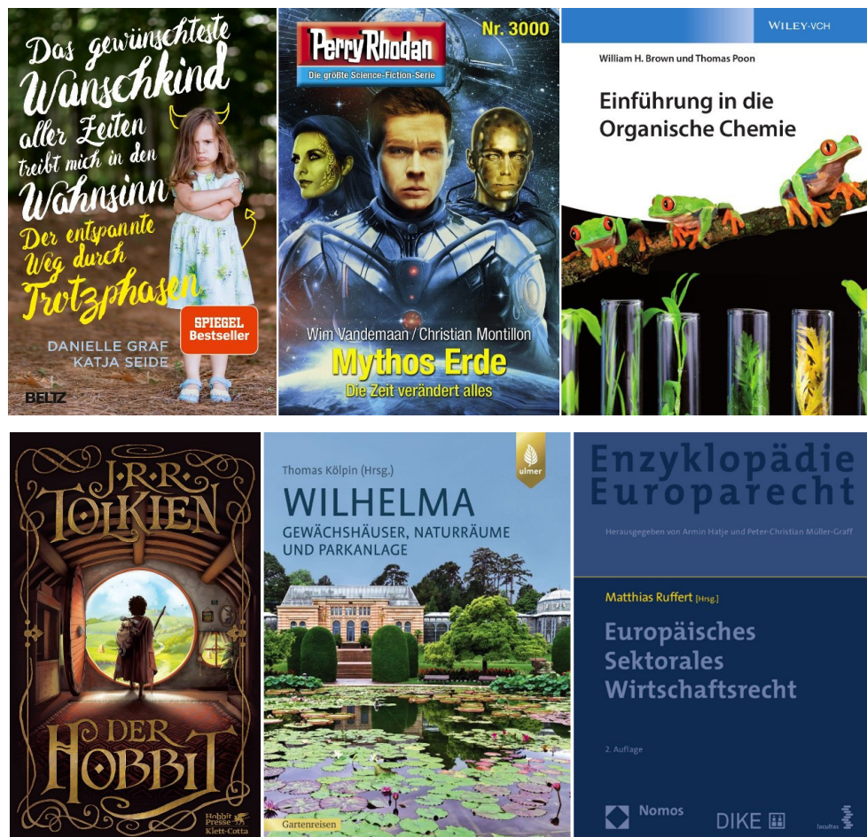
Abb. 6: Cover-Bilder baden-württembergischer Pflicht-E-Books 27

Springer Vieweg, Ergon, Tectum, Kreuz, Karl Alber, O'Reilly. Einige weitere größere Verlage sind noch nicht in Produktion, haben aber schon eine Lieferung angekündigt.