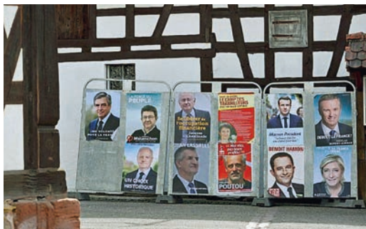
Placard électoraux dans la campagne alsacienne. Wahlplakate auf dem Land im Elsass.

Peu de temps avant les élections, le parti Unser Land avait fait réaliser, par un institut professionnel de réputation nationale, un sondage qui révèle une sensibilité forte de la population alsacienne aux idées régionalistes : 84 % est hostile à la suppression de la région Alsace, plus de 80 % est favorable au maintien ou à un renforcement du droit local, plus de 80 % favorable à un renforcement de