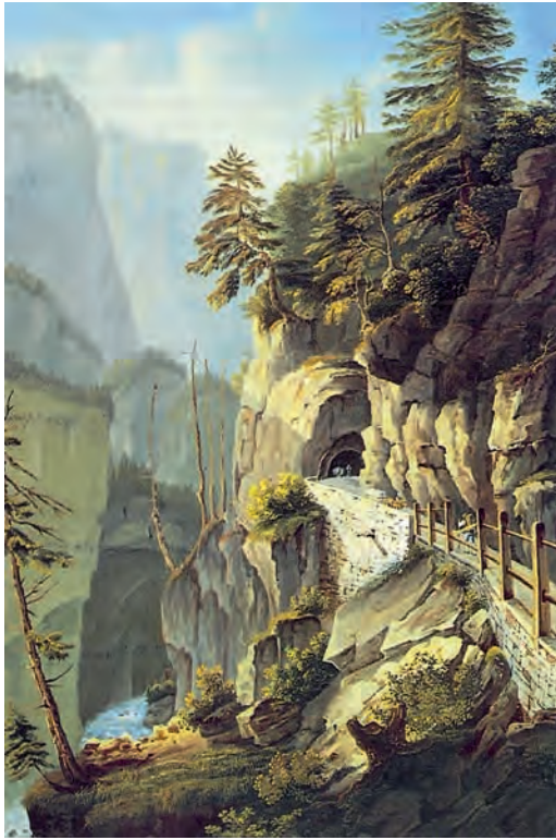
Via mala-Gemälde von Johann Ludwig Bleuler (um 1825). Aus den Sammlungen des Rätischen Museums, Chur.

demander grâce aux Dieux. Keiner hatte mit der Geräuschkulisse im Rheintal gerechnet.