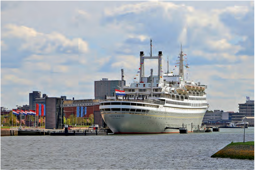
Das ehemalige niederländische Passagierschiff »Rotterdam« liegt heute im Hafen Rotterdam als Museum- und Hotelschiff

lomètres qui relie le Nord et le Sud des Alpes, dessinant sur la carte du monde une neue Kreuzung der Nationen, der Geschlechter, der Geister, brisant définitivement l'isolement hélvétique. Das Jahrhundertwerk kreuzt genau Sedrun, am Vorderrhein. Le touriste pourra descendre avec un Lift in den Bauch der Alpen et prendre le train de la liberté.