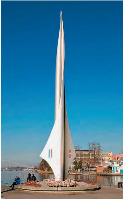
Dreiländereck Deutschland, Frankreich, Schweiz bei Basel, links im Hintergrund die Dreiländerbrücke.

grâce aux sogenannten »Donauversinkungen« d'Immendingen, nous donnant à tous une dernière leçon de modestie.