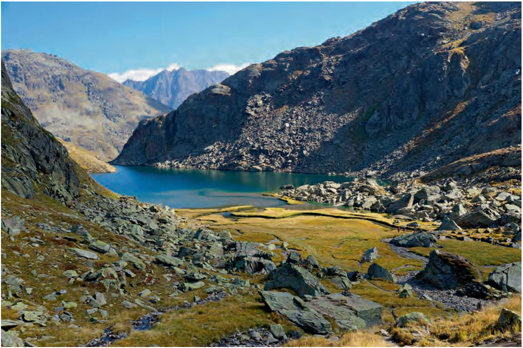
»Rheinquelle« Tomasee, Graubünden, Schweiz.

Rhein« ist eine Erfindung müder Nationalisten, puisque la source vient au monde dans les montagnes von Graubünden, au pied du Badus et du Pic Nunschallas. Es ist nicht die deutsche, sondern die rätoromanische Sprache qui donne sa vitesse de croisière au Rhin. La petite minorité des Rätoromanen symbolise la force de la liberté des mots des uns qui irriguent les mots des autres. Depuis sa source ist der Rhein »Unterwegs zur Sprache«, pour imiter Martin Heidegger. David peut gagner contre Goliath. Une métaphore du mélange des sens et des mots. Tanz der Wörter qui nous rappellent, dass jede Sprache die schönste Sprache der Welt ist, comme l'écrit Umberto Eco dans »La recherche de la langue parfaite«. Kein Mensch hat seine Sprache ausgewählt. Le lieu de la naissance du Rhein multiséculaire zwingt uns zu Bescheidenheit, öffnet uns zum Frieden.