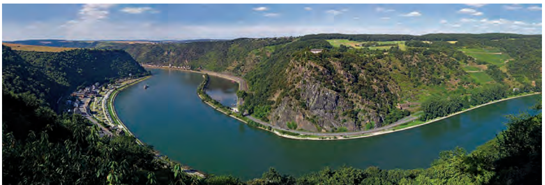
Blick vom Aussichtspunkt »Maria Ruh« bei Urbar hinüber zur Loreley (Wikimedia Commons, Foto Dirk Schmidt)

L'écrivain Hugo était un excellent observateur: »Jeden Augenblick begegnet man une chose qui passe. Tantôt eine Art Rheinpfel, der unheimlich schnell vorbeisaust ... tantôt