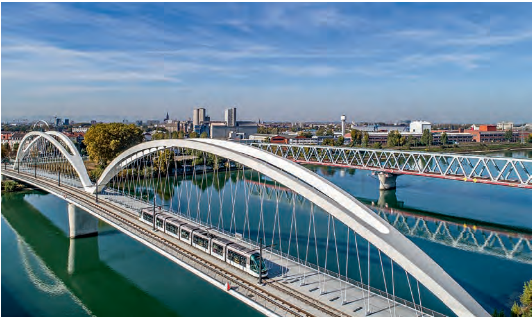
Tram Straßburg–Kehl

du fleuve ist umso bemerkenswerter, que die selbe Minderheit, die sprachlich den Rhein tauft, bei Vidin in Bulgarien, an der Donau weiter lebt. Ce qui me fait particulièrement plaisir, weil auch die Donau die Völker verbindet. Ausserdem wissen wir inzwischen que l'eau du Danube se mélange à l'eau du Rhin