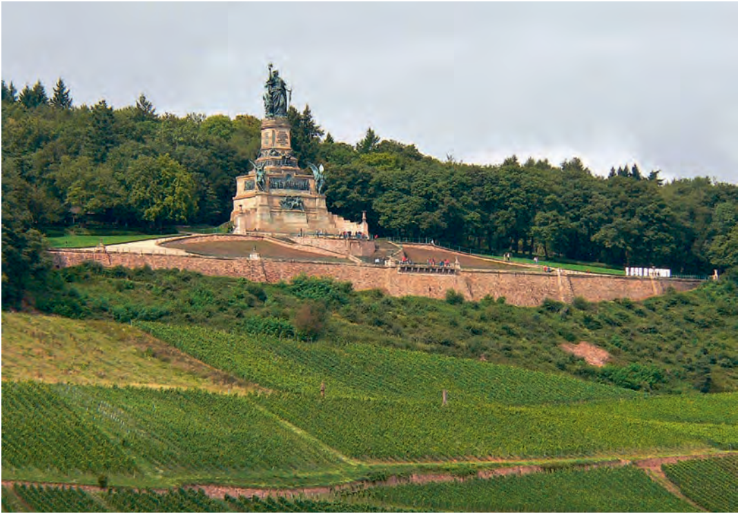
Niederwalddenkmal vom Rhein gesehen

einem Dampfer, tantôt einem Segelschiff. Oder Kähnen, die wie müde Schlangen flussaufwärts reisen, ou un petit cheval courageux remorquant à lui tout seul une grosse barque, ou bien ces gigantesques radeaux avec des centaines de matelots ...»