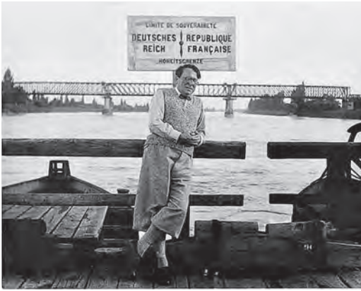
René Schickelé auf der Kehler Rheinbrücke (um 1930)