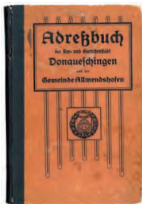
„Adressbuch der Kur- und Garnisonstadt Donaueschingen und der Gemeinde Allmendshofen“ aus dem Jahr 1913.

Viele brachten Erinnerungsstücke mit, von denen einige später in der Ausstellung in einer Vitrine gezeigt wurden. Darunter waren neben Fotos und Postkarten, die belegen, dass das Gebäude ehemals auch ein Soldatenheim und später ein städtisches Kurhaus gewesen war, auch ein Adressbuch von 1913 und ein Taufschein von der NS-Wohlfahrt mit der Erläuterung, die Taufe habe 1944 im Spiegelsaal des Museums stattgefunden. Ebenso wurden Kinopлакate aus den 1950er und 1960er Jahren gezeigt sowie ein Büchlein von 1925 mit dem wortspielerischen Titel: Die Schlapperklänge (siehe dazu Schriften der Baar 2012).