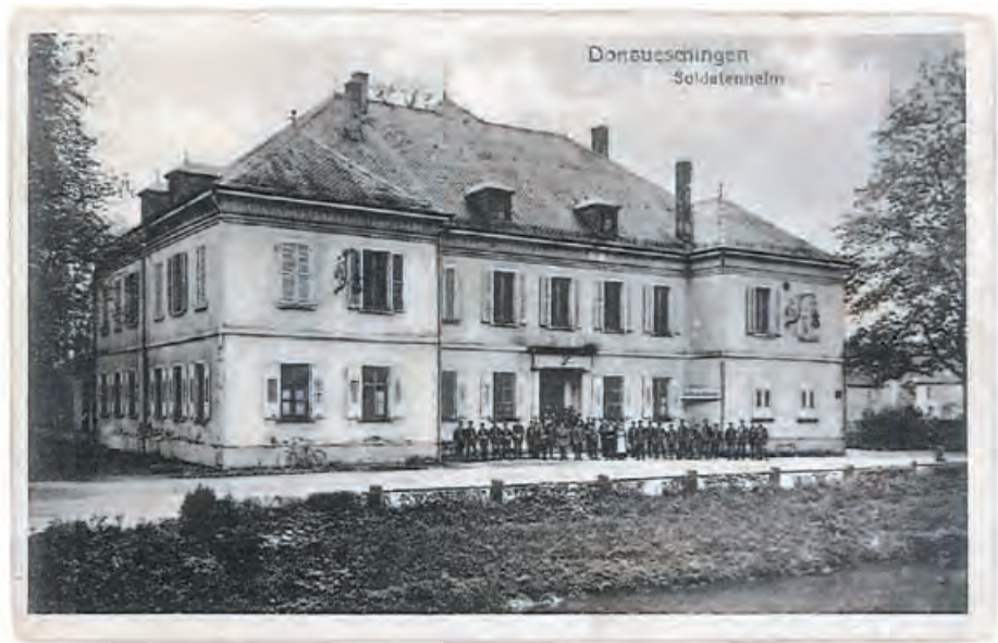
Das Gebäude diente in einer anderen Zeit als Soldatenheim. Historische Postkarte.

Dieser traditionsreiche Ort war der Ausgangspunkt für das Kunstprojekt „Museum wurde es immer schon genannt“, das im März 2016 seinen Abschluss in einer Ausstellung im 2-Raum des Hauses fand. Schon zwei Jahre zuvor – im April 2014 – wurde ich von der Museumsleitung gefragt, ob ich mir vorstellen könnte, eine Arbeit zu realisieren, die sich der Geschichte des Hauses auf andere Weise nähert.