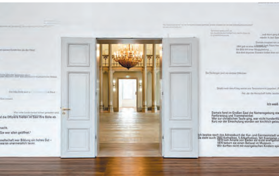
Während der Ausstellung im 2-Raum waren die Zitate gleichsam in die Wände eingeschrieben. Blick in den Spiegelsaal.

Mein Wunsch ist eine offene Auseinandersetzung mit den Menschen, ihren Bildern und Vorstellungen, frei von Wertungen und Zwängen. Auf der einen Seite das persönliche Gespräch mit wenigen Gesprächspartnern, auf der anderen Seite der lesende Betrachter. Meine Arbeit will eine Geste zur Mitteilung von Gedanken sein – auf der Suche nach Bereichen des freien Denkens und des offenen Gesprächs.