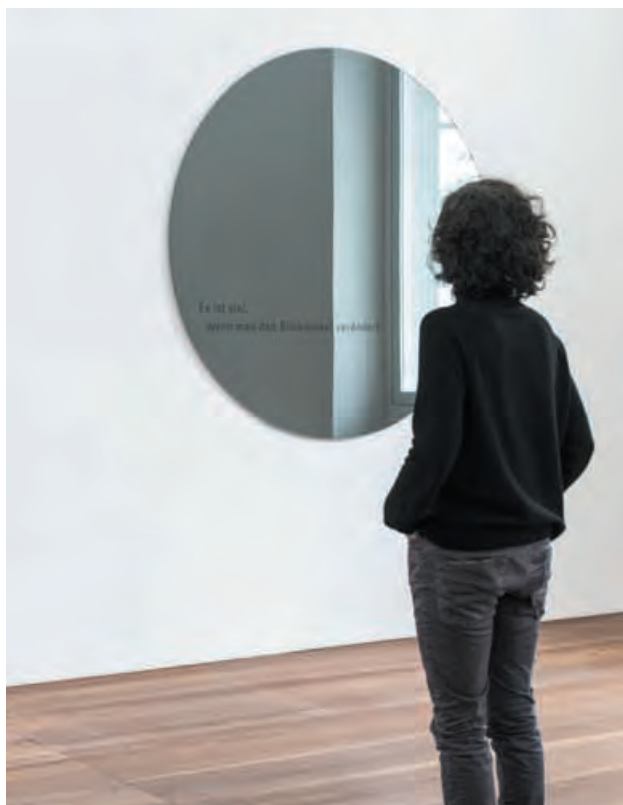
Dunkelgrauer Spiegel mit der Inschrift: „ Es ist viel, wenn man den Blickwinkel verändert. “

Für die Ausstellung im 2-Raum wurden die Zitate direkt an die Wände über- und nebeneinander angebracht. Sie bildeten Zeitschichten – die unteren in ihrer Wirkung eher schwer und dunkel, die oberen leicht und hell. Im zweiten Raum waren nur noch wenige Sätze zu lesen. Das Bild blieb fragmentarisch. Die Vereinzelung und Fragmentierung der Zitate ermöglichte dem Betrachter, das Gelesene mit seinen eigenen Gedanken und Vorstellungen zu verbinden. Die persönliche Erfahrung vervollständigte das Bild. Den letzten Satz aus der Sammlung konnten die Besucher der Ausstellung in einem großen, dunklen Spiegel lesen: „ Es ist viel, wenn man den Blickwinkel verändert. “ Dieses Zitat bezieht sich auf die Fähigkeit des Menschen, sich immer wieder neu zu erfinden. Durch die Spiegelung kann sich der Betrachter als Teil der Geschichte sehen.