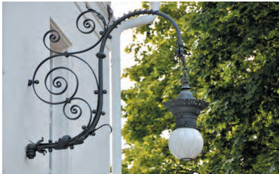
Foto: Sabine Hofmann, © Museum Art.Plus/ Art.Plus Foundation, Donaueschingen.