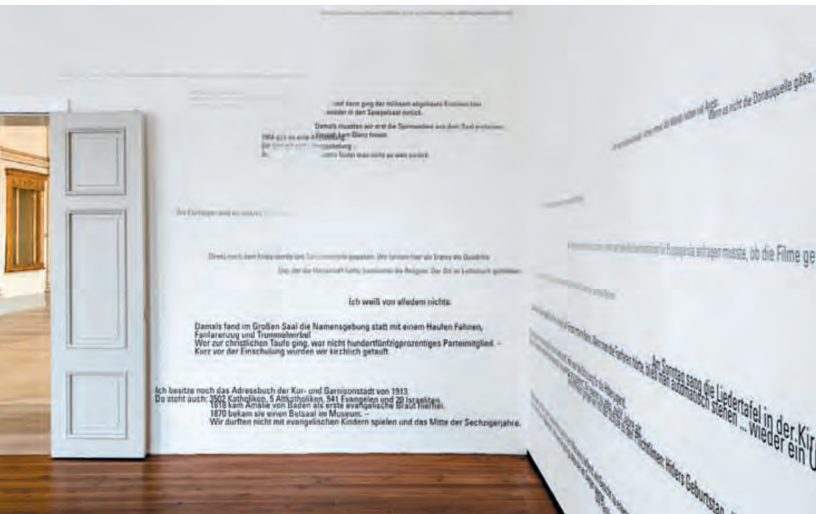
Das Schriftbild in drei Schriftgrößen und seinen drei Grautönen.

49 Zeitzeugen verschiedener Generationen nahmen teil, wobei vor allem die älteren Menschen noch besonders viel über die frühere Zeit zu berichten wussten.