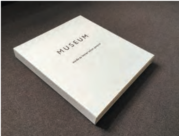
Künstlerbuch, welches alle 111 Zitate enthält. Es befindet sich in der Sammlung Art.Plus Foundation, Donaueschingen.

Alle Zitate wurden darüber hinaus in einer geordneten Blattsammlung in einem Künstlerbuch zusammengefasst, das in der Ausstellung auslag. Anders als in der öffentlichen Präsentation konnte sich der Leser hier ganz privat in die Fülle der Geschichten vertiefen. Das Medium schickte ihn somit auf eine eigene innere Reise. Alle 49 Gesprächsteilnehmer fanden in diesem Buch namentlich Erwähnung, wobei ich vor allem nochmals die bemerkenswerte geistige Fitness der über 90-jährigen Damen hervorheben möchte, die so viel zu erzählen hatten. Beeindruckt hat mich auch, dass sich die Menschen in jeder Epoche immer wieder neu verpflichtet fühlten, sich um den Erhalt und die Schönheit dieses imposanten Gebäudes zu kümmern.