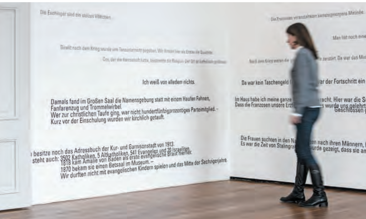
In den Räumen beginnt man auf besondere Weise zu lesen.

Die wechselvolle Geschichte des Museums wird durch die Erzählungen persönlicher Erlebnisse und Erinnerungen gegenwärtig. Jede Begegnung ist einzigartig, dem Alltag enthoben. Es ermöglicht ein gegenseitiges Kennenlernen auf Augenhöhe und schafft einen Raum, der weder durch Vorgaben eingeengt noch auf Objektivität reduziert wird. Das Gesagte bleibt faktisch ungeprüft. Generell ist für meine Arbeiten ein Moment des Vertrauens, des Zuhörens und des Verstehens notwendig.