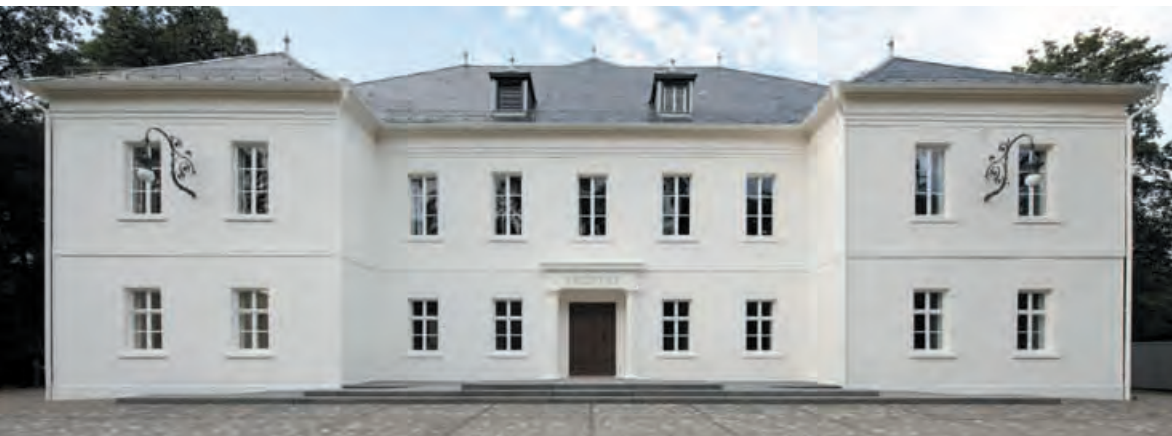
Das Museum Art.Plus in Donaueschingen (nach seinem Umbau 2009).

Jedes Mal, wenn ich in Donaueschingen in den Museumsweg einbiege, fühle ich mich umfassen von Naturschönheit und Ruhe. Das Wasser der Brigach, die alte Baumallee und die schützenden Mauern führen einen, wie Begleiter, bis zum Museum Art.Plus . Schließlich öffnet sich die Allee und gibt den Blick frei auf das schöne klassizistische Gebäude. Über dem Eingang steht in großen Lettern: MUSEUM.