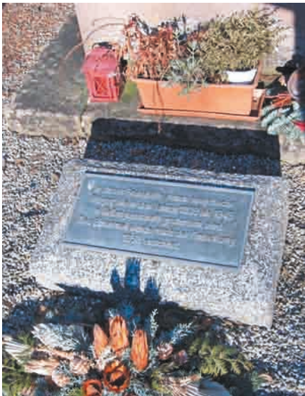
Granitstein mit Grabplatte aus dem Jahre 1987.

Auf dem oberen, an die Fürstenberg-Kaserne und an die Barbara-Kaserne angrenzenden Areal des Donaueschinger Stadtfriedhofs wurden in Vollzug der zitierten Anordnung der Alliierten Hohen Kommission insgesamt 369 sowjetische Staatsangehörige bestattet, die während der Kriegswirren als Kriegsgefangene, als Zwangsarbeiter oder auch als Zivilpersonen im Raum Südbaden verstorben waren. 33 Diese dort verstorbenen sowjetischen Soldaten, Frauen und Kinder wurden auf den jeweiligen Friedhöfen der Region exhumiert 34 und anschließend zentral auf dem Donaueschinger Stadtfriedhof beigesetzt. 35 Die Exhumierungen auf den jeweiligen Friedhöfen und die Neubestattungen auf dem Ehrenfriedhof in Donaueschingen sind ausweislich der Aktenlage akribisch dokumentiert und