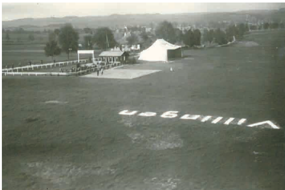
Flugzelt und Wachhäuschen, als Provisorien geplant, blieben ein Dauerzustand. Die Besucher konnten sich dem Flugfeld bis zur Absperrung nähern. Foto von 1928.

Auch in diesem Jahr 1928 ließen sich Störungen nicht vermeiden. Erste Problemquelle war die aus rot-weiß gestrichenen Steinen gesetzte Umgrenzung des Flugfeldes: Nachdem eine Maschine beim Landen an einen der Steine stieß und leicht beschädigt wurde, entsandte die Deutsche Luft Hansa AG einen Kontrollinspekteur, der die Grenzmarkierung beanstandete und eine Alternative aus Holz vorschlug. Im Juli mussten zudem erneut Unebenheiten im Boden ausgebessert werden, da die warmen Temperaturen zur Austrocknung der ehemaligen Ackerfurchen geführt und Niveauunterschiede von bis zu 10 cm Höhe verursacht hatten.