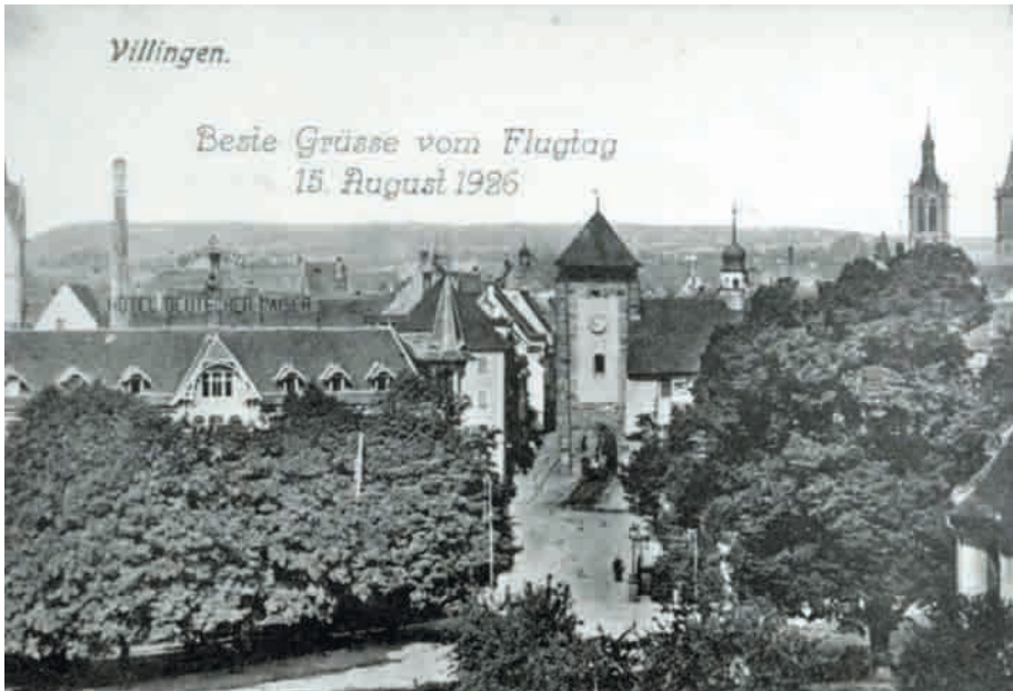
Postkarte „Beste Grüsse vom Flugtag, 15. August 1926“.