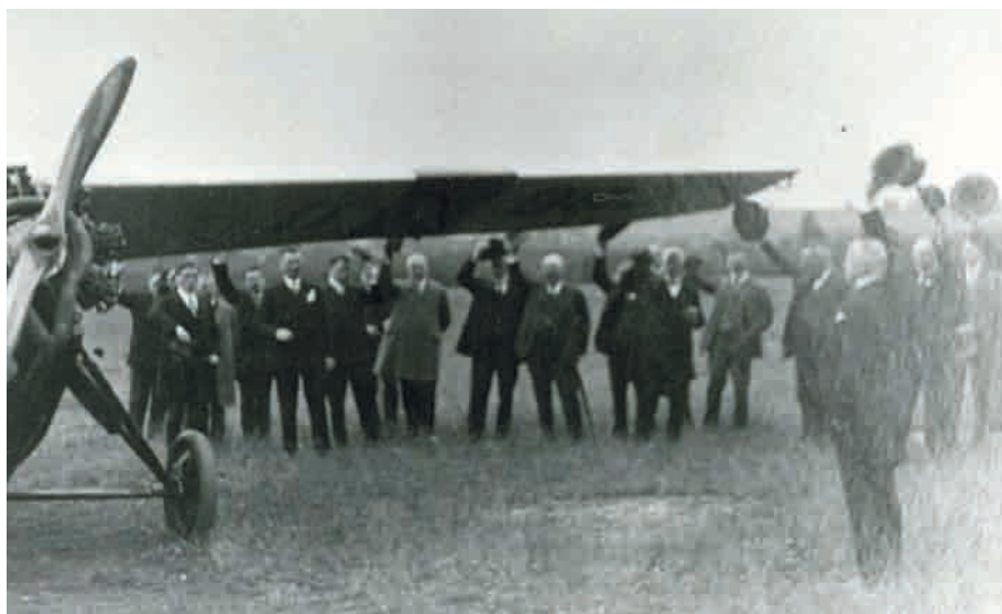
Ankunft einer Maschine auf dem Villingener Flughafen. Anlass und Datum der Aufnahme unbekannt.

hallen für je zwei Maschinen entstehen, die unterirdisch durch ein Benzinmagazin verbunden sein sollten. Der Plan war der Stadt aber etwas zu kühn – eine bauliche Erweiterung wollte man erst in Betracht ziehen, wenn der Flughafen von mehr als einer Linie angefliegen würde. So musste Knapp vorerst mit dem kleinen Wachhäuschen vorlieb nehmen, das er sich schließlich auch noch mit dem polizeilichen Flugwächter teilen musste. Räume für Fluggäste gab es nicht – und auch keine Toiletten, wie das badische Bezirksamt kritisch anmerkte.