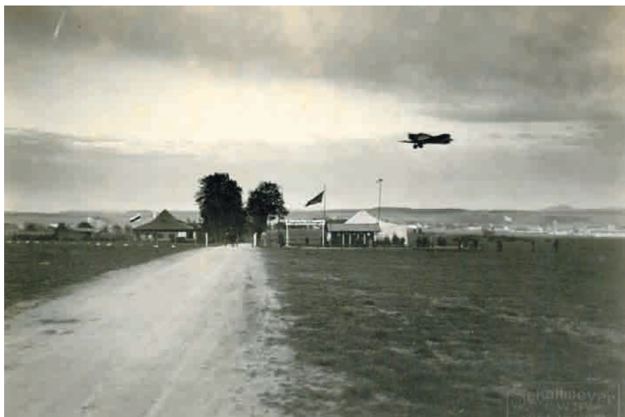
Eine Maschine beim Start vom Villingener Flughafen. Blick von der Vöhrenbacher Straße Richtung Osten. 1928.

Dass auch Villingen einmal einen Verkehrsflugplatz besaß, ist nicht mehr vielen bekannt. Kaum verwunderlich, denn die Glanzzeit dieses aeronautischen Knotenpunktes währte kurz, und als letzte verbliebene Erinnerung trägt eine Pizzeria am ehemaligen Standort bis heute den verirrt klingenden Namen „Flughafen“. Doch dort, wo heute Sportfans ihren Spielern zujubeln, erhoben sich tatsächlich einst Flugzeuge in den Himmel, und von hier mag so manche Reise bis ans andere Ende der Welt geführt haben.