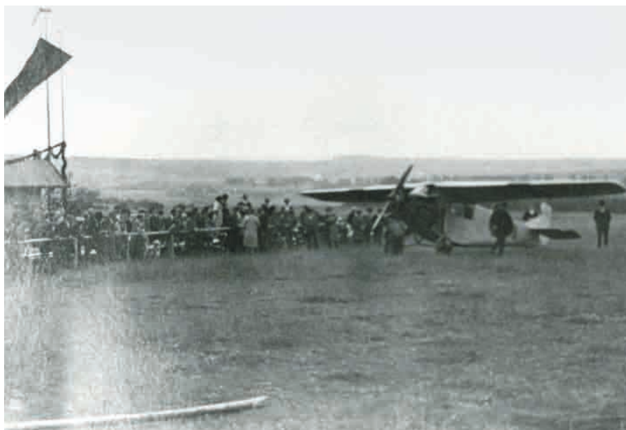
Die Flugtage waren stets Publikumsmagneten, die eine Vielzahl von Interessierten anlockten. Hier eine Junkers K 16-Maschine beim Flugtag am 15. August 1926.

Juli wurde endlich – über ein Jahr nach Inbetriebnahme – die offizielle Zulassung durch das Reichsverkehrsministerium erteilt.