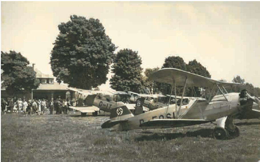
Foto vom Deutschlandflug 1937. Im Hintergrund das Flughafen-Restaurant. Die Nationalsozialisten versuchten, die ungebrochene Flugbegeisterung der Bevölkerung für ihre Zwecke zu instrumentalisieren.

Das Jahr 1930 sollte das letzte Betriebsjahr des Villingener Flughafens als Verkehrslandeplatz bleiben. Die Mehrkosten nach Einstellung der Reichssubventionen waren untragbar geworden, so dass der Villingener Gemeinderat im Jahr 1931 den von der Deutschen Luft Hansa AG geforderten Zuschuss für die Schwarzwaldlinie nicht mehr bewilligte. Die Strecke Freiburg – Villingen – Konstanz musste ebenfalls eingestellt werden, weil sowohl Villingen als auch Konstanz keine Mittel mehr zur Verfügung stellten. Das offizielle Ende kam im Mai 1931, als das badische Innenministerium dem Flughafen die Betriebsgenehmigung entzog, da die seit Jahren angemahnten Veränderungsarbeiten ausgeblieben waren.