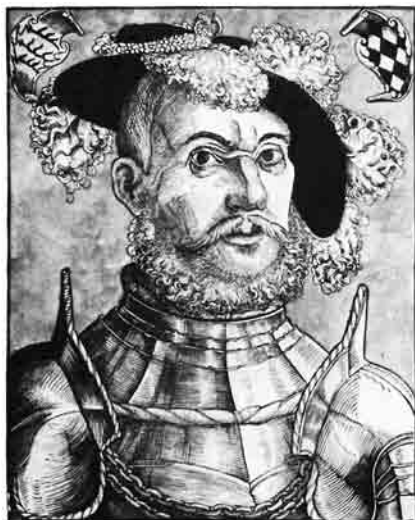
Herzog Ulrich (1498–1550) führte 1534 die Reformation in Württemberg ein [2].

so verteilt (45 Höfe insgesamt): Kloster St. Georgen (9 Höfe), Herzog von Württemberg (6), Kloster St. Clara (Bickenkloster) (5), Spital zu Villingen (4), Villingen Kaplaneien (4), Kloster Rottenmünster (3), Kloster Weiße Sammlung Rottweil (3), Spital in Rottweil (2), Kapellenkirche in Rottweil (1), Kloster St. Blasien (1) und Schwenninger Kirchen (4). 1 Die Menschen lebten in einer sehr kleinteiligen Welt mit zahllosen Überschneidungen der Rechtsverhältnisse.