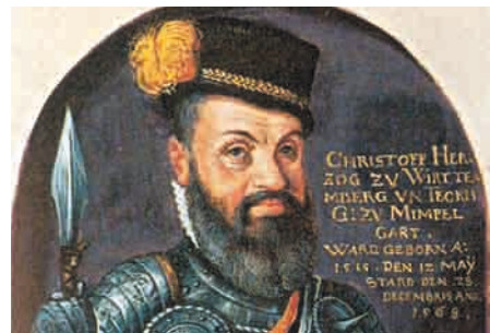
Herzog Christoph (1550–1568) führte 1556 in St. Georgen die württembergische evangelische Klosterordnung ein [3].

Für die Einwohner von St. Georgen und den dazugehörigen Dörfern wurde die geänderte Lage erst ab 1536 wirksam. Selbstverständlich wussten auch die einfachen Bauern, dass es ein neues Verständnis des Evangeliums nach Martin Luther gab. Auf ihr tägliches Leben hatte dies keinen Einfluss. Der recht abrupte Wechsel der Obrigkeit und damit auch der Konfession muss einige Verwirrung gestiftet haben. Es wechselten auch jedes Mal die zuständigen Ansprechpartner. Sicher gab es Einwohner, die die neuen Verhältnisse begrüßten und kein Problem hatten,