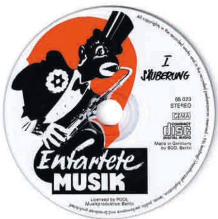
Entartete Musik.

„Wenn Hindemith auch kein Jude ist, so segelte er doch bisher ganz in dem Fahrwasser jüdischer Mentalität“, hieß es 1934, 15 und ein „Kultur bolschewist“ sei er obendrein. Aber schon in den zwanziger Jahren hatte Hindemith einiges zu ertragen. „Kakopho-