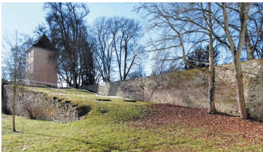
Geschützrampe an der Innenseite der Villingener Stadtmauer im Bereich Franziskanergarten.