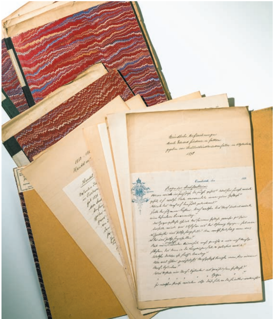
Mappen mit Notizen aus ethnografischen Feldforschungen, u. a. zur Strohflechterei (aufgeschlagen), Stadtarchiv Villingen-Schwenningen, Abt. 2.42.1.

Die Strohflechterei zieht sich thematisch wie ein roter Faden durch das Material, sodass die Dinge selbst mit Informationen individueller Inventarkarten, Bildarrangements sowie ethnografischen Notizen des Sammlers bzw. seiner Agenten hinterlegt werden können. Somit wird die Kontextualisierung der Objekte möglich. Es offenbaren sich Bedeutungen, die über deren reine Materialität und die Extrakte der wirtschaftshistorischen Gewerbebeschreibungen hinausgehen. Das Quellenmaterial gibt uns darüber hinaus einen spezifischen Einblick in die Perspektive des Sammlers auf seine zusammengetragenen Objekte.