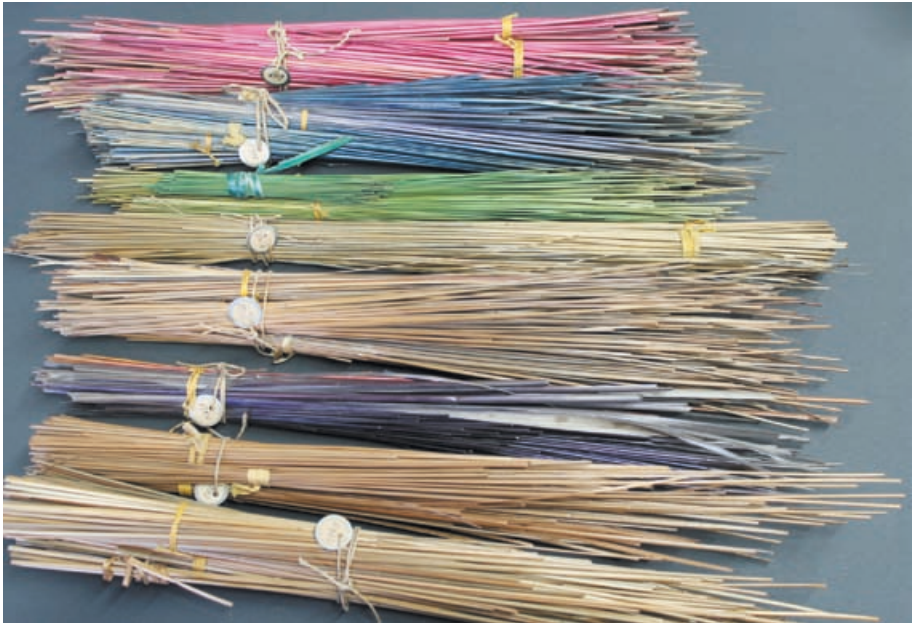
Bündel mit verschieden eingefärbten Strohhalmen, die Spiegelhalder 1912 in Schonach erwarb. Franziskanermuseum Inv. 05802 bis 05809