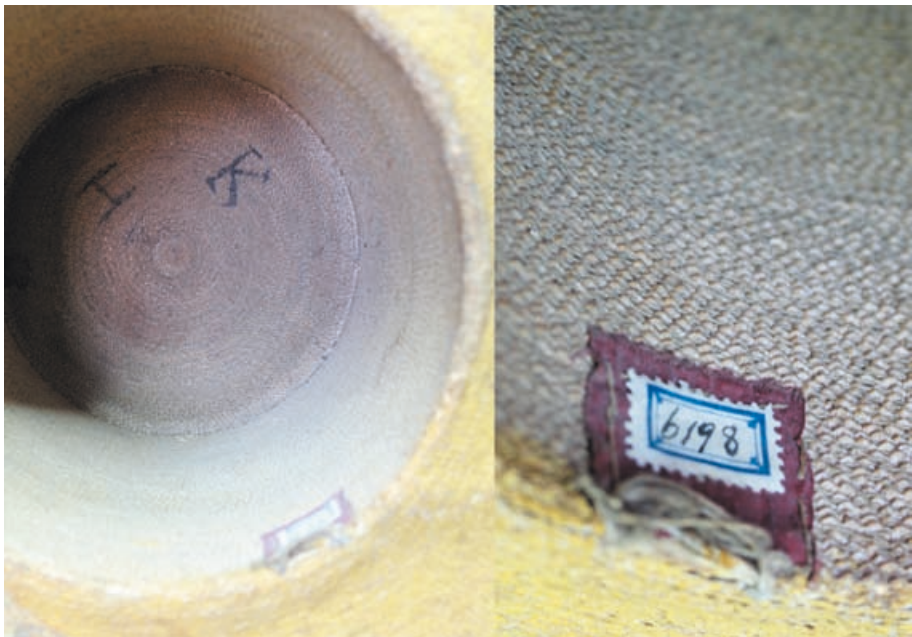
Unlackierte Innenseite des gelben Strohzyinders (links) und Detailbild des von Spiegelhalter aufgebrauchten Inventaretiketts (rechts). Franziskanermuseum Inv. 06198

Überblickend wird deutlich, dass alle Fragen Spiegelhalters den Bereich der Herstellung und der Ökonomie tangieren. Auffallend ist, dass er mit keiner