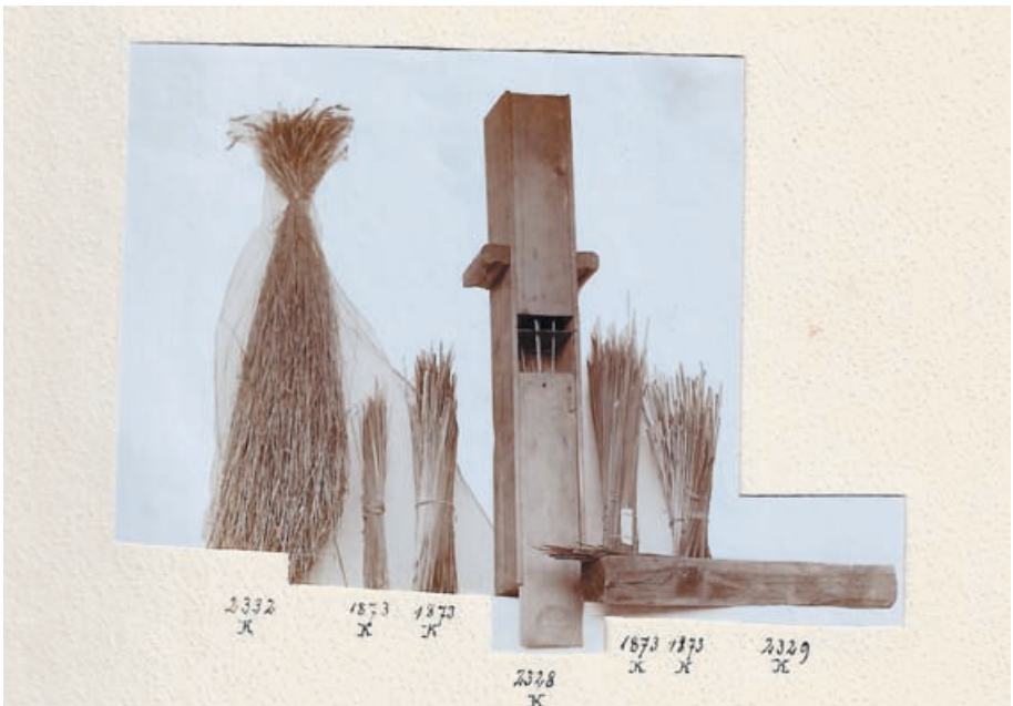
Ähnliche Bündel aus der zweiten Sammlung in Karlsruhe arrangierte er mit einem Halmsieb in seiner Samlungsdokumentation. Stadtarchiv Villingen-Schwenningen Abt. 2.42.1 - Mappe 13