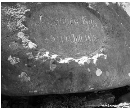
Hussenstein Konstanz.

ter Aufweis des Plazes bei der Stadt Konstanz, auf welchem Johannes Hus und Hieronymus von Prag in den Jahren 1415 und 1416 verbrannt wurden 123 „als öffentliches Zeichen der Hochachtung (...) weihte“.