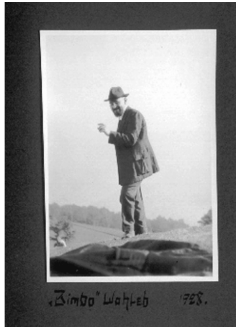
»Bimbo«. Fotoalbum Familie Wielandt.