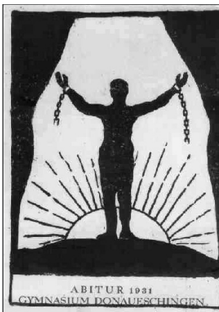
Abitur 1931.

Vorerst ist daran nicht zu denken. Er muss eher banale Dienstgeschäfte erledigen, Fußbodenöl beim Bezirksbaumeister bestellen, 2.850 Kilogramm Unionbriketts liefern lassen 86 und Brennholz anfordern 87 . Er meldet dem MKU die Bewerber für die Studienstiftung des Deutschen Volkes , veranlasst die Vorbereitungen für eine Brandprobe und dankt Frau Wagner, Ehefrau des hiesigen Amtsgerichtsrats, für ihre Tätigkeit im Elternbeirat. 88