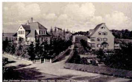
Haus Hecht (links) im Jahr 1934, früher „Villa Luise“.

Seine Lehren als Lithograph und Anstreicher in Basel, dann als Uhrenschildmaler in Furtwangen, brach er kurzerhand ab. Autodidaktisch versuchte er sich in Malen und Zeichnen, bevor er 1859 von der Großherzoglichen Kunstschule in Karlsruhe aufgenommen wurde. Seine Studien – unter anderem bei Johann Wilhelm Schirmer, einem Vertreter historisierender idealer Landschaftsmalerei – schloss Thoma im Jahr 1866 ab und ging nach Aufhalten in Basel und Düsseldorf zusammen mit Otto Scholderer zwei Jahre später nach Paris, wo ihn besonders die Werke Gustave Courbets und die Arbeiten der Barbizon-Schule beeindruckten.