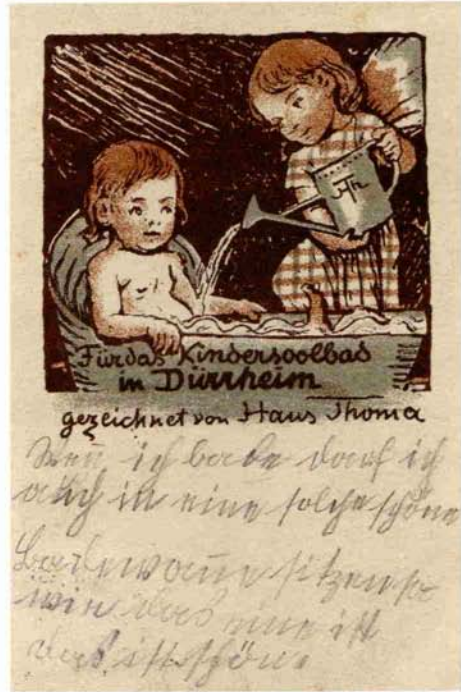
Postkarte für das „Kindersoolbad“.

Dass er im Jahre 1913, zwanzig Jahre vor der „Machtergreifung“, einem seiner Wotane „Thors Hammer“, ein Hakenkreuz, auf den Brustpanzer malte, macht ihn indes nicht zum Nationalsozialisten. Adolf Hitler hat seine Werke später sehr geschätzt und 23 Bilder des Malers für die geplante „Führersammlung“ in Linz ankaufen lassen. Gegen die Vereinnahmung seiner Werke durch die Nationalsozialisten konnte sich Thoma nicht mehr wehren. Er starb am 7. November 1924 in Karlsruhe und wurde auf dem dortigen Hauptfriedhof beigesetzt.