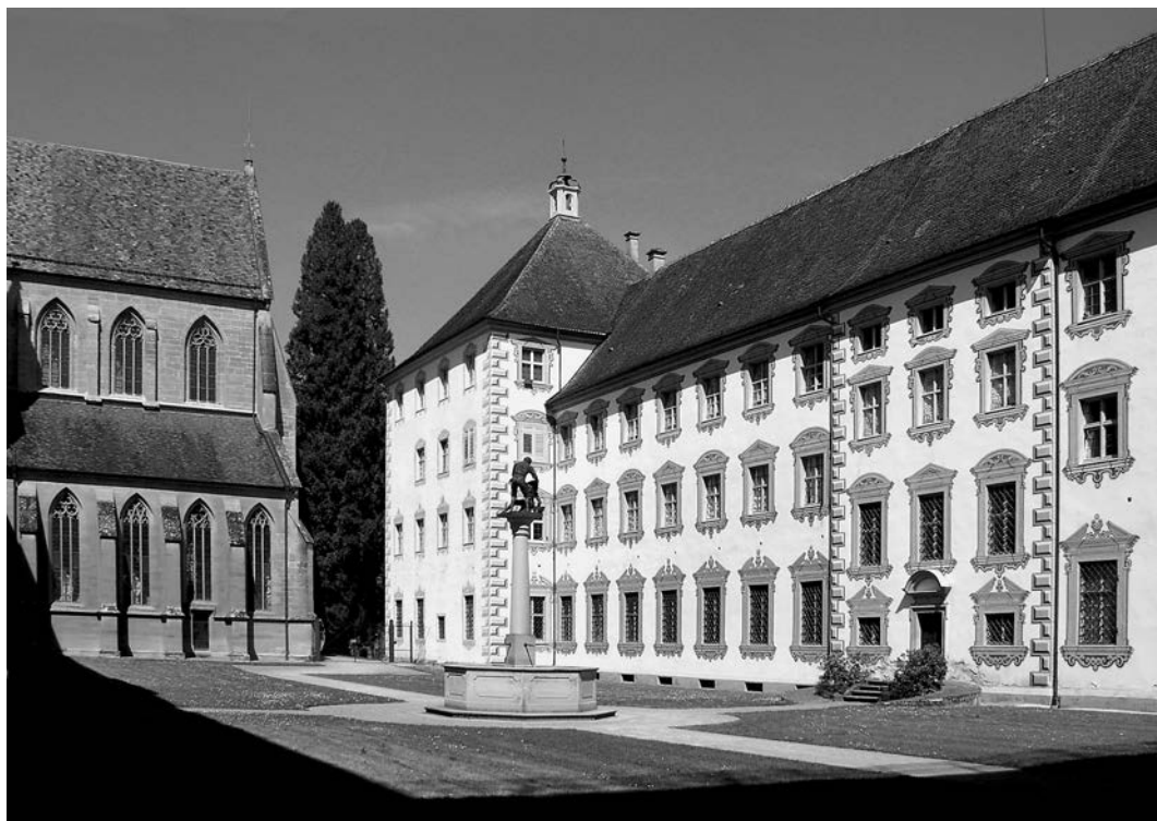
Zwischenhof zwischen Konventsgebäude und Prälatur, mit illusionistischer Architekturmalerie. Links der Chor der ehem. Klosterkirche

gängeranlage des 15. Jahrhunderts, wohl die mittelalterliche zisterziensische Gliederung schon nicht mehr aufgriffen. Gleichzeitig wurde die Klosterkirche einer ersten barocken Überarbeitung unterzogen. Dieser Neubau stand unter der Leitung des Kemptener Baumeisters Balthasar Seuff und hatte bereits monumentale Ausmaße. Drei Säle, jeder von ihnen ca. 300 m 2 groß, verdeutlichten die Reputation, die der Konvent in seiner Zeit beanspruchte.