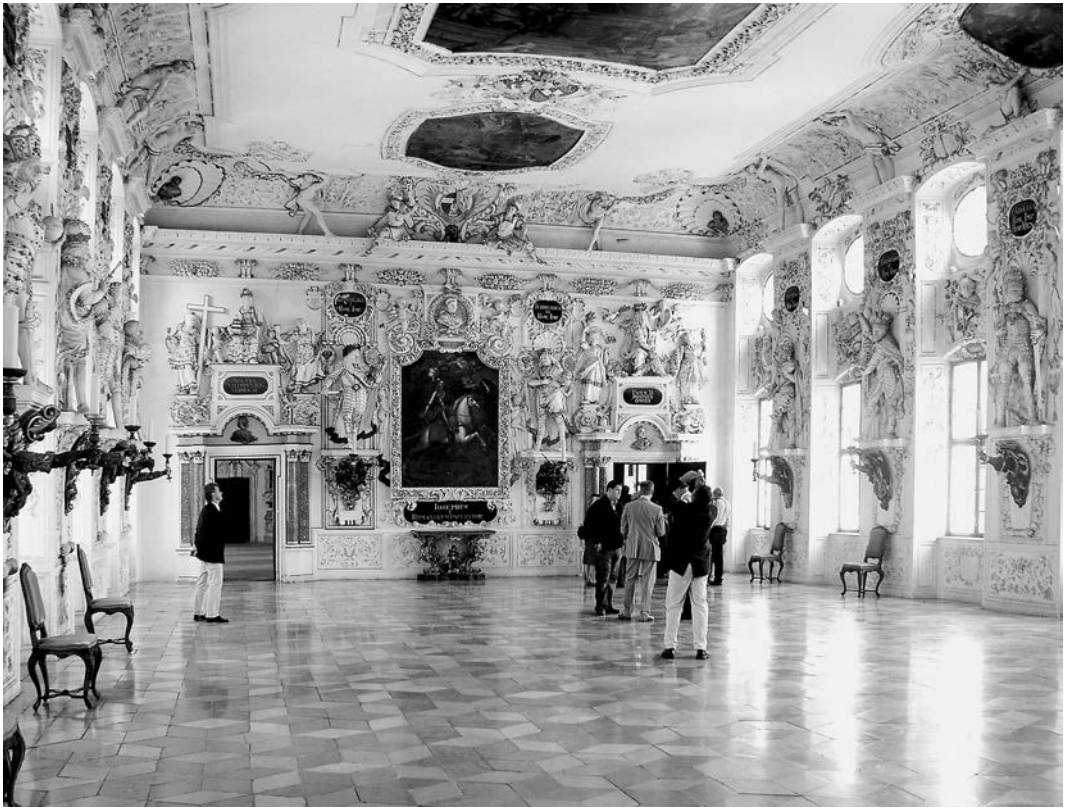
Kaisersaal mit den Stuckfiguren von Franz Anton Feuchtmayer, Nordseite