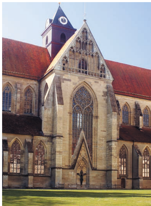
Fassade des Nordquerhauses der ehem. Klosterkirche mit dem großen Maßwerfenster

Der Chor ist, wie bereits erwähnt, nicht in ursprünglicher Form erhalten. Er war bis zum Umbau 1751 ein Binnenchor innerhalb eines rechteckigen Umgangschores, der die beiden Chor-Seitenschiffe miteinander verband 9 . Die Kirche folgte damit dem Vorbild von Citeaux II,