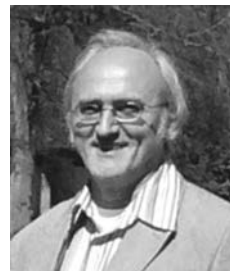
Anschrift des Autors: Dr. Christoph Bühler Lochheimer Straße 18 69124 Heidelberg