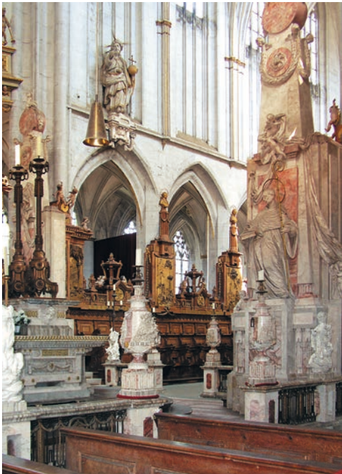
Inneres der Klosterkirche

1751 brach Johann Caspar Bagnato diese Oberkapelle samt den Gewölben des östlichen Chorumgangs ab und zog den Chorraum, indem er die Profile und Schlusssteine der verbleibenden Gewölbepartien anglich, bis zur Ostwand der Kirche vor. Um dieselbe Zeit überformte Josef Anton Feuchtmayer das Brüstungsmaßwerk am nördlichen Querhausgiebel in barock-neugotischen Formen.