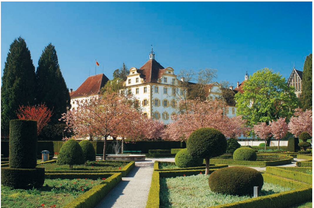
Nordostecke der Prälatur, vom Hofgarten aus gesehen

der Mönche bestimmen. „ Hast du erst ein eigenes Gebetbuch, so willst du über ein kurzes einen eigenen Diener, der dir das Gebetbuch trägt “, soll der größte der Zisterzienseräbte, der heilige Bernhard von Clairvaux zu einem Mönch gesagt haben. Und die Einfachheit im täglichen Leben gab schließlich in Maulbronn Anlass zur Geschichte um den Elfinger Wein. Getreu den großen Vorbildern, den Mutterklöstern in Burgund, war der geeignete Ort für eine Klostergründung ein abgeschiedenes Tal, in dem die Mönche die vom Orden geforderte Distanz zur Welt leben konnten.