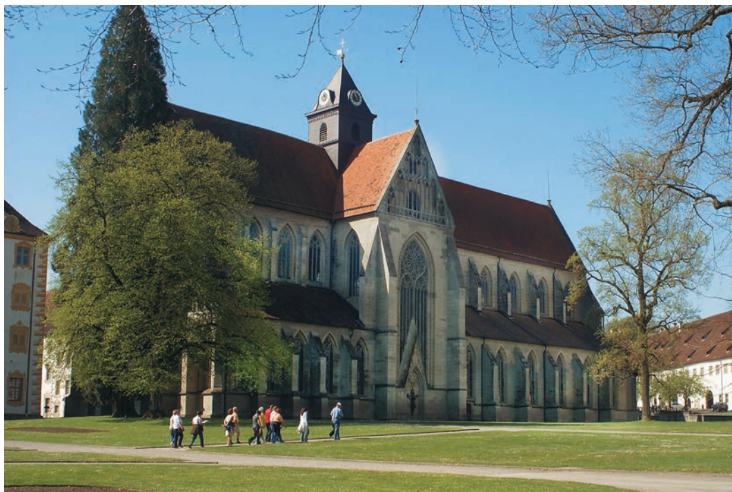
Nordseite der ehemaligen Klosterkirche

ges Absatzgut aber war der Wein, der aus einem geschlossenen Anbaugebiet am Bodensee – „gezielt für den Markt produziert“ – im Raum zwischen Lech und Donau abgesetzt wurde.