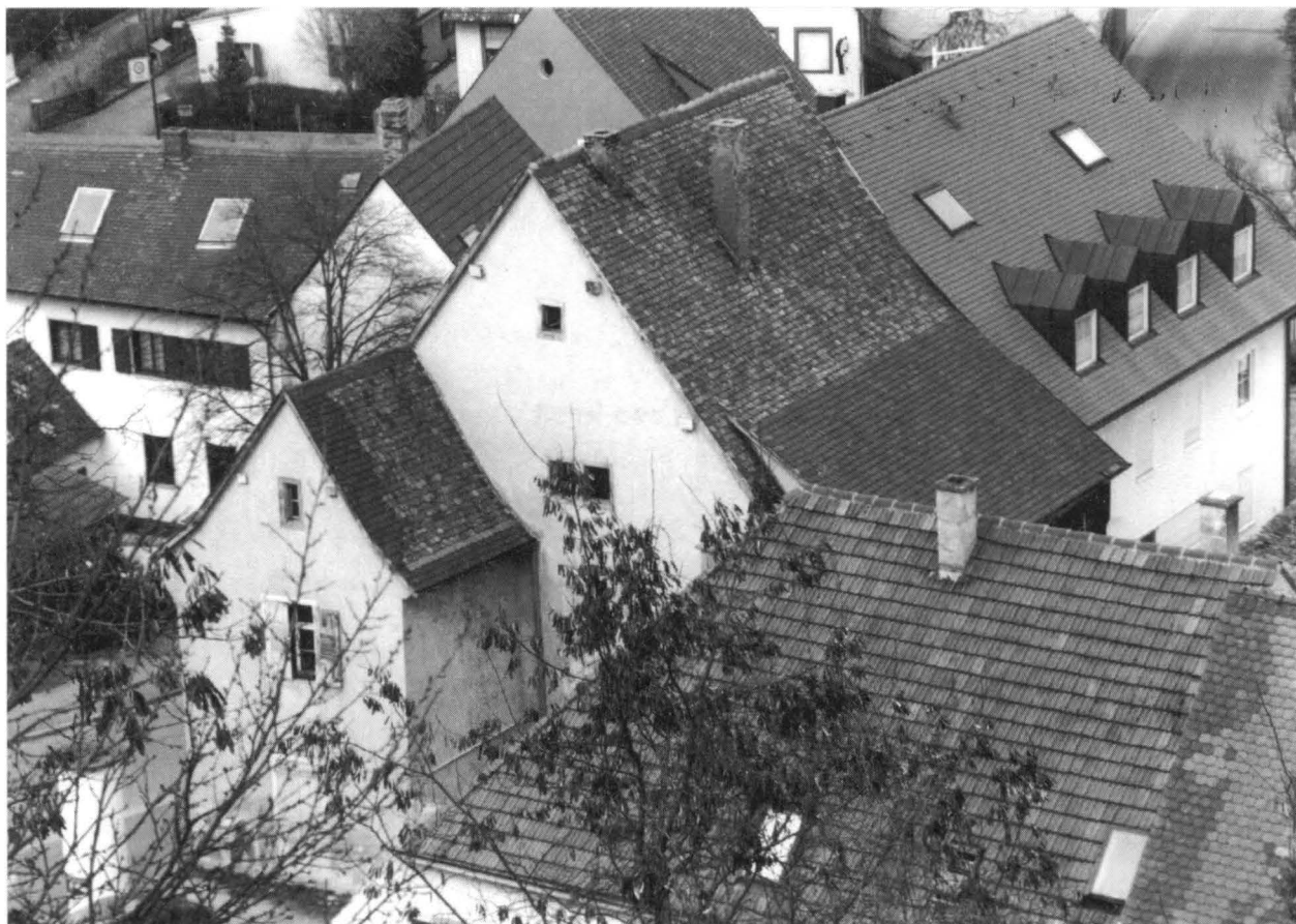
Abb. 4 Das israelitische Gemeindehaus (Kornweitz)