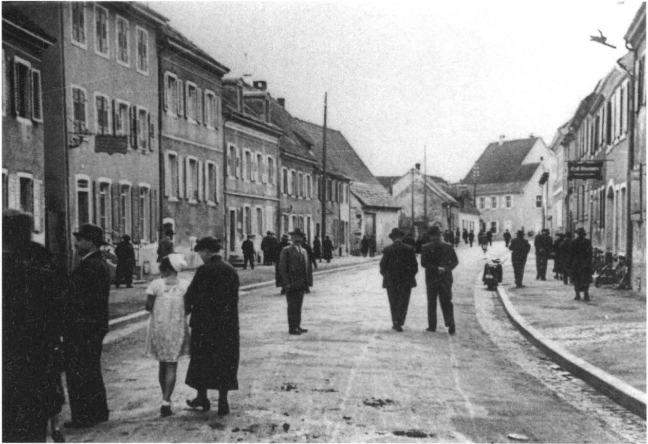
Abb. 6 Die Breisacher Judengasse um 1937 (Bähr)

Schon vor ihrer Vereinigung mit der Israelitischen Religionsgemeinschaft von Nordbaden hatte die südbadische Landesgemeinde das neben dem alten jüdischen Friedhof gelegene Häuschen, in dem früher der Synagogendiener gewohnt hatte, an einen Breisacher Bürger veräußert. Nur die Hälfte der Wohnhäuser, die die Reichsfinanzverwaltung im Nordteil der Unterstadt konfisziert hatte, ist in den Jahren 1949-1953 an ihre früheren Besitzer oder deren Erben restituiert worden. 6