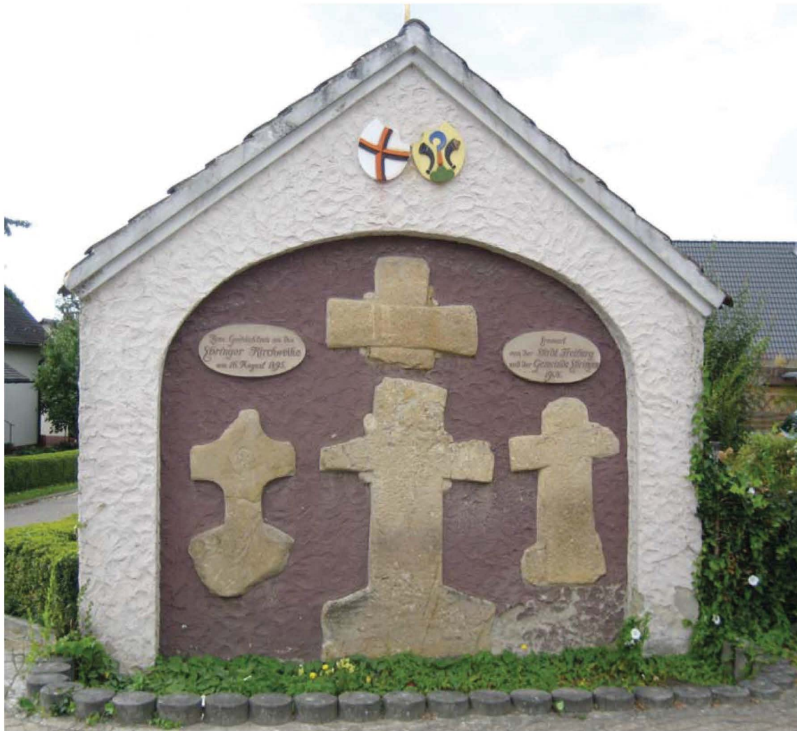
Abb. 1 Die Ebringer Steinkreuze, die entgegen früherer Meinung keine Sühnekreuze sind; Aufnahme 2011.

Vermutung geäußert wird, dass der 1495 erfolgte Totschlag der Anlass für die Errichtung der vor dem Dorf befindlichen Steinkreuze gewesen sein mochte. 5 Gerade dieses Detail wurde in den folgenden Jahrzehnten immer wieder aufgegriffen und hat in der ortsgeschichtlichen Literatur zu phantasievollen Ausschmückungen des Tathergangs und seiner Folgen und nicht zuletzt im Jahre 1908 gar zur Errichtung des Steinkreuzdenkmals am Dorfrand geführt (Abb. 1). 6 Inzwischen hat jedoch die Sühnekreuz-Hypothese ihren Platz in der Rubrik „Sagen“ gefunden. 7