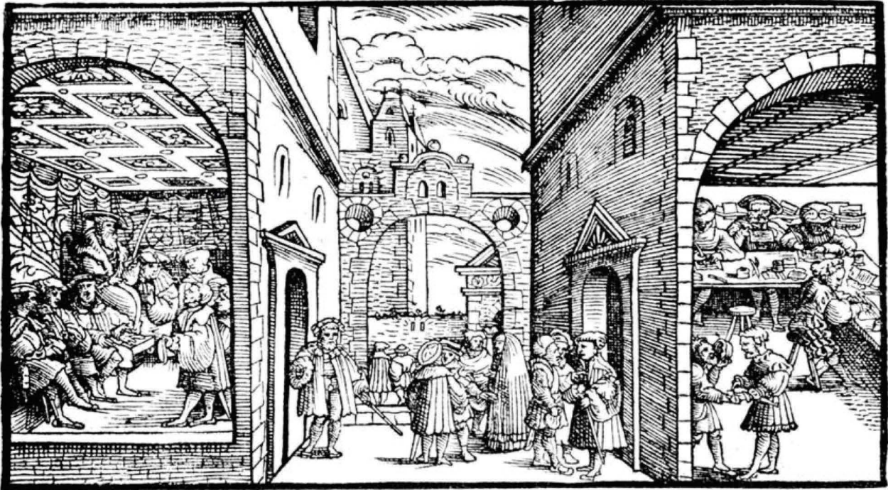
Abb. 4 Das Rottweiler Hofgericht (aus: Alte Rottweiler Hofgerichtsordnung, Frankfurt 1535).

formalisierte Prozessgang gestattet keine persönlichen Reden der Parteien, sondern der Vortrag erfolgt durch das Sprachrohr der Fürsprecher, die meist aus der Reihe der Urteilsprecher genommen werden.