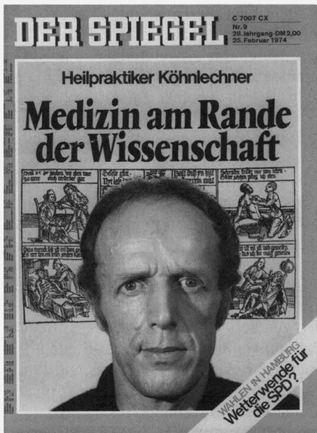
SPIEGEL-Titelbild vom 25.2.1974