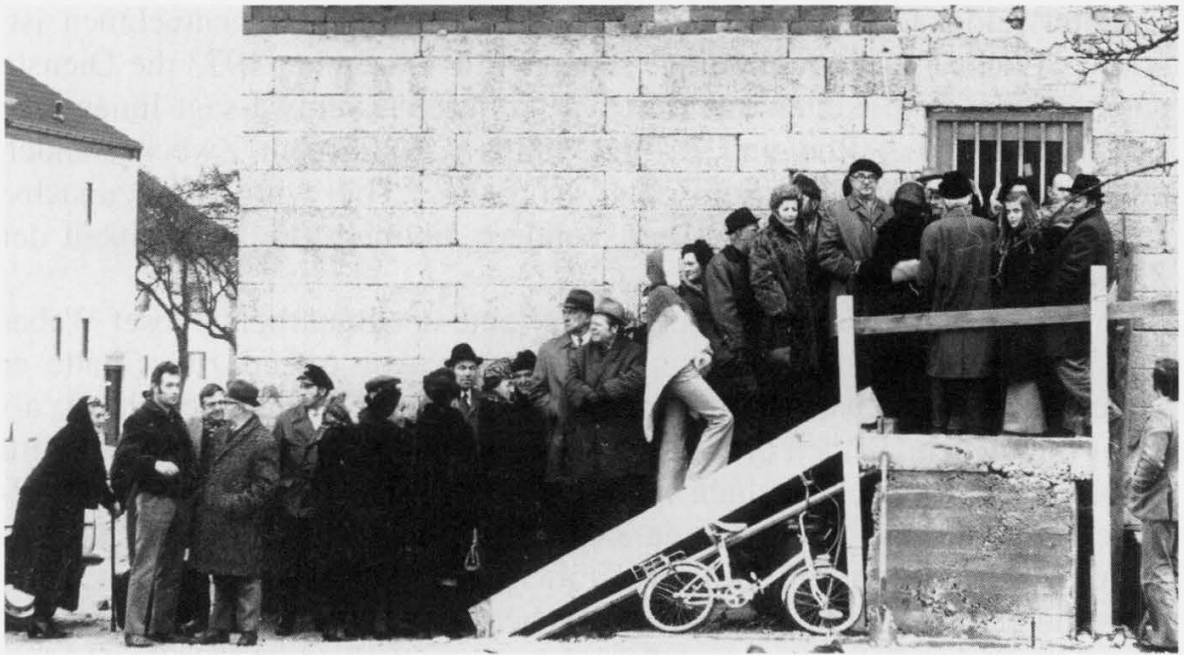
Besucherandrang vor dem Wohnhaus – OFFENBURGER TAGEBLATT vom 26.1.1974