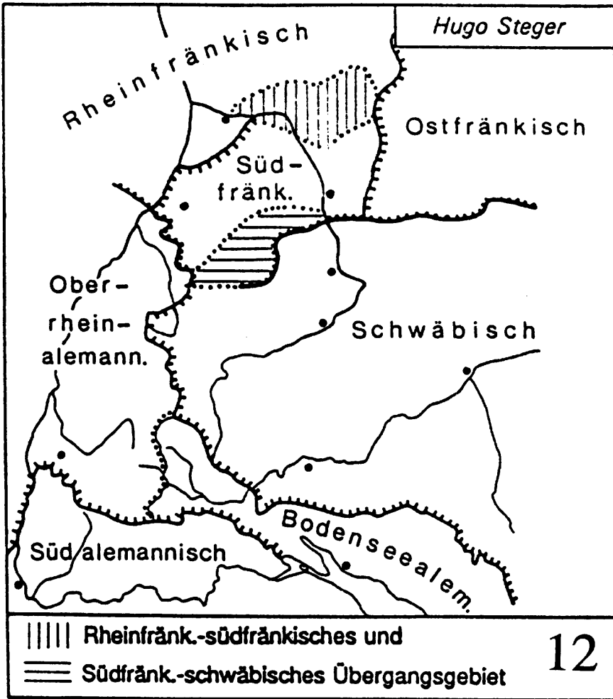
Abb. 2: Gliederung des Alemannischen nach Steger / Jakob, 1983. Abdruck nach KLAUSMANN / KUNZE / SCHRAMBKE, Kleiner Dialektatlas (wie Anm. 7), S. 30

und im Verlauf seiner Geschichte mehrfach die Staatszugehörigkeit zwischen deutsch und französisch wechselte, was wiederum mit einer jeweils anderen nationalstaatlich geprägten Sprachpolitik verbundenen war. 5