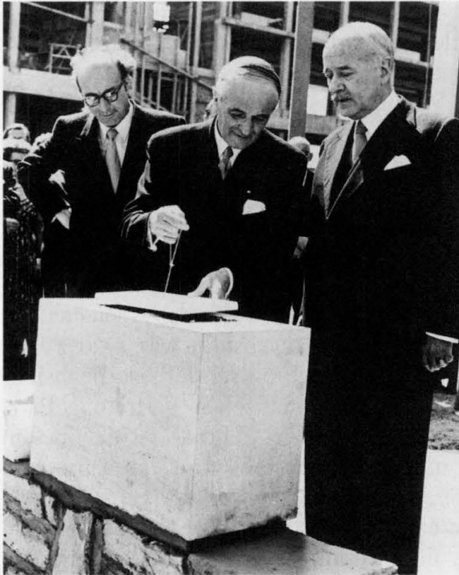
Wilhelm Hausenstein und André François-Poncet (re.) bei der Grundsteinlegung zum Deutschen Haus in der Cité Universitaire von Paris; 1954

und höchste Beamte des Außenministeriums; Künstler und Schriftsteller, darunter Raymond Aron und Jean Schlumberger; und andere Vertreter des öffentlichen Lebens. Ein paar Tage später, am 16. Mai, reiste Hausenstein ab; auf der Gare de l'Est erschienen, unter anderen, wieder viele Mitglieder des diplomatischen Corps, wieder mit dem Nuntius an der Spitze, und blieben, bis der Zug abfuhr. Welch ein Unterschied zu seiner Ankunft am selben Ort und vor fünf Jahren, als nur ein einziger und nicht sehr freundlicher französischer Beamter gekommen war! Welch ein Unterschied auch zum Empfang, den sein Nachfolger erhielt: dieser wurde in der Botschaft abgeholt und in den Elysée geleitet, in dessen Innenhof eine Kompanie der Republikanischen Garde das Gewehr präsentierte; dann wurde er vom Staatspräsidenten und vom Ministerpräsidenten empfangen.