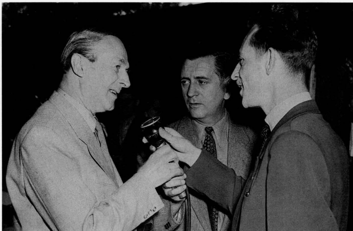
Wilhelm Hausenstein bei der Ankunft in Paris; 1950