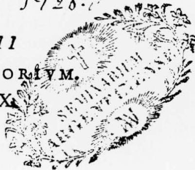
Titelblatt mit ausgestrichenem Besitzvermerk der Abtei (BGS 1 Jg 24)

INGOLSTADII Apud DAVIDEM SARTORIUM. Anno M. D. LXXX.