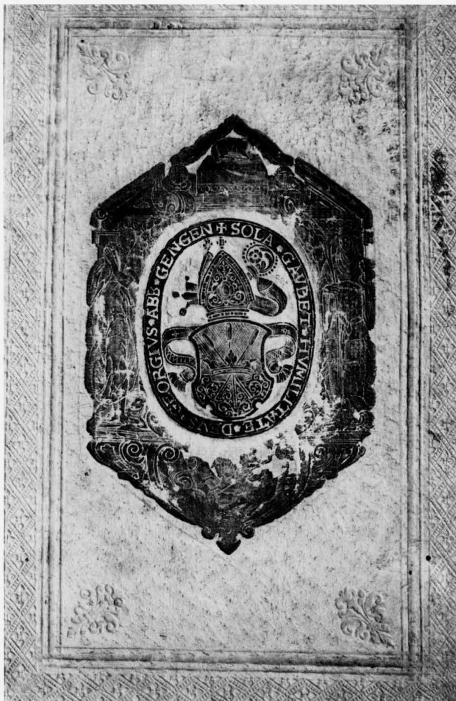
Super-libris mit dem Wappen des Abtes Georg Breuning (RIB 1 Gb 10)