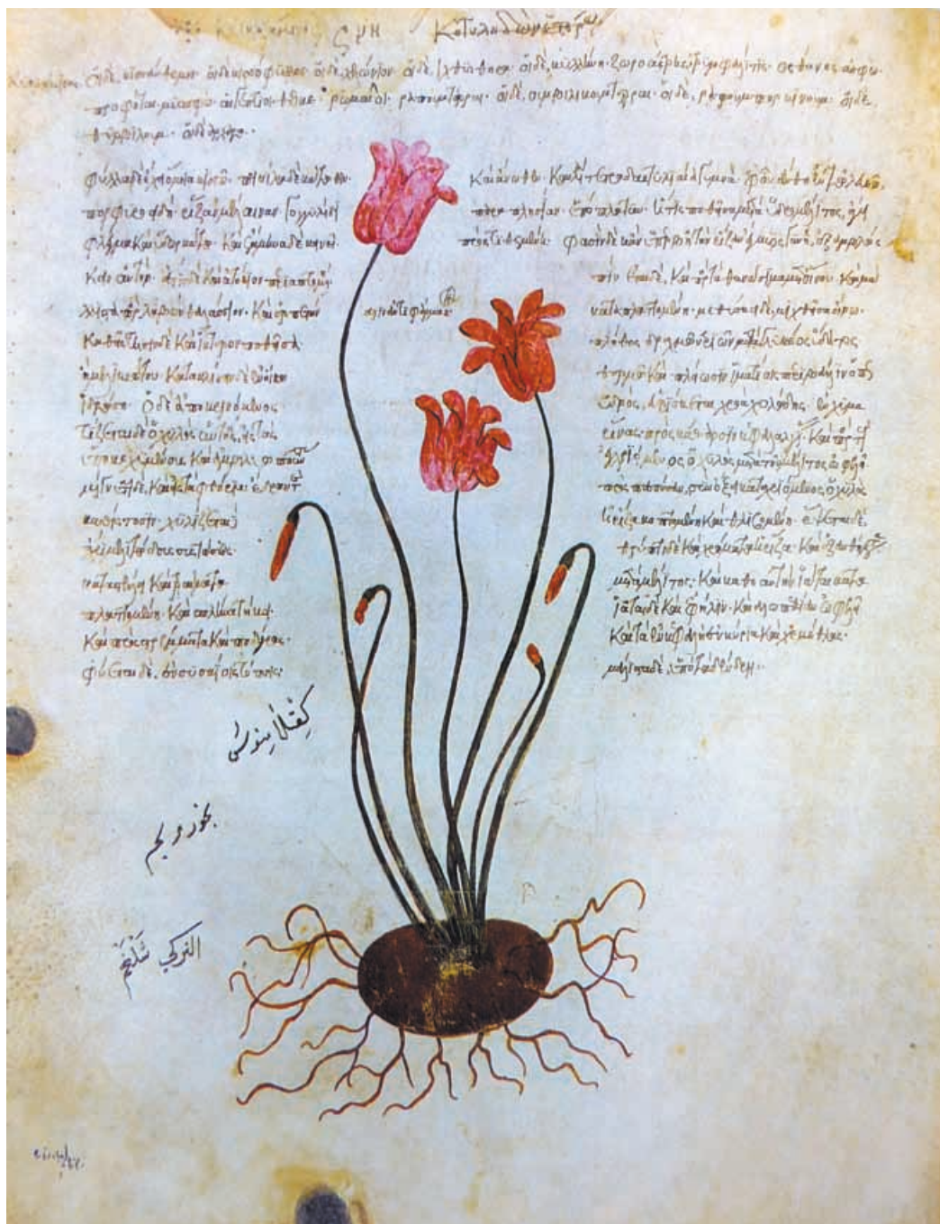
Wiener Dioscurides (512).

Abbildung aus „Glanzlichter der Buchkunst 8“, ADEVA – Akademische Druck- u. Verlagsanstalt Graz 1998.