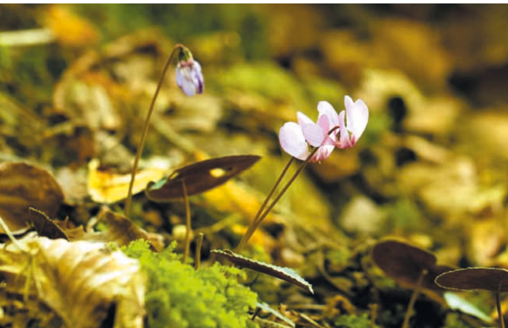
Alpenveilchen, fotografiert bei Schleithelm.

Das Alpenveilchen ist eine Art aus der Gattung Cyclamen der Familie Myrsinaceae , ehemals Primulaceae , und ist in Mitteleuropa von Ostfrankreich über die Alpen bis zur Slowakei und im Süden bis nach Kroatien beheimatet. Nördlich der Alpen gibt es einige Vorkommen vom Alpenveilchen wie in Südwestdeutschland (Mühlheim, Kisslegg, Salem, Brigachtal) und der Schweiz (KELLER 1998). WELTEN und SUTTER (1982) nahmen als nächste Umgebung den