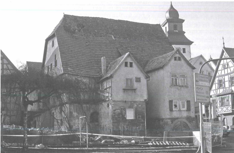
Abbildung 1. Das ehemalige Storchenhause in Willsbach im östlichen Landkreis Heilbronn wenige Tage vor dem Abriss Ende der 1990er Jahre. Auf seinem Dach brüteten 1956 letztmals erfolgreich Weißstörche im Unterland.

Einem Zeitungsbericht von H. HAAS vom 22.10.1954 zufolge brüten Störche „seit Menschengedenken hier auf einem der ältesten Bauernhäuser an der Bundesstraße... Nur um 1870 blieben sie etliche Jahre fern,