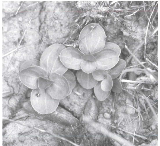
Abbildung 1. Rosettenstadium von Blackstonia perfoliata. 10.08.2001, „Blansinger Grien“ bei Istein.

Beobachtung der Entwicklung unter Freilandbedingungen mitgenommene Rosette wurde nach einigen Wochen durch Gräser regelrecht "gesprengt". Diese Beobachtung unterstreicht die Konkurrenzschwäche der Art. B. perfoliata -Pflanzen, die im zeitigen Frühjahr 2002 aus Samen gezogen und in Blumentöpfen ohne Düngung im Freien gehalten wurden, kamen nicht zur Blüte. Die intensiv grün bleibenden Rosetten überstanden mehrere Fröste, starben schließlich aber während einer mehrtägigen Kälteperiode mit Temperaturen <-10°C im Januar 2003 ab. Die Grundblätter von B. acuminata erschienen erst ab Juli; ihre Blütezeit erstreckte sich von Anfang August bis Ende September. Am 29.07.2001 waren an Fundort 2 sowohl blühende Exemplare als auch Rosettenstadien von B. acuminata zu finden. An Fundort 3 waren am 29.08.2001 die meisten Exemplare bereits vertrocknet.