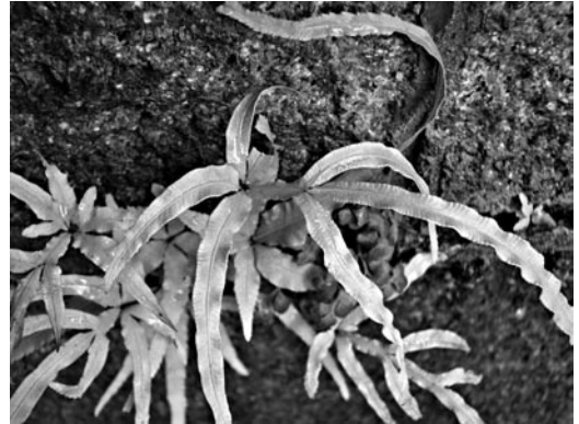
Abbildung 1. Saumfarn Pteris multifida an der Fettquelle am Florentinerberg (Foto: A. RADKOWITSCH, 2008).

An der Fettquelle, am Fuß des Florentinerberges, wächst Pteris multifida (Abb. 1) oberhalb des Quellaustrittes in den Mauerfugen des süd-exponierten Treppenaufganges. Trotz der sonnenexponierten Lage scheint die Luftfeuchtigkeit am Wuchsort für den Farn auszureichen. Die wintergrünen Pflanzen sind gegenüber angegebenen Wuchshöhen von bis zu 90 Zentimetern mit maximal 30 Zentimetern eher klein (LAUBER & WAGNER, 2007). Mit etwa 25 Pflanzen verschiedener Größe und Alters ist die Population verhältnismäßig groß. Das von O. BRETTAR entdeckte Vorkommen ist etwa seit 1964 am Wuchsort bekannt (G. PHILIPPI, mdl. Mitteilung). Die Art wurde allerdings bis heute nicht genau bestimmt. Es