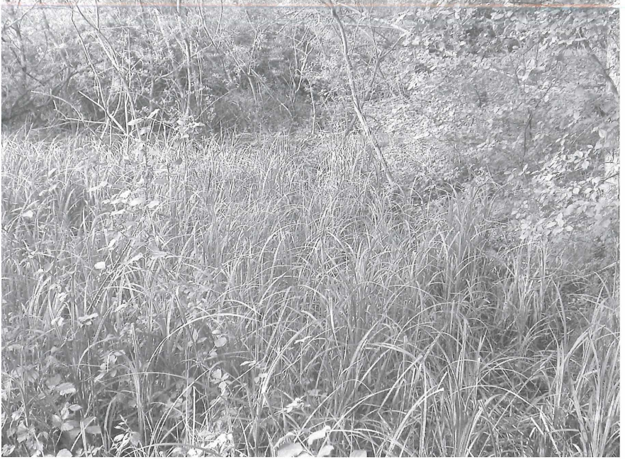
Abbildung 2. Blick auf die in der Aue des "Inneren Rheins" gelegene Probestelle. Die Bodenfallen waren in einer mit Sumpf- ( Carex acutiformis ) und Ufersegge ( C. riparia ) bewachsenen Senke exponiert, die in einem lichten Galeriewaldrest liegt. – Foto: A. SCHANOWSKI (6. Mai 2003).