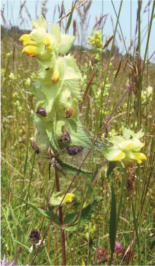
Abbildung 3. Detailaufnahme einer artenreichen Magerwiese mit Ruchgras ( Anthoxanthum odoratum ) und Klappertopf ( Rhinanthus alectorolophus ).