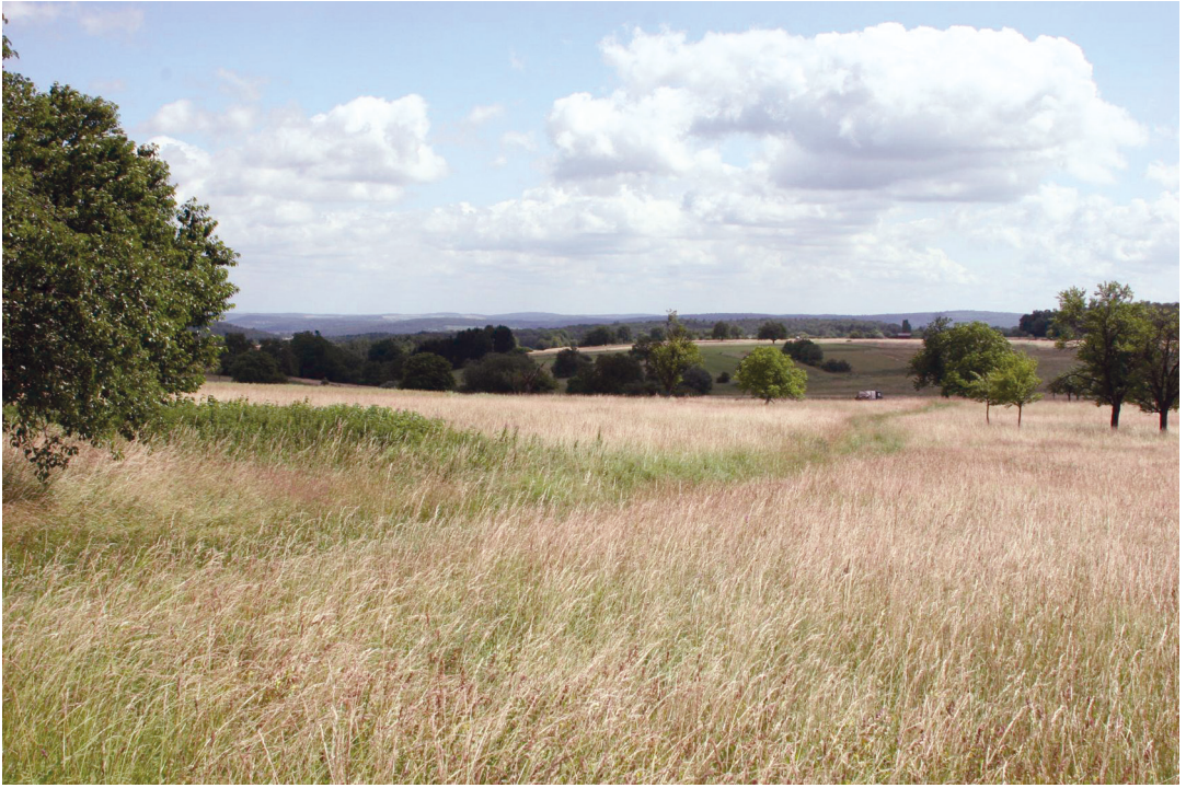
Abbildung 2. Blick in das Naturschutzgebiet Pfinzquellen.

Insgesamt wurden 21 nach § 30 BNatSchG / § 33 NatSchG geschützte Offenland- bzw. Waldbiotope kartiert. 420 verschiedene Arten von Farn- und Blütenpflanzen wurden nachgewiesen, von denen 22 auf der Roten Liste Baden-Württembergs stehen. Dreizehn dieser Arten sind nach § 44 BNatSchG besonders geschützt, zwölf sind darüber hinaus streng geschützt.