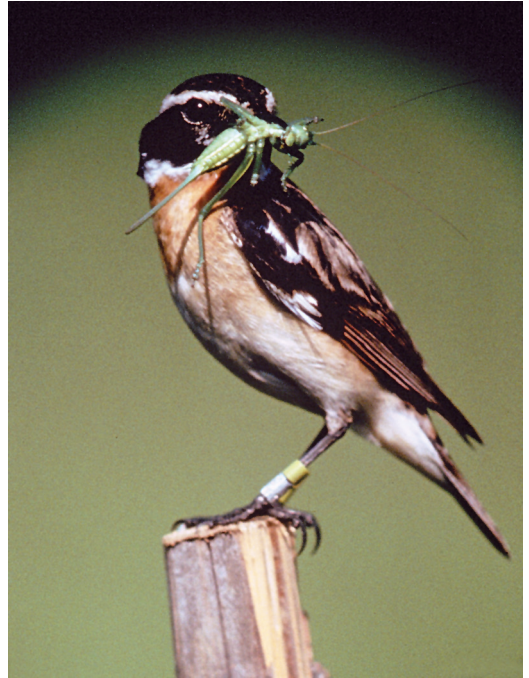
Abbildung 7. Das Braunkehlchen ( Saxicola rubetra ), ein seltener Brutvogel der Pfinzquellen.

Der Feldhase ( Lepus europaeus ) steht mittlerweile ebenfalls auf der Vorwarnliste Baden-Württembergs und ist deutschlandweit sogar gefährdet (BINOT et. al. 1998).