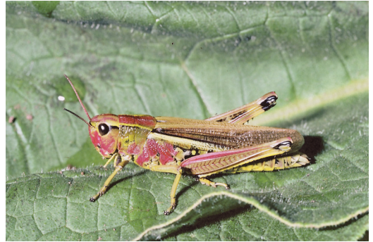
Abbildung 8. Die Sumpfschrecke ( Stethophyma grossum ) findet man in frischen bis feuchten Wiesen.

Die Sumpfschrecke bevorzugt als Lebensraum feuchte Grünlandstandorte wie Seggenriede und vor allem Nasswiesen. Durch die Trockenlegung und Intensivierung von Feuchtlebensräumen ist die ehemals verbreitete Art heute sehr selten geworden. Im Bereich des NSG „Pfinzquellen“