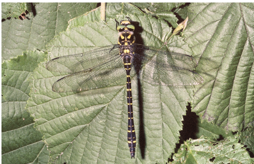
Abbildung 13. Die Zweigestreifte Quelljungfer ( Cordulegaster boltonii ) nutzt selbst kleinste Quellrinnale zur Eiablage.

In dem Naturschutzgebiet leben elf Libellen-Arten. Alle sind nach BNatSchG besonders