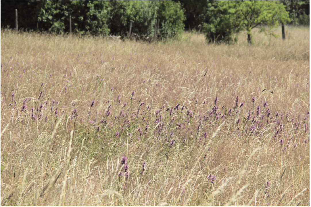
Abbildung 15. Blühender Heilziest ( Stachys officinalis ), die Nahrungspflanze der stark gefährdeten Späten Ziest-Schlüßbiene ( Rophites quinquespinosus ). Der späte Blühzeitpunkt ist am abgetrockneten Gras sehr gut zu erkennen.