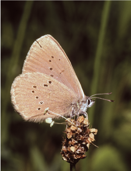
Abbildung 10. Der Dunkle Wiesenknopf-Ameisenbläuling ( Maculinea nausithous ) benötigt Wiesenknopf ( Sanguisorba officinalis ) und Ameisen für seine Larvalentwicklung.

kühlt aus und geht als Lebensraum für die Art verloren.