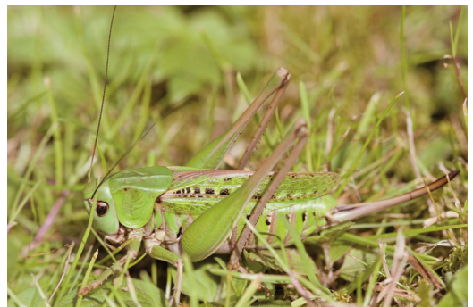
Abbildung 9. Der Warzenbeißer ( Decticus verrucivorus ) bevorzugt lückige, magere Wiesen.

Lebensraum des Warzenbeißers waren ursprünglich die Streuwiesen. Hier konnten die Sonnenstrahlen im Frühjahr ungehindert auf den lückig bewachsenen Boden treffen, ihn aufheizen und so ideale Voraussetzungen für das Gelege und die Larven schaffen. Da Streuwiesen heutzutage nur noch eine historische Landnutzungsform darstellen, findet der Warzenbeißer immer weniger geeignete Lebensstätten. In gedüngten Wiesen wird die Vegetation zu dicht, der Boden