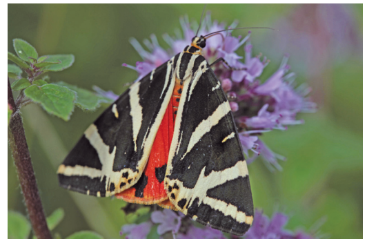
Abbildung 12. Die Spanische Flagge ( Callimorpha quadripunctaria ) bevorzugt Hochstaudenfluren mit Wasser-Dost ( Eupatorium cannabinum ).

In der im Jahr 2015 durchgeführten Untersuchung (DEUSCHLE 2015) konnten im Gebiet 41 Wildbienenarten nachgewiesen werden, darunter auch die stark gefährdete Späte Ziest-Schlüßbiene ( Rophites quinquespinosus ). Diese Art ist auf den spätblühenden Heilziest ( Stachys officinalis ) angewiesen. Die Tiere benötigen den eiweißreichen Pollen der Pflanze für die Larvenaufzucht. Sie finden diese Pflanzen nur auf entsprechend spät gemähten Wiesen, d.h. die Wie-