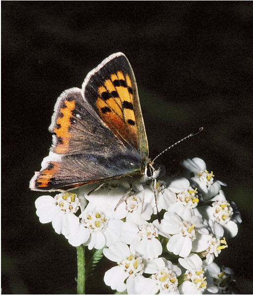
Abbildung 11. Der Kleine Feuerfalter ( Lycaena phlaeas ) ist an niedrigwüchsige Vorkommen des Kleinen Sauerampfers ( Rumex acetosella ) gebunden.

Abb. 11) und Brauner Feuerfalter ( Lycaena tityrus ). Sie zählen zwar zur Familie der Bläulinge, besitzen aber eine orange Färbung oder zumindest orange Elemente auf den Flügel-Oberseiten und Vorderflügel-Unterseiten. Der Braune Feuerfalter ( Lycaena tityrus ) ist in Baden-Württemberg zwar weit, aber mit großen Lücken und nur in kleinen Populationen verbreitet. Die Art, wie auch der Kleine Feuerfalter, steht in Baden-Württemberg auf der Vorwarnliste und ist nach BNatSchG besonders geschützt.