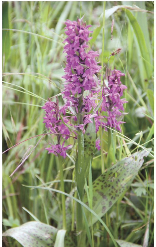
Abbildung 14. Das Breitblättrige Knabenkraut ( Dactylorhiza majalis ), welches auf feuchteren Wiesen zu finden ist.

Lineare Gehölzstrukturen im Offenland, wie der Auwald entlang der Pfinz, sind als Leitstrukturen für Fledermäuse von außerordentlicher Bedeutung und verbinden deren Teillebensbereiche miteinander.