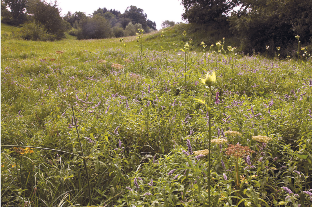
Abbildung 5. Hochstaudenflur im Gewann Wolfsgrube.

Waldes in galeriewaldartiger Struktur auf und ist meist pflanzensoziologisch nicht genau fassbar. Auch er ist ein nach § 30 BNatSchG gesetzlich geschütztes Biotop. Teilbereiche des Verlaufes der Pfinz wurden als FFH-LRT „Auenwälder mit Erle, Esche und Weide“ (Code 91 E0*) kartiert. Dieser im Sinne der FFH-Richtlinie prioritäre Lebensraum ist gekennzeichnet durch die Charakterarten Schwarz-Erle ( Alnus glutinosa ), Esche ( Fraxinus excelsior ) und Bruch-Weide ( Salix fragilis ). Des Weiteren findet man hier den Wald-Ziest ( Stachys sylvatica ), das Scharbockskraut ( Ranunculus ficaria ) oder auch das Gewöhnliche Pfaffenhütchen ( Euonymus europaeus ). Aufgrund der typischen Strukturvielfalt und den daraus resultierenden ökologischen Nischen bieten Auenwälder einer Vielzahl teils seltener Tierarten wichtigen Lebensraum und dienen aufgrund ihrer bandartigen Struktur der Biotopvernetzung.