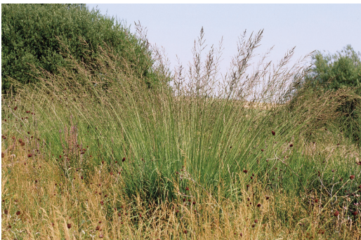
Abbildung 4. Pfeifengras ( Molinia caerulea ) im Gewann Langwiese/Hasselwiesen.

( Saxicola rubetra ) angewiesen. Kennzeichnende Pflanzenarten sind Blaues Pfeifengras ( Molinia caerulea ; Abb. 4), Gewöhnlicher Teufelsabbiss ( Succisa pratensis ), Großer Wiesenknopf ( Sanguisorba officinalis ), Heilziest ( Stachys officinalis ) und Spitzblütige Binse ( Juncus acutiflorus ). Hohe Anteile an Seggen und Binsen weisen auf Nasswiesen basenarmer Standorte hin. Diese treten auf feuchten bis nassen, meso- bis eutrophen Böden auf und kommen in einigen Bereichen im Gebiet vor. Hier sind sie durch Kriechhahnenfuß-Gesellschaften charakterisiert und werden durch Waldsimen-Sümpfe ergänzt. Weitere charakteristische Arten sind das Hundstraußgras ( Agrostis canina ), die Spitzblütige Binse ( Juncus acutiflorus ) und das Wasser-Greiskraut ( Senecio aquaticus ).