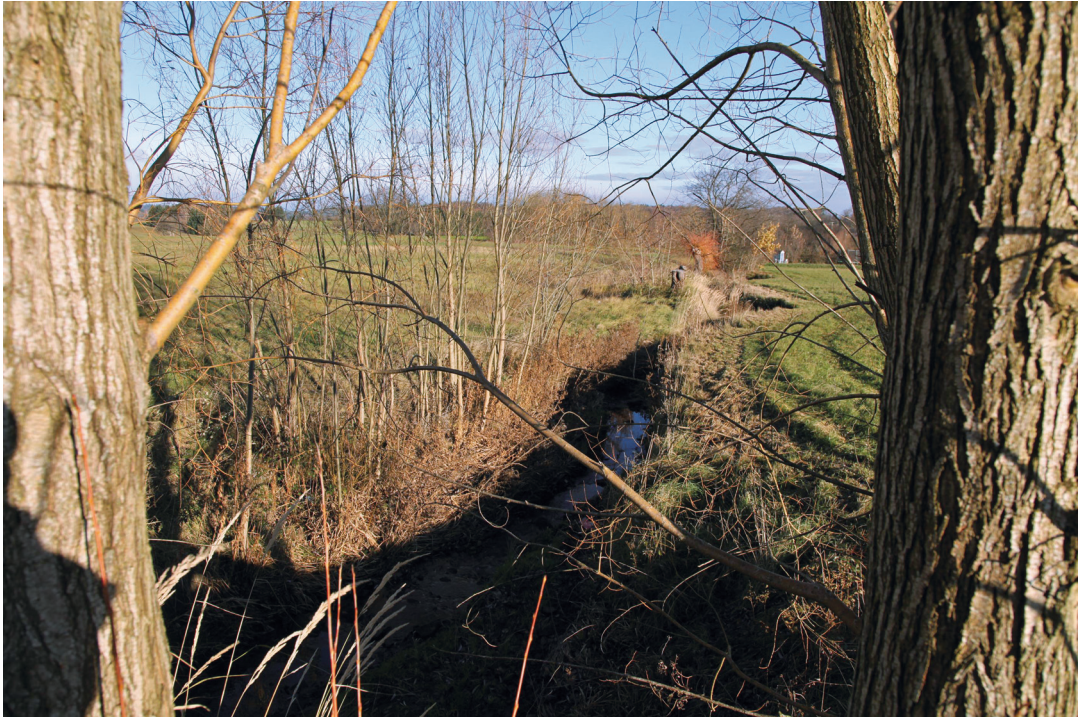
Abbildung 6. Naturnaher Bach auf Feldrennacher Gemarkung.

schaft Rückzugsräume für eine große Anzahl von einheimischen Tier- und Pflanzenarten dar. Sie sind daher als Elemente der Biotopvernetzung ebenfalls sehr wichtig und wertgebend, da viele heimische Vogelarten hier sowohl einen Lebensraum als auch einen Brutplatz finden, so z.B. die Dorngrasmücke ( Sylvia communis ) oder die Heckenbraunelle ( Prunella modularis ). Die im Nordosten des Gebietes gelegenen Wälder bestechen durch ihren alten Baumbestand aus Eichen und Buchen. Sie lassen sich als Hainsimsen-Buchenwälder ansprechen, deren bestandsbildende Art hier die Rotbuche ( Fagus sylvatica ) ist. In den alten Laubbaumbeständen finden auch einige seltenere Vogelarten einen Lebensraum. So konnten hier der streng geschützte Waldkauz ( Strix aluco ), der Pirol ( Oriolus oriolus ) und der nach Anhang I der Vogelschutzrichtlinie geschützte Mittelspecht ( Leiocopicus medius syn. Dendrocopos medius ) nachgewiesen werden. Diese Vogelarten unterstreichen die naturschutzfachliche Wertigkeit dieser Waldbereiche. Gerade die alten Eichen sind als Brutbaum für den Mittelspecht sehr wichtig. Ebenfalls auf alte