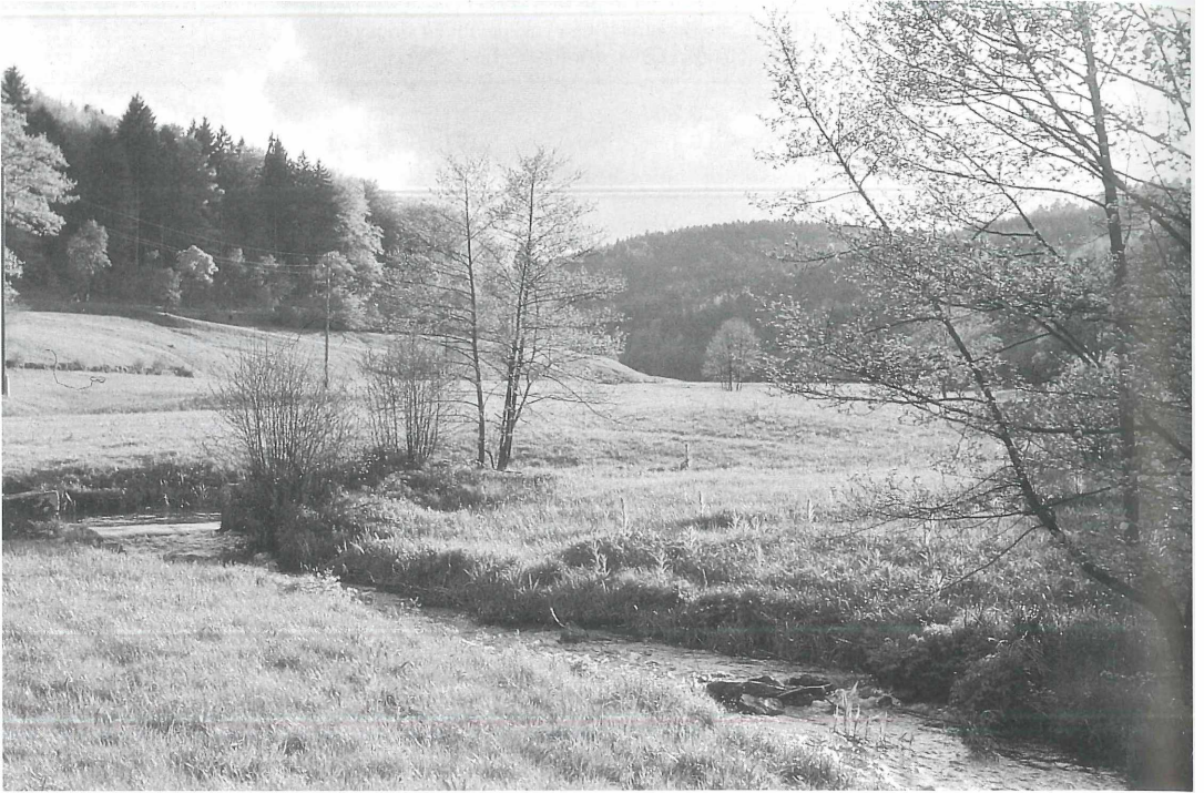
Abbildung 2. Das Moosalbtal mit der Moosalb bei Fischweier, Mai 1962.

Bracheversuchsflächen durchgeführt. Dabei war auch eine Versuchsfläche im Albtal bei Fischweier einbezogen. Regenwürmer, Spinnen, Laufkäfer und Wanzen wurden im Abstand von 10 Jahren untersucht. Mit Kesch, Bodenfalle und Klopfschirm wurden Proben auf Sukzessions- und Mulchparzellen entnommen. Die publizierten Ergebnisse sind in der Artenliste („Versuchsfläche S bzw. M“) berücksichtigt (HEMKER 1997). Ein faunistischer Gesamtüberblick über dieses interessante Gebiet liegt bisher noch für keine Insektengruppe vor. Mit dieser Arbeit wird erstmals ein größeres Teilgebiet des Nordschwarzwaldes wanzologisch erfaßt und dokumentiert. Dies ist auch deshalb wertvoll, weil dadurch die dürftigen Kenntnisse über die baden-württembergischen Wanzenfauna erweitert werden. Die Artenliste im Anhang dokumentiert 240 Arten aus dem gesamten Albgau, der das Naturschutzgebiet „Albtal und Seitentäler“, sowie das Landschaftsschutzgebiet „Albtalplatten und Herrenalber Berge“ einschließt und umfasst. Das dürfte etwa die Hälfte der im Albgau vorhandenen Wanzenarten darstellen. Darum kann es sich bei der Dokumentation nur um eine vorläufige Zwischenbilanz handeln. Die Artenübersicht zeigt, daß einige ‘gewöhnliche’ Arten z.B. der Corixidae, Coreidae, Lygaeidae, Miridae, Tingidae nicht durch Belege nachgewiesen sind. Dies ist darauf zurückzuführen, daß viele Gebiete und Biotope noch