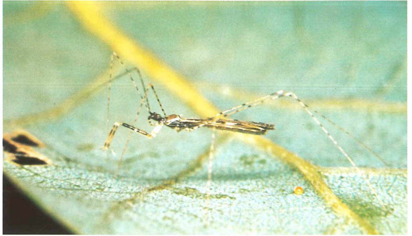
Tafel 1 a) Empicoris vagabundus L., Gemeiner Vagabund (Reduviidae).