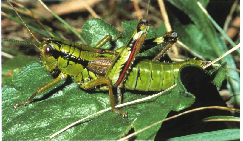
Tafel 2. a) Alpine Gebirgschrecke.