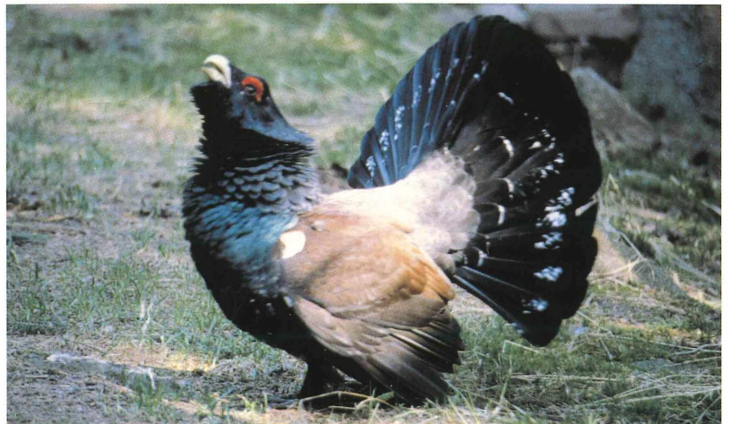
Tafel 2. c) Auerhahn.