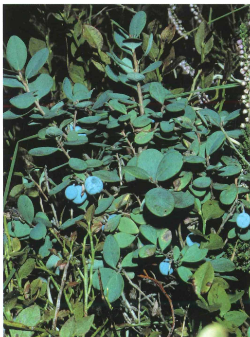
Tafel 1. c) Moorbeere.