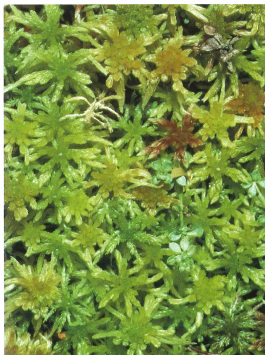
Tafel 1. b) Torfmoos. – Foto: P. ZIMMERMANN.