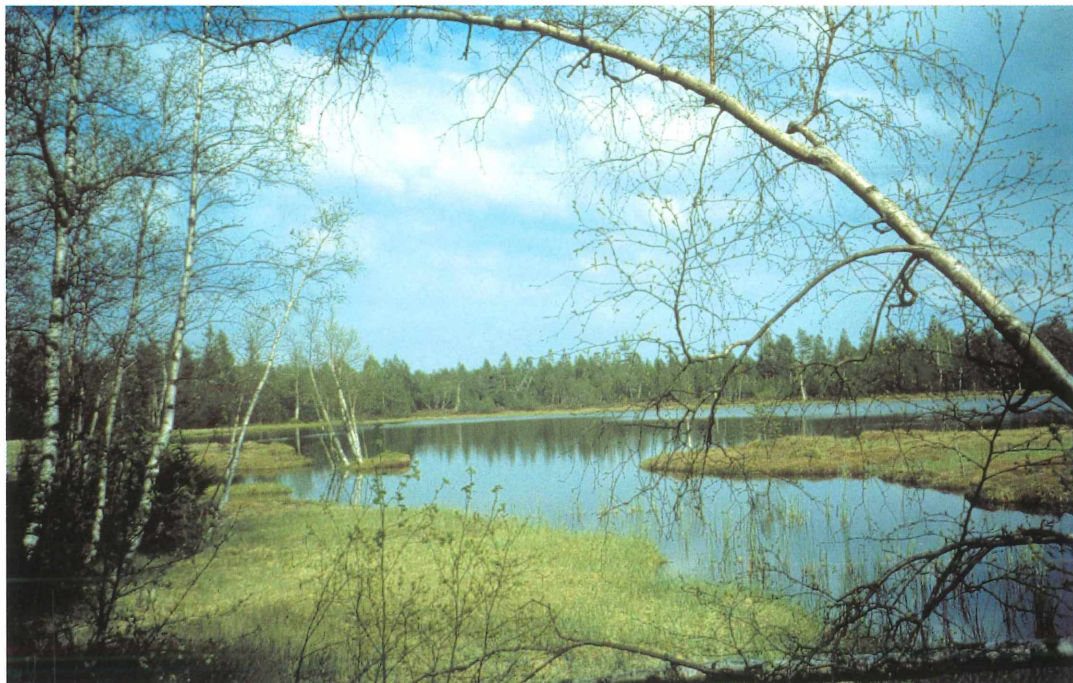
Tafel 1. a) NSG Wildseemoor.