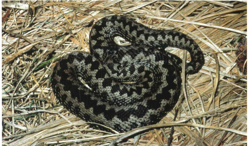
Tafel 2. b) Kreuzotter.