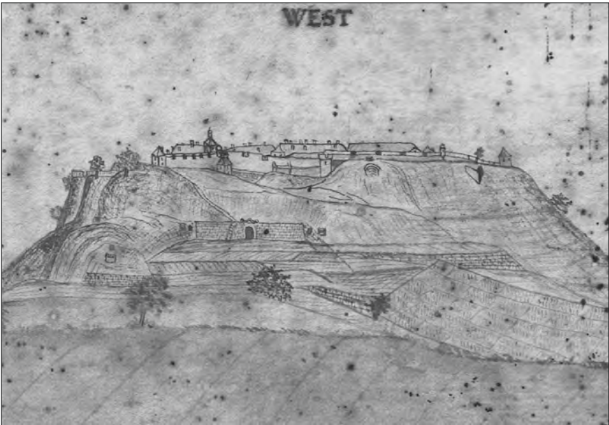
Zwei der vier Miniaturansichten aus dem Nachlass Fuldas.