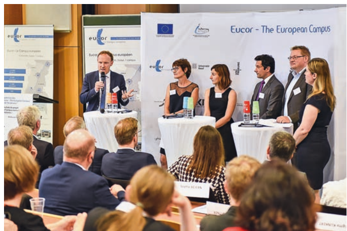
Präsentation der Ergebnisse des Interreg-Projektes »Eucor – The European Campus: grenzüberschreitende Strukturen« am 17.6.2019.

Dieser aufwändige, aber notwendige Prozess wurde auch durch die Förderung seitens der Europäischen Union möglich. Von Januar 2016 bis Juni 2019 wurde das Projekt »Eucor – The European Campus: grenzüberschreitende Strukturen« mit insgesamt zwei Millionen Euro durch das Interreg-VA-Programm Oberrhein, dem Europäischen Fonds für Re-