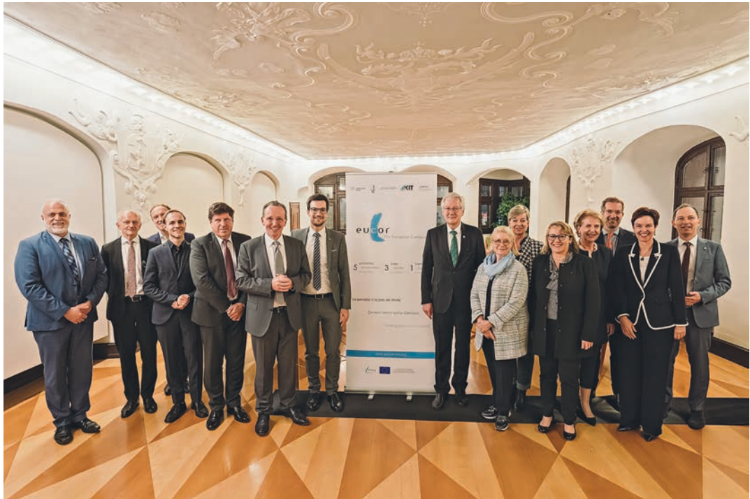
Vertreterinnen und Vertreter der Universitäten, Städte und Regionen von Eucor – The European Campus

teme in Frankreich, Deutschland und der Schweiz sind politisch jeweils unterschiedlich eingebettet, was die Zusammenarbeit von Eucor – The European Campus mit der Politik komplex macht. Umso erfreulicher ist die breite Unterstützung auf vielen Ebenen. Nur beispielhaft sollen hier zwei markante Ereignisse angesprochen werden, die als Sinnbild für den politischen Rückenwind dienen können.