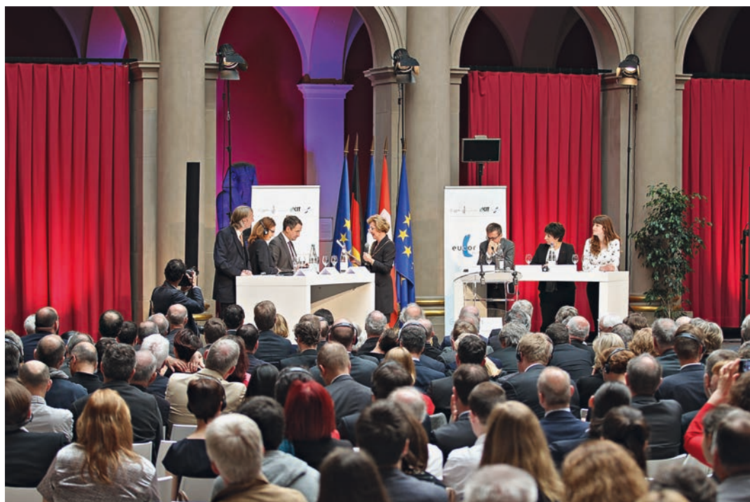
Am 11.5.2016 wird der European Campus im Palais universitaire in Strasbourg feierlich eröffnet.

Freiburg. Das Regierungspräsidium Freiburg ist in Baden-Württemberg die zuständige Aufsichtsbehörde. Am 11. Mai 2016 fand die feierliche Eröffnung im Palais universitaire in Strasbourg statt. In seiner Festrede zur Zukunft Europas betonte Dr. Carlos Moedas, der damalige EU-Kommissar für Forschung, Wissenschaft und Innovation, die wichtige Rolle, die der Wissenschaft und den Universitäten beim Aufbau Europas zukommt.