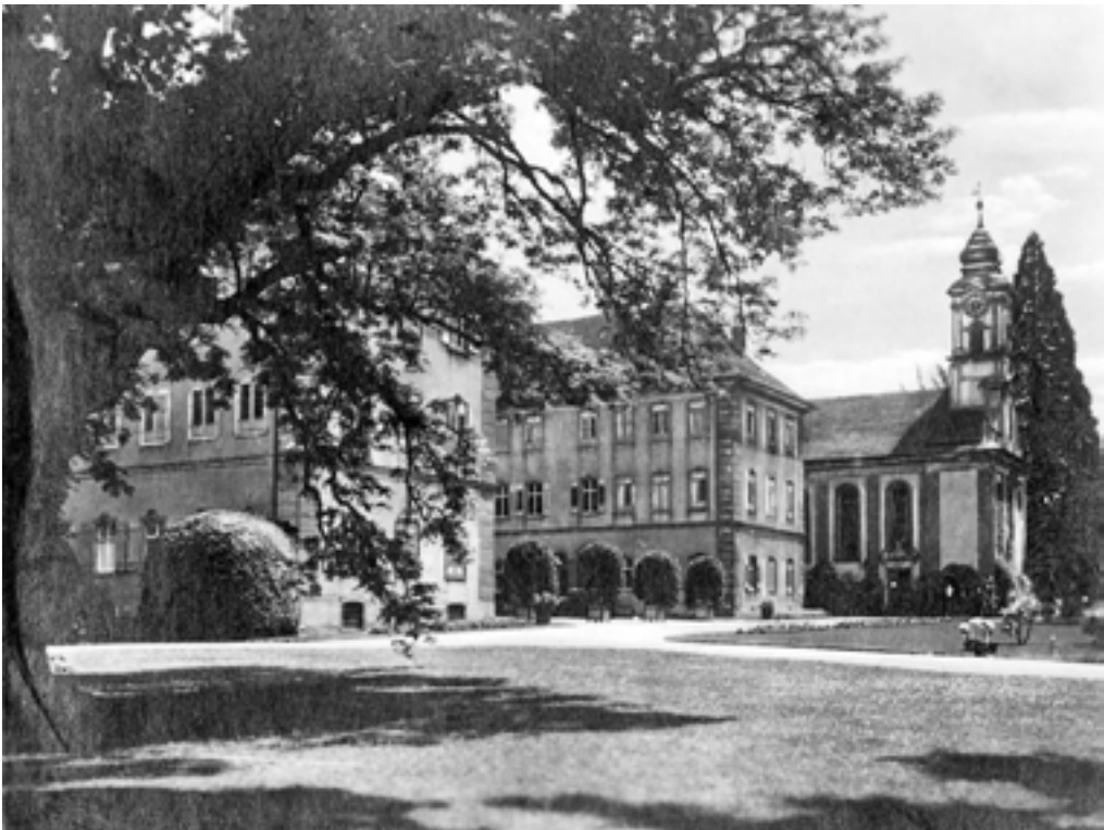
Abb. 1: Schloss Mainau in den frühen 1930er Jahren