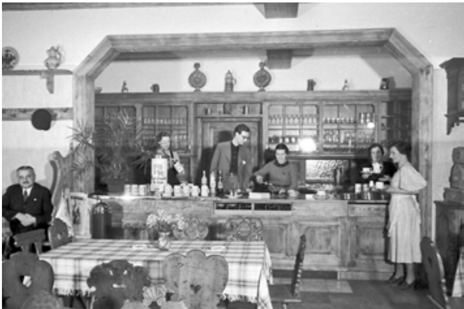
Abb. 6: Blick in das Innere der Schwedenschenke unmittelbar nach der Eröffnung im Frühjahr 1937: In der Bildmitte hinter dem Tresen ist Lennart Bernadotte zu erkennen

Wie nahm Lennart Bernadotte die in der zweiten Hälfte der 1930er Jahre zunehmende Verfolgung der Juden wahr? Über die Pogromnacht vom 9. auf den 10. November 1938 schrieb er in sein Tagebuch – ins Deutsche übersetzt – folgendes: »In Deutschland sind, nach einem Mord an einem deutschen Attaché, begangen von einem jungen Juden, heftige Judenverfolgungen ausgebrochen, die einstimmig von allen Medien dieser Erde verurteilt wurden. Es kamen Plünderungen von Geschäften vor und Brandanschläge auf Synagogen. Man diskutiert die Möglichkeit, ein neues Land für die Juden zu schaffen, da