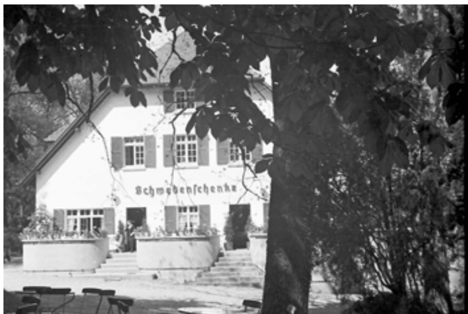
Abb. 5: Die Schwedenschenke auf der Insel Mainau Ende der 1930er Jahre

Ende Mai 1937 hielt sich Lennart Bernadotte in Berlin auf und besuchte die Ausstellung »Gebt mir vier Jahre Zeit!«, die einen Überblick über die »Aufbauarbeit« der Nationalsozialisten geben sollte. Wiederum ins Deutsche übertragen, notierte er in sein Tagebuch: »Die Eingangshalle war das Beste mit den großformatigen Fotografien, die