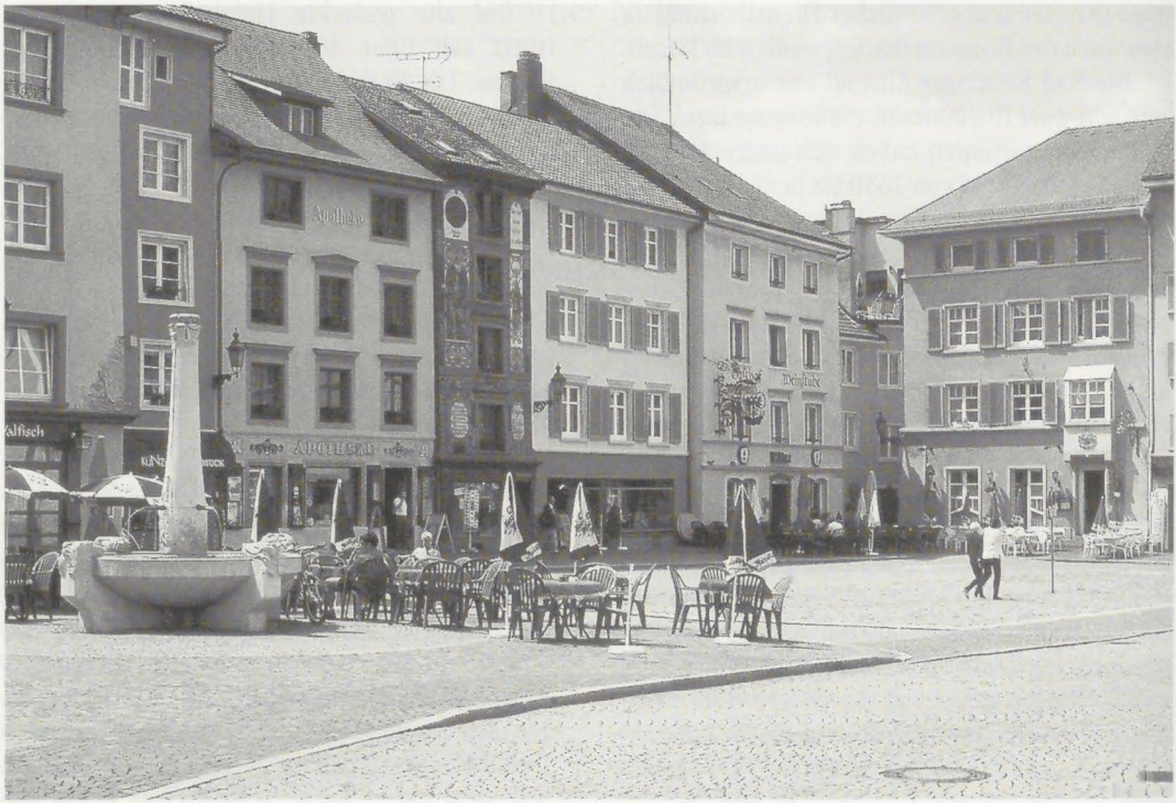
Münsterplatz im Herzen der Altstadt mit seinen historischen Bauten