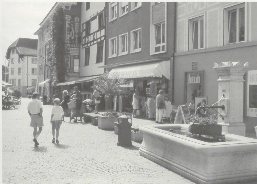
Die seit Inbetriebnahme der neuen Rheinbrücke verkehrsberuhigte Rheinbrückstraße, welche zur Holzbrücke führt, lädt zum Bummeln und Verweilen ein

Der Baubestand innerhalb des Inselbezirks ist als Ensemble 1961 in das Denkmalbuch des Landes Baden-Württemberg eingetragen worden. Er umfaßt ein Gebiet von 10 ha mit 212 Gebäuden. Die Altstadt, früher blutvoller Mittelpunkt pulsierenden Lebens, wurde in der zweiten Hälfte dieses Jahrhunderts mehr und mehr zu einem Problemgebiet. Die Bausubstanz verfiel. Die alteingesessene Bevölkerung zog in die Außenbezirke. Alte Menschen und sozial Schwache blieben zurück. Der Ausländeranteil stieg auf 44% der Altstadtbevölkerung.