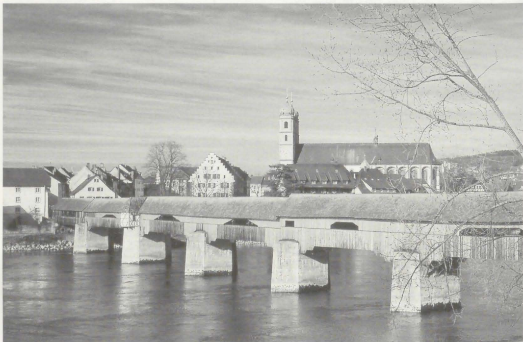
Bad Säckingen – Blick auf die über 400 Jahre alte und längste Holzbrücke Europas mit dem St. Fridolinmünster

Am Beispiel der Stadtsanierung in Bad Säckingen will ich unseren Weg zu dem Ziel aufzeigen, den Altstadtkern wieder zu einem Zen-