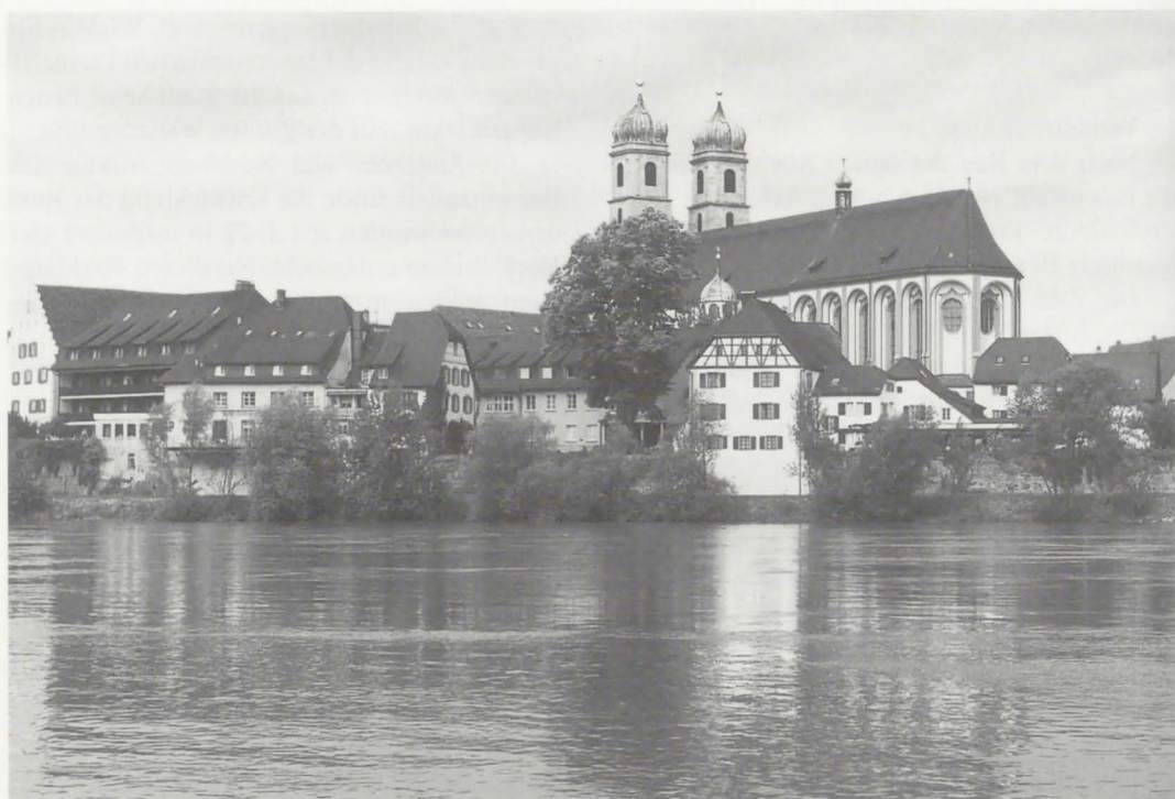
Gesamtansicht der Altstadt nach der Sanierung

Säckingen?“ nannten die meisten die Altstadt, die Brücke, das Münster und die gesamte Innenstadt.