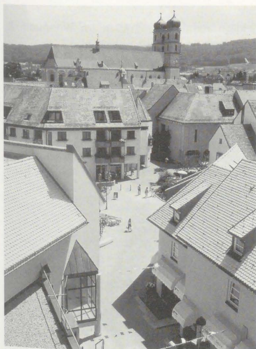
Dachlandschaften der Altstadt, welche auch bei Neubauten in ihrer Vielfältigkeit und Gestaltung den Bauwerken der Vergangenheit angepaßt wurde