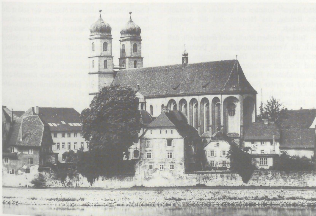
Gesamtansicht der Altsadt vor der Sanierung. Aufnahme um 1970.

Im Rahmen der Marktuntersuchung der BBE Baden-Württemberg GmbH Beratungsgesellschaft Handel und Kommune aus dem Jahr 1996 wurden Kurgäste und Touristen interviewt. Auf die Frage: „Was gefällt Ihnen an Bad