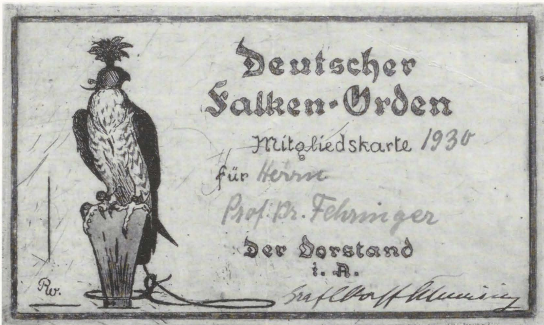
Mitgliedskarte des Deutschen Falken-Ordens (Originalradierung)

Schöne Zeit, aber auf die Dauer langweilig.“ Deshalb Versetzungsgesuch auf eine Feldwetterwarte „möglichst auf dem Balkan, von