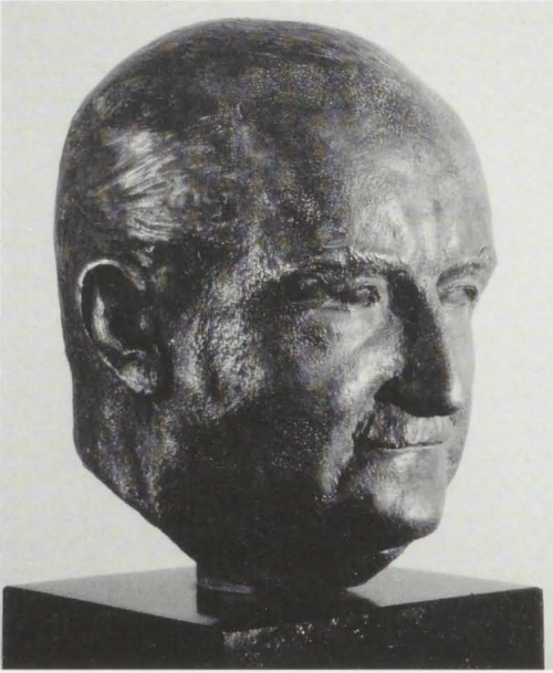
Posthumer Bronzekopf Otto Fehringers aus dem Jahre 2001, geschaffen von Martin Schliessler (Vancouver, Kanada)

Greife “ (Leipzig 1937) mit 24 farbigen Tafeln nach den „kolorierten Kupferstichen aus Johan Wolfs und Bernhard Meyers “ Naturgeschichte der Vögel Deutschlands (1805) neu auf (Insel-Bücherei Nr. 515).