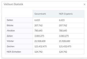
Abb. 7: Kalkulation der benötigten NER-Einheiten auf Basis der mittels OCR erkannten Zeichen.

Image einbezogen werden. Die Badische Landesbibliothek hat durch ihre mehr als zehnjährige Kulturgutdigitalisierung eine so große digitale Sammlung aufgebaut, dass ein solches Projekt nur langfristig realisierbar wäre.