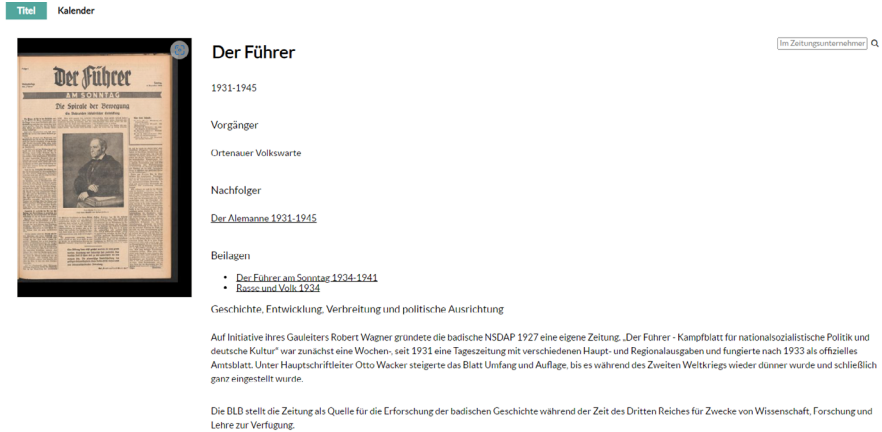
Abb. 1: Das Zeitungsunternehmen „Der Führer“ mit Kontextinformationen.

umfangreichen Bestände leicht zugänglich zu machen. Diese orientieren sich an den spezifischen Anforderungen der digitalisierten Bestände und sollen einen präzisen Zugang zu den Digitalen Sammlungen ermöglichen. In diese Kategorie fällt beispielsweise das Geographica-Tool, das die Literatur zum Oberrhein georeferenziert darstellt 9 und eine gezielte Recherche in der Rheinliteratur ermöglicht. Ein anderes Beispiel findet sich bei den Landtagsprotokollen. Für diesen prominenten Bestand der digitalisierten Regionalia steht zur zielgerichteten Suche eine Personen- und Redensuche zur Verfügung, um den umfangreichen Bestand besser zugänglich zu machen. 10