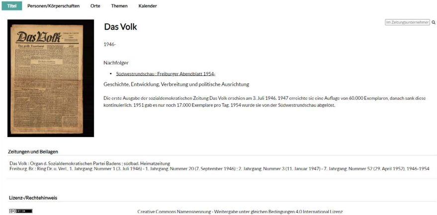
Abb. 3: Zusätzliche Rechercheeinstiege nach NER im Zeitungsunternehmen.

Fehler pro Seite. Dabei konnten einige neuralgische Punkte ermittelt werden. Bindestriche sind ebenso ein Problem wie Abkürzungen und Umlaute. Beispielsweise erkannte NER bei dem Wort „über“ eine Verknüpfung zum kalifornischen Start-up „Uber“. In der Abkürzung Freiburg i. Br., die in badischen Zeitungsbeständen natürlich häufig vorkommt, ermittelte die Software den Bayerischen Rundfunk (BR).