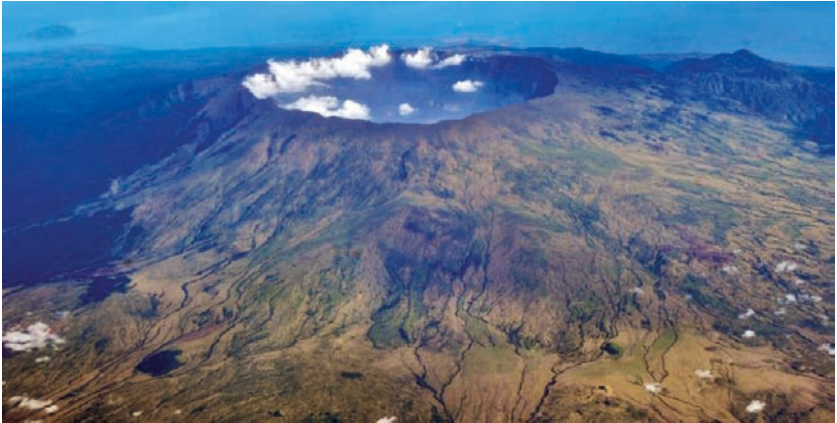
Abb. 1: Vulkan Tambora. Durchmesser auf Seehöhe: 60 Kilometer; Höhe: 2.850 m, vor der Eruption etwa 4.300 m (Daten aus Wikipedia, Stichwort »Tambora«).

bruch, der jemals von Menschen dokumentiert wurde. (...) Die Energie, die bei den Eruptionen freigesetzt wurde entsprach dem 170.000-fachen der Hiroshima-Atombombe.« 16