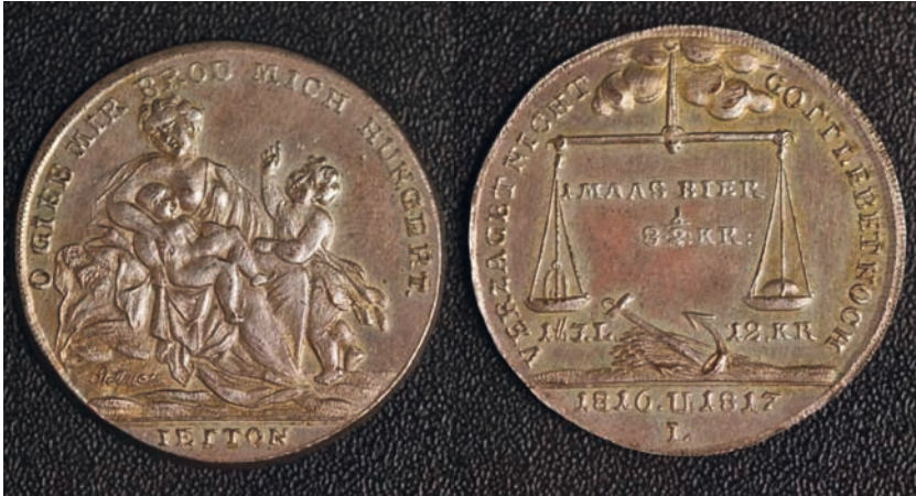
Abb. 6: Gedenkmünze zur Hungersnot von 1817 (Vorder- und Rückseite).

ihr Angabe desselben. Zwischen beiden liegt ein Anker auf einer Waizengarbe, als Bild der Hoffnung, die stets in widrigen Schicksalen den Unglücklichen beruhigt und seine Leiden mindert, und die nun, hinsichtlich der gesegneten Erndte des letzten, und der jetzt frohen Aussicht jener, dieses kommenden Sommers etc. so schön in Erfüllung geht. – Die Umschrift lautet: Verzaget nicht, Gott lebet noch! 42