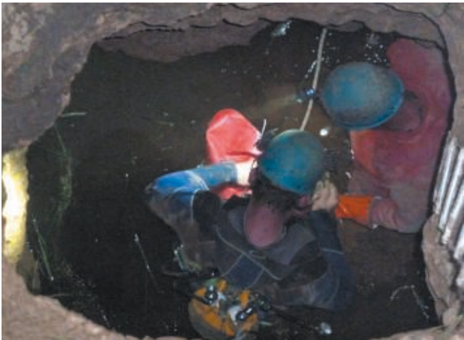
Zweite Untersuchung am 22.06.2019 nach Abstieg an der Drahtseileiter.