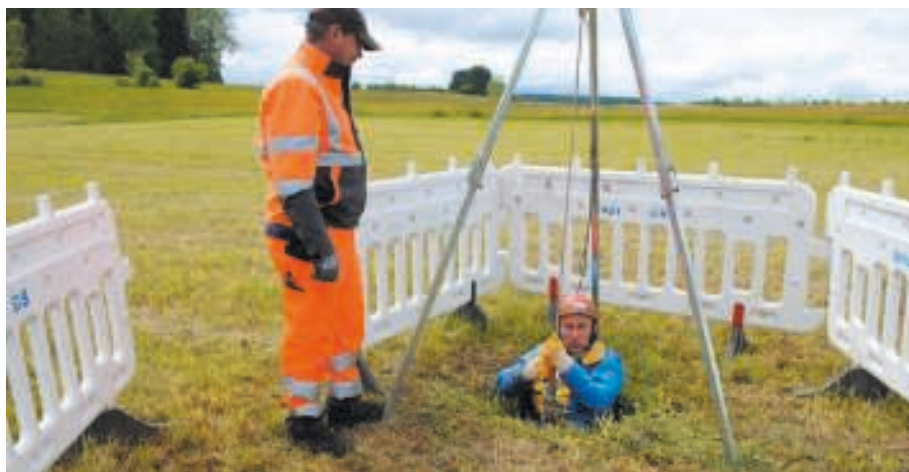
Einstieg in die Tannenäckerhöhle am 28.05.2019 am Einfachseil.

Der Hohlraum ist an einer NW-SO-verlaufenden Kluft angelegt. In beide Klufrichtungen waren unter Wasser Fortsetzungen ertastbar – durch heruntergefallene Erde war das Wasser aber so getrübt, dass man nichts sehen konnte. Ein Fließen des Wassers war nicht erkennbar. Die Dimension eventuell unter Wasser weiterführender Gänge konnte nicht ermittelt werden.