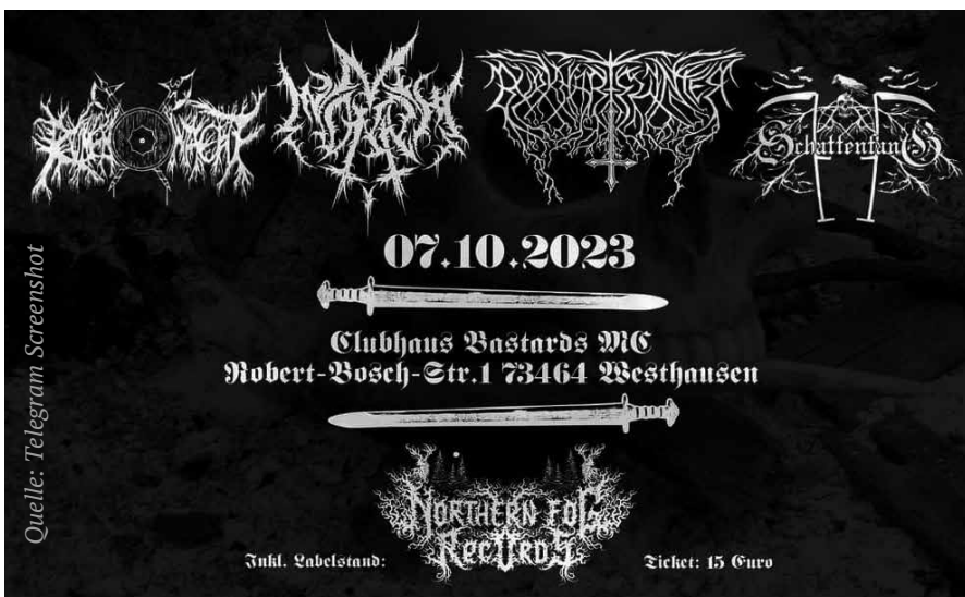
Am 7. Oktober fand in Westhausen (Ostalbkreis/Baden-Württemberg) ein Konzert mit Burkhartsvinter und Runenwacht statt.

Zurück nach Deutschland: Mit Eishammer sollte in Sotterhausen eine Band aus Baden-Württemberg auftreten. Eishammer, 2018 gegründet, stammt aus dem Raum Hohenlohe. Der erste Tonträger „Söhne Teuts“ ist im Jahr 2019 erschienen. Textlich vollzieht die Band eine Gratwanderung zwischen germanischer Mythologie und extremer Rechter: „Söhne Teuts, Wotans Krieger / Aus Sagen und Heldenliedern / Söhne Teuts aus Germania / Von Flandern bis nach Bavaria / [...] / Aus Eisen schuf er die Ahnen / Stolz tragen wir seinen Namen / Empor aus des Vaters Glut / Erhob sich germanische Wut“. Zwar sind die Songtexte recht vage. Aber Mitglieder sind in der Neonazi-Szene aktiv. Zunächst in einem Ableger der Jungen Revolution, einer neonazistischen Kameradschaft. Inzwischen im baden-württembergischen „Stützpunkt“ der Jungen Nationalisten, der neonazistischen Jugendorganisation von Die Heimat (ehemals NPD). Neben Eishammer haben Runenwacht (Raum Esslingen, 2011 gegründet), Burkhartsvinter (Raum Singen, 2013 gegründet) und Flak (Raum Karlsruhe, 2014 gegründet) Bezüge zur extremen Rechten.