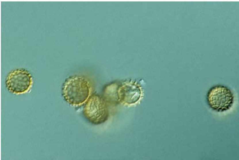
Abbildung 3. Tilletia caries (Weizensteinbrand), Brandsporen.