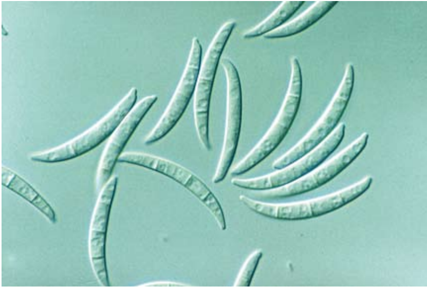
Abbildung 2. Fusarium sporotrichioides , Makrokonidien.