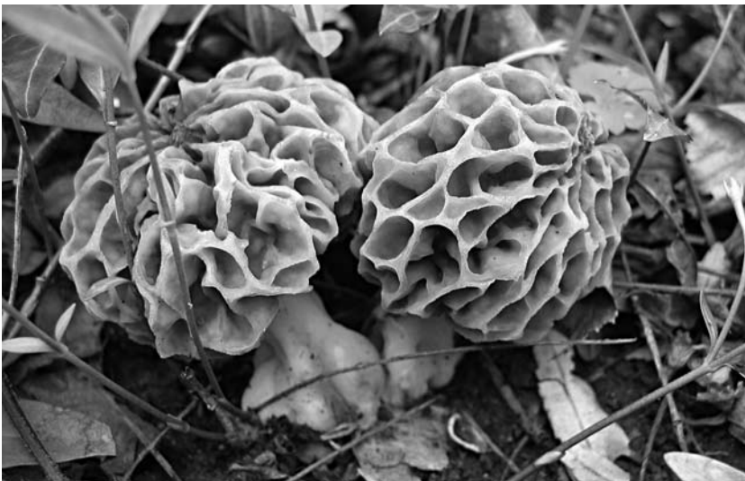
Abbildung 2. Die Speisemorchel ( Morchella esculenta ) gilt als vorzüglicher Speisepilz. Dennoch kommt es immer wieder zu Unverträglichkeiten. Die Ursache dieser wechselnden Verträglichkeit ist noch unklar.

Ein ungewöhnlicher Fall betrifft sodann einen älteren Herrn, der abends eine Mahlzeit aus Speisemorcheln ( Morchella esculenta ; Abb. 2) zu sich