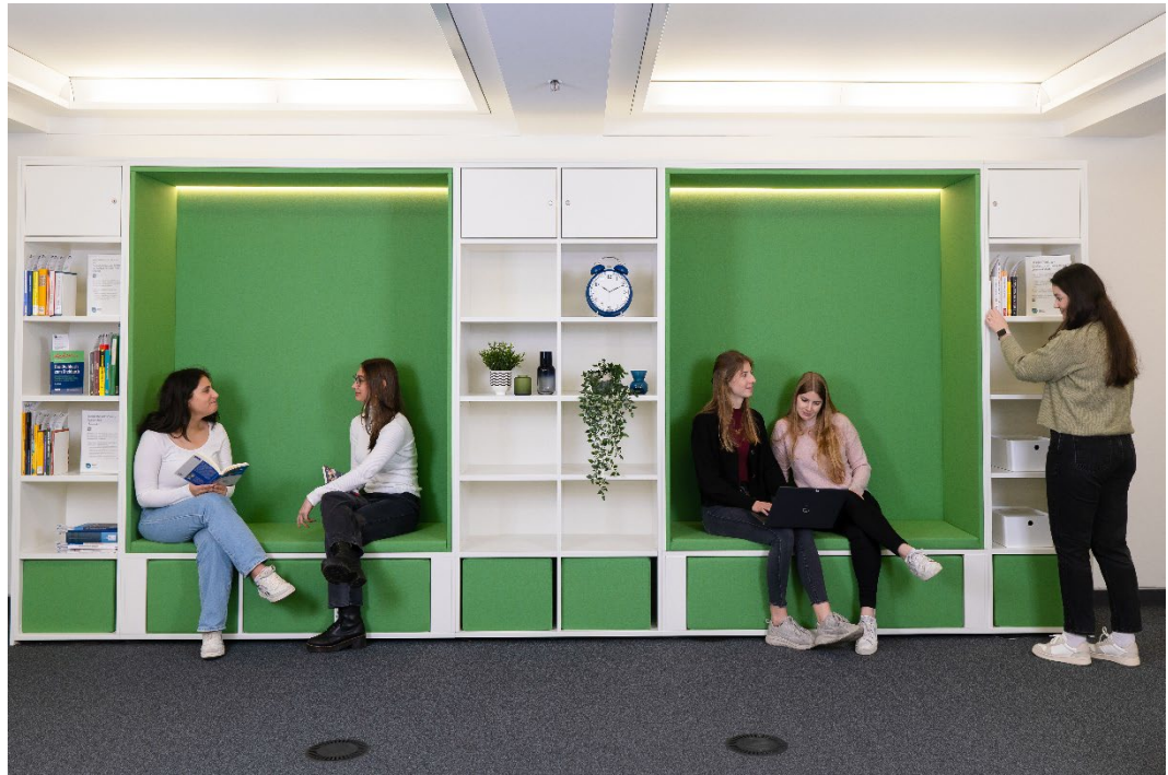
Die Wohnwand mit Sitzkojen, herausnehmbaren Hockern und Regalflächen. In den Regalflächen wird neben Dekoration Literatur und frei nutzbares Material zu Design Thinking sowie wechselnde Bestände zu aktuellen Veranstaltungen angeboten.

Nach einem halben Jahr Lernwerkstatt „in live“ kann ein positives Fazit gezogen werden. Sie ist regelmäßig sehr gut besucht und die Services und Veranstaltungen werden mit großem Interesse angenommen. Im kommenden Jahr ist nun geplant, das Netzwerk weiter auszubauen und die medienorientierten Veranstaltungen der Teaching Library auch für Schulen, Studierendengruppen und andere interessierte Gruppen als Workshops buchbar zu machen.