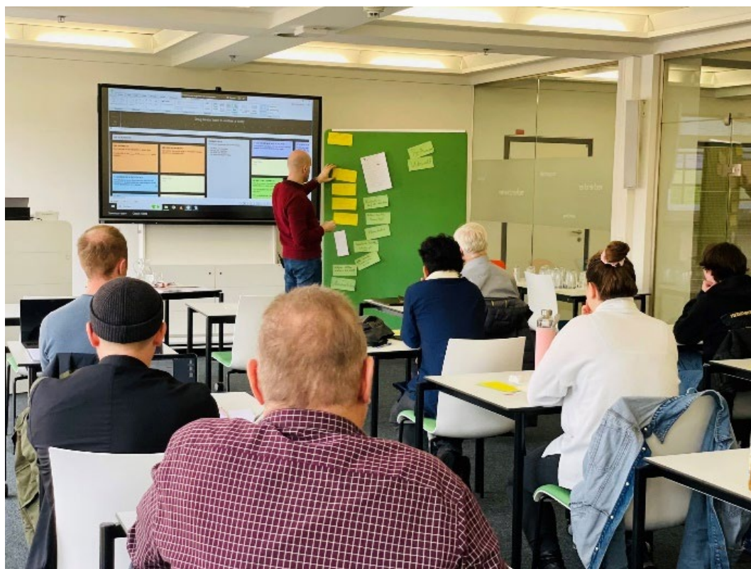
Workshop zum Thema Drehbuchschreiben im Seminarraum in Kooperation mit dem Filmboard e.V.

Räumlich besteht die Lernwerkstatt aus einem Seminarraum, einer freien Lernfläche und einem Media Studio, das sich im hinteren Bereich des angrenzenden Lesesaals befindet.