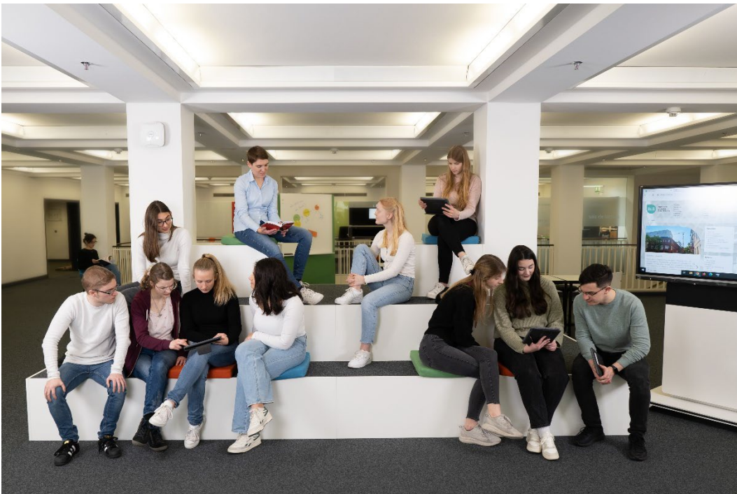
Die Tribüne

Die Lernwerkstatt ist die räumliche Heimat der Teaching Library, die seit 2010 Schulungen und Workshops im Bereich wissenschaftliches Arbeiten und Informationskompetenz anbietet.