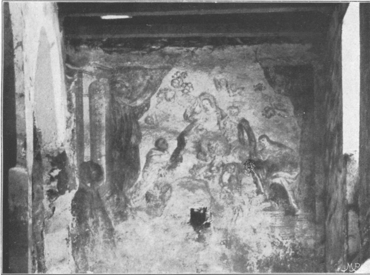
Abbildung 23. Altarbild der Skapulierbruderschaft.

Rückwand ein einfaches Freskogemälde zierte, das beim Umbau im Jahre 1889 unter der Tünche zu Tage getreten und hier abgebildet ist. Es zeigt Maria mit dem Kinde, wie diese an den hl. Simon Stock und die hl. Theresia Skapuliere austheilen. An seine Stelle scheint später ein holzgeschnitzter Altaraufbau getreten zu sein. Wenigstens führt ein Inventar der Säkularisationszeit Holzstatuen der genannten Heiligen auf. Als ihre Hauptfeste beging die Bruderschaft das Skapulierfest (16. Juli bzw. Sonntag danach), den Tag