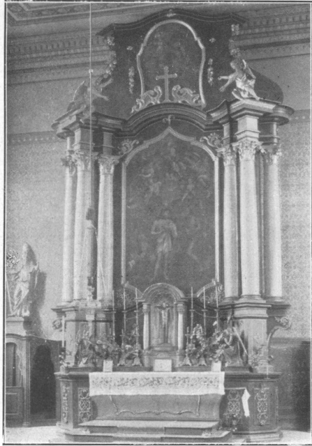
Abb. 29. Hochaltar aus St. Johann, heute in Murg bei Säckingen.

um baldige Vornahme „der Exekration“ gerichtet, „da die ehemalige Stiftskirche zu St. Johann zu gottesdienstlichen Berrichtungen aufgehoben und zu anderem Zwecke bestimmt ist“. Freilich kennt das Kirchenrecht nur eine faktisch eintretende Exekration von Kirchen durch Zerstörung, Verbrechen, Blutvergießen in derselben. Allein in Konstanz war man damals willfähriger. Schon am 14. August 1816 konnte Wessenberg der Regierung zurückschreiben, daß in seinem Auftrag der Dompfarrer Strasser am 13. August die gewünschte Exekration vorgenommen habe. Es dürfte sich in der Hauptsache um die Entfernung der Reliquien aus den Altarsteinen gehandelt