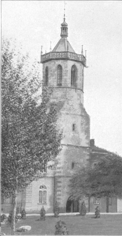
Turm der früheren St. Peters- und Paulskirche zu Bühl.

Schaustellung architektonischer Raffiniertheit, diene zur Eignung für das Kultbedürfnis.“ An der Außenwand der Kirche befand sich eine Sonnenuhr und dabei das Badische und das Windeckische Wappen in Stein gehauen 1 .