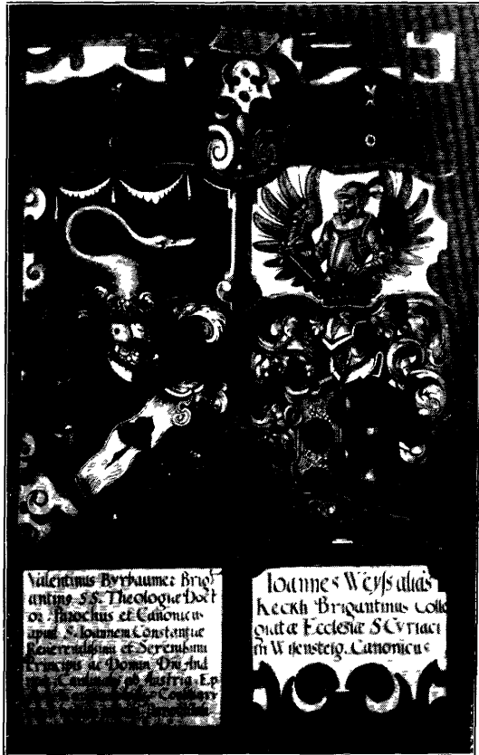
Abbildung 22. Wappenstein aus dem Pfarrhof von St. Johann.

Ein kurzer Einblick in diese Stolgebühren scheint nicht unerwünscht. Sie betragen nach Aufzeichnungen von 1689 und 1783: 2 fl. von einer Hochzeit, 30 Kr. von einem Tauf-, Ehe- oder Totenschein, 32 Kr. vom Begräbnis eines Erwachsenen (sogenanntes Pfarrecht, Seelgerät oder Seelengericht), 30 Kr. vom Begräbnis eines Kindes, 30 Kr. für die „Abdankungen“