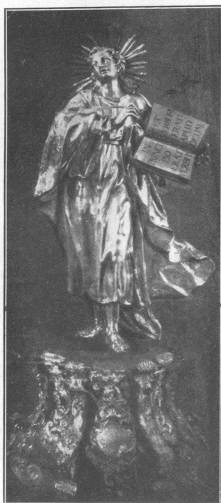
Abb. 26. Statue des hl. Johannes d. E., Abb. 27. Statue des hl. Johannes Ev., gestiftet von Chorherr Frener.

prima vice suo capite orbatur. Tristem casum et funus luctu dignum! Sed quis divinae resistet providentiae? Hanc adoremus potius quam ut inordinato luctu eidem obloqui videamur. Faciamus nos, que nostra sunt, et in id incumbamus, ut de alio idoneo capite, quod ecclesia vestrae decorem et incrementum non solum conservet sed etiam augeat, seposito omni perverso affectu, serio cogitemus. Acclamo hic vobis verbis divi Ioannis apostoli, qui alias vester patronus, pater et magister est. Ex huius ore, quid in his circumstantiis agatis, vobis indico: Videte vosmetipsos, ne