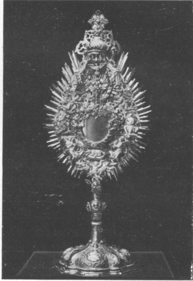
Abb. 28. Monstranz von St. Johann, heute in Kielasingen.

Außer den Altären fand sich noch manches Schnitzwerk: Statuetten der hll. Verena, Sebastian, Johann Bapt., Pelagius, Judas