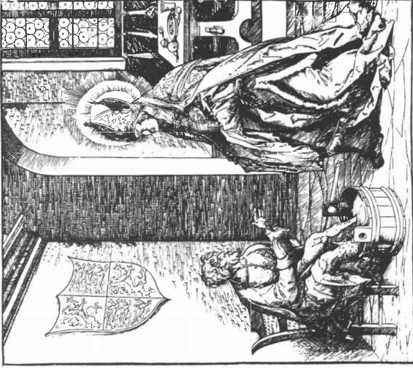
Hl. Thomas Becket wäscht einem Kranken die Füße. Holzschnitt von Hans Burgkmair (1478-1531)