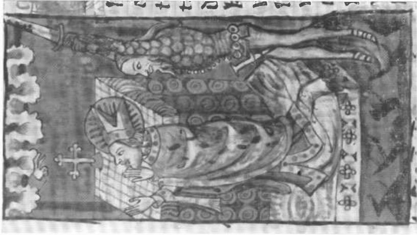
Martyrium des hl. Thomas Becket Legenda aurea Straßburg 1362