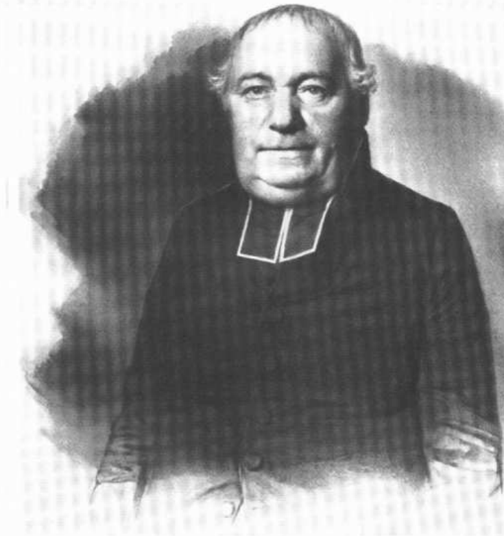
Der spätere Erzbischof Ignaz Demeter als Freiburger Domdekan