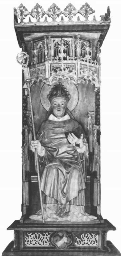
Hl. Thomas Becket. Holzplastik aus der Pfarrkirche von Skepptuna, wohl von Bernt Notke, um 1480. Staatliches Museum Stockholm.