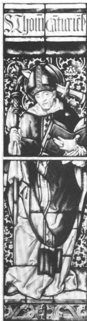
Hl. Thomas Becket, Fenster des Münsters in Freiburg i. Br.