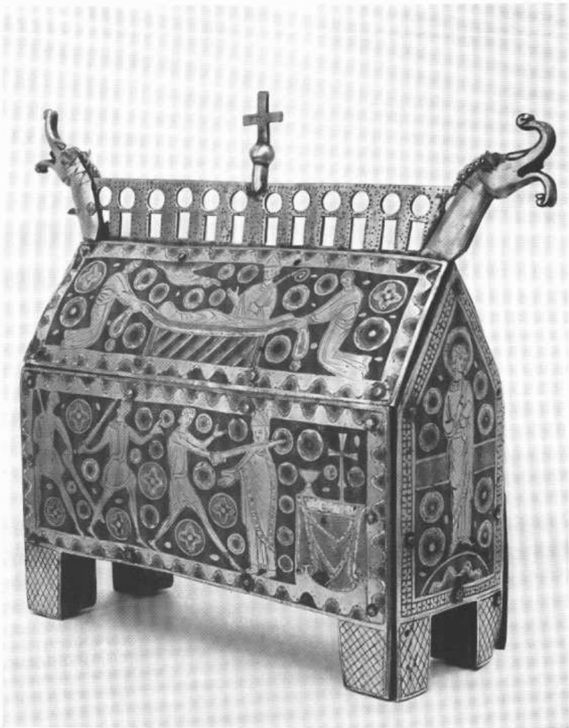
Reliquierschrein der Pfarrkirche Trönö, Erzdiözese Uppsala, mit Martyrium des hl. Thomas Becket. Limusiner Arbeit Ende 12. Jahrhundert