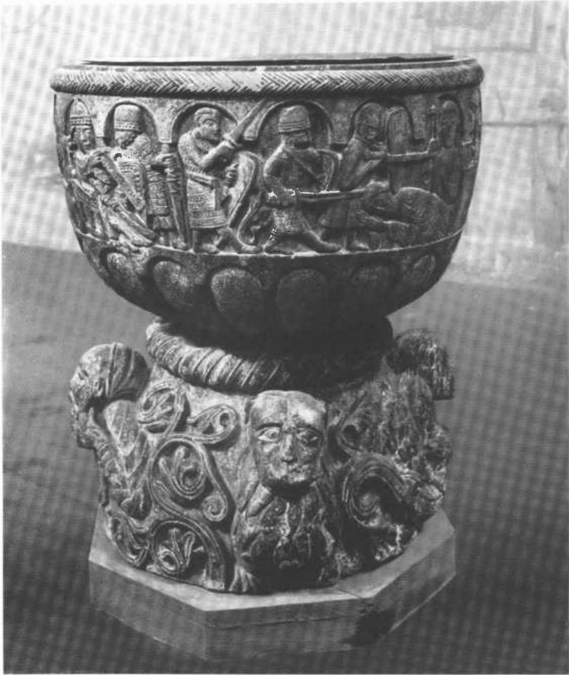
Taufstein von Lyngsjö um 1190 mit Martyrium des hl. Thomas Becket. Historisches Museum der Universität Lund (Südschweden)