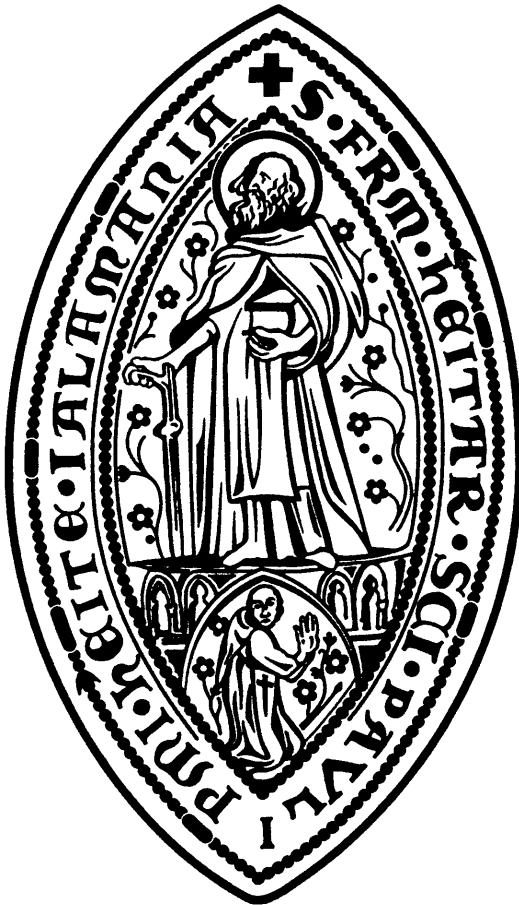
Abb. 2: Siegel der deutschen Ordensprovinz der Pauliner, nachweisbar von 1354 bis 1610. Nachzeichnung des im Montfort-Museum in Tettngang erhaltenen Siegelstempels.

Über die Entstehung der deutsch-rheinischen Provinz des Ordens, die später meistens die schwäbische Provinz genannt wurde, berichten zwei konkurrierende Überlieferungen. Danach haben Vertreter einer „ confraternitas “ von Eremiten und Eremitorien im deutschen Südwesten beim Generalkapitel in Buda 1340 um Aufnahme in den Orden gebeten, die