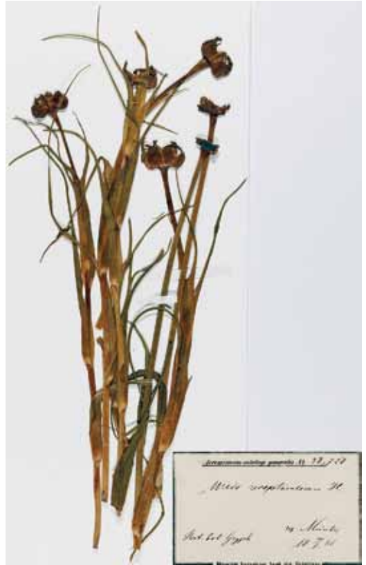
Abbildung 12. Microbotryum tragopogonis-pratensis in den Blütenständen des Wiesen-Bocksbart ( Tragopogon pratensis ) (KR-M-0057624): Dieser seltene Brandpilz ist heute in Vorpommern ausgestorben.

Zahlreiche Wirtspflanzen sind Exoten, so der aus Australien und Neuseeland stammende Känguru-Strauch ( Solanum laciniatum ) und der aus Jamaika stammende Buchsbaum Buxus arborea . Dies beweist, dass JULIUS MÜNTER Pflanzensamen aus der ganzen Welt erwarb. In dieser Liste werden 37 Pflanzenarten als Wirte von parasitischen Kleinpilzen aufgeführt. Die Liste ist eine bunte Mischung aus Zier-, Medizinal- und Nutzpflanzen sowie gängigen heimischen Wildpflanzen. Da es zeitlich keine durchgehend aufgearbeiteten Pflanzenlisten aus dem Botanischen Garten gibt, ist dies zumindest ein kleines Zeugnis für den ehemaligen Bestand des alten Botanischen Gartens Greifswald zwischen 1849 und 1877, der sich noch gut mit dem von WILCKE ca. 100 Jahren zuvor beschriebenen Bestand aus der Anfangszeit des Gartens von 1765 deckt. Bereits 19 der hier vorgestellten Wirtspflanzen-Taxa werden von WILCKE aus der Anfangszeit des Gartens genannt (Tabelle 1, siehe Anhang). Die Pilzbelege, insgesamt 27 Arten, sind von großer Bedeutung. Sie ergänzen die Liste der