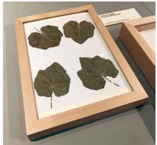
Abbildung 2. Ältester Mecklenburg-Vorpommerscher Beleg des aus Chile stammenden Malven-Rostpilzes Puccinia malvacearum bei der Ausstellung „Neobiota“ im Naturkundemuseum Karlsruhe 2022.

Ustilago avenae (PERS.) ROSTR.: 23.6.1857, J. MÜNTER (KR-M-0057664)