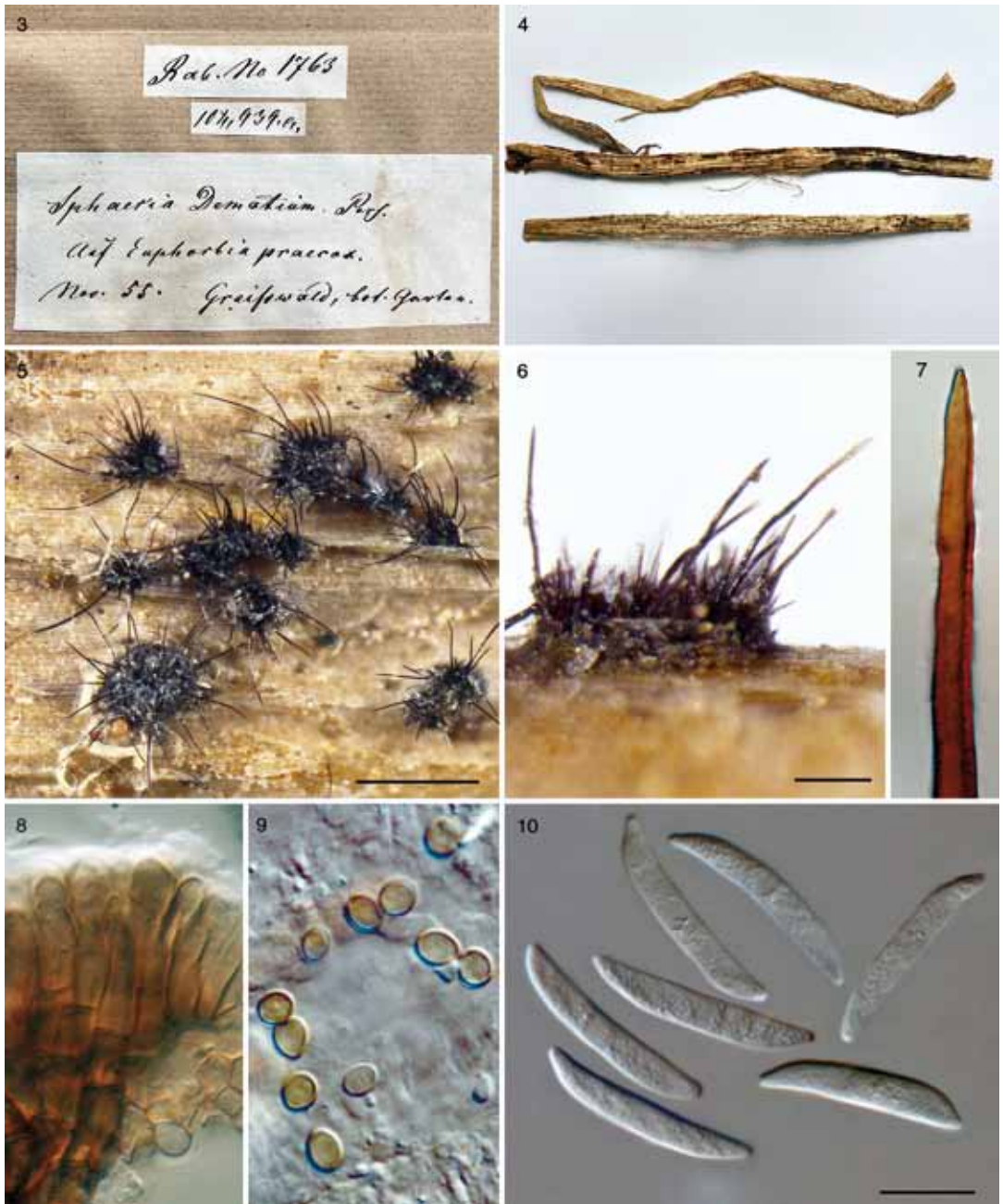
Abbildungen 3-10. Colletotrichum sp. auf Stängeln von Euphorbia sp. (KR-M-0037124); 3. Originaletikett mit der Nummer 1763, unter der dieser Pilz in RABENHORST'S KRYPTOGAMEN-FLORA (WINTER 1886) gelistet ist und der Originalbelegnummer 102,939,a.; 4. Gesamtansicht des Belegs; 5. Acervuli mit Seten in Draufsicht, (Maßstab = 500 \mu m); 6. Acervulus mit Seten in Seitenansicht, (Maßstab = 100 \mu m); 7. Apex einer Seta; 8. Konidienträger und konidiogene Zellen; 9. Appressorienartige Strukturen; 10. Konidien, (Maßstab = 10 \mu m). (Abbildungen 5-8. DM; 9-12. DIC).