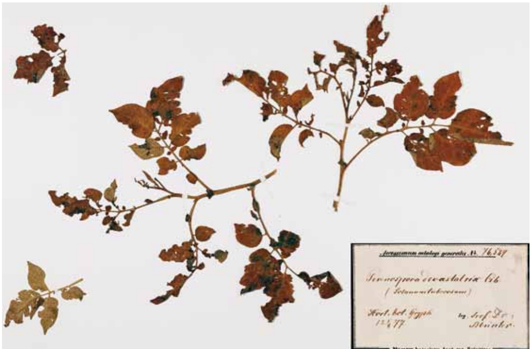
Abbildung 11. Phytophthora infestans , der Erreger der Kraut- und Knollenfäule der Kartoffel, auf Blättern einer Kartoffelpflanze (KR-M-0012902). Der Beleg vom 5.8.1877 ist vermutlich der älteste Beleg von P. infestans aus dem Bundesland Mecklenburg-Vorpommern.

Tragopogon pratensis L. (Wiesen-Bocksbart) Microbotryum tragopogonis-pratensis (PERS.) R. BAUER & OBERW. [ Uredo receptaculorum