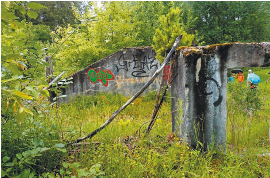
Die Verlade- und Sortierrampe, heutiger Zustand.

Für die Weißtongrube am Haselberg in Brigachtal-Überauchen treffen all die Merkmale eines „Lost Place“ zu. Wer immer heute an den Mauerresten, an