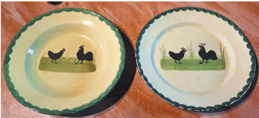
Zwei Teller von 1933 mit dem Motiv Hahn und Henne aus dem Bestand des Bürgermeisters Edward Doser.

In den ersten Nachkriegsjahren wurde die Lage noch aus einem anderen Grund problematisch. Einerseits mussten die Fabriken Geschirr als Reparations-