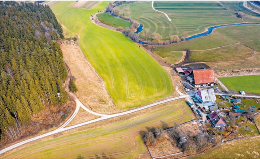
Der Weiler Beckhofen, links am Rand des Weißwaldes die Grube. Hier wurde von 1838 bis 1916 Weißton für die Majolikafabrik in Schramberg abgebaut.

denen der Zahn der Zeit unerbittlich nagt und die fast völlig eingewachsen am Wegrand stehen, vorübergeht, kommt von alleine nicht darauf, dass hier einmal die Rohstoffe für eine Reihe von damals namhaften Steingutfabriken abgebaut wurden. Die allerwenigsten dürften beim Anblick der so nicht richtig zur übrigen Waldfläche passenden Ebene mit ihrer schroffen Abbruchkante an einen Ort denken, der für etwa 140 Jahre mehreren Generationen von Überaucherer Familien ein Ort für ihren Broterwerb war und dass aus dem notwendigen Fuhrgeschäft im Laufe der Zeit ein ordentliches Fuhrunternehmen entstand, das heute international tätig ist.