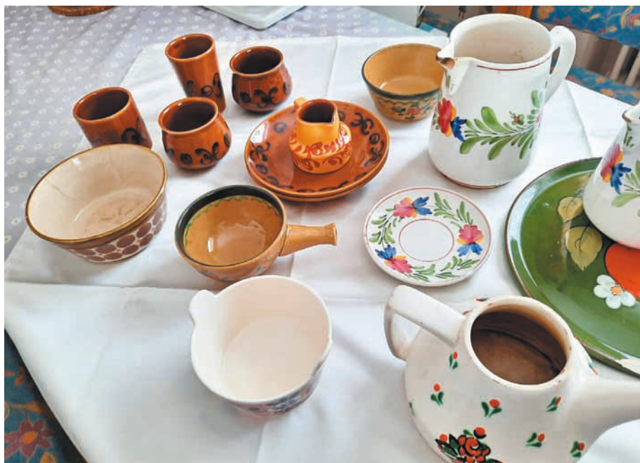
Gebrauchsgeschirre aus der Fabrikation der Majolikafabrik Schramberg. Sie fanden sich zur Zeit des aktiven Tonerden-Abbaus in vielen Überaucher Haushalten.

gutproduzent aus Kaiserslautern. Ab 1909 bezog eine Firma Jakobi in Neuleiningen in der Pfalz sowie die Firma Kick in Amberg (Bayern) für einige Jahre Tonerde von der Gemeinde. Die größte Liefermenge, die zu dieser Zeit eine Firma im Jahr bezog, waren 5.352 Zentner. Den weitesten Weg machten die Lieferungen von dolomitischem Mergel an die Firma Mehner in Eulau im Sudetenland. 8