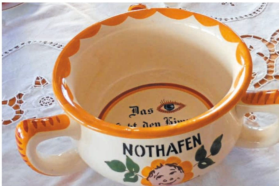
Ein mit drei Haltegriffen und launigen Sprüchen dekoriertes Nachttopf (Potschamber), der in der Steingutfabrik Georg Schmider in Zell am Harmersbach in geringer Stückzahl gefertigt und an die Arbeitskräfte der Tongrube in Überauchen verschenkt wurde.

Da die Fabriken unterschiedliche Ansprüche an Beschaffenheit und Qualität hatten, musste das gewonnene Material sortiert und in sogenannten Bunkern getrennt zur Verladung bereitgestellt werden. Das Sortieren der Steine wurde von Hand vorgenommen. Die Erde wurde mit Sieben entsprechend selektiert.