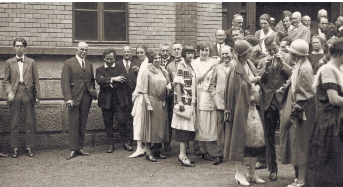
Publikum vor der städtischen Festhalle 1925.

Freiburg, Karlsruhe und Stuttgart waren schon selten, weiter entfernte Städte wie Hamburg, Elberfeld und Bischofswerda die große Ausnahme. “ Aus Donaueschingen kamen „ die leitenden Angestellten des Hauses Fürstenberg, die gehobene badische Beamtenschaft, Gymnasiallehrer, Bankdirektoren, Ärzte und Richter, Akademiker und Bildungsbürger also, daneben aber auch zahlreiche Händler und Wirte, Handwerker und Gewerbetreibende “, 10 zudem aus der Region die Fabrikanten Mez aus Freiburg, Junghans aus Schramberg, Haller aus Schwenningen und Kienzle aus Villingen.