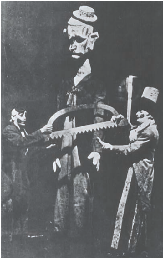
Bert Brecht/Paul Hindemith: Clownszene in der Baden-Badener Uraufführung des Lehrstücks 1929.