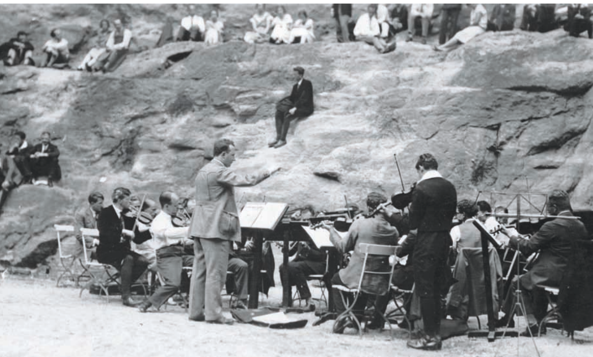
Paul Hindemith am ersten Pult eines kleinen Orchesters, vermutlich bei der Veranstaltung „Musik für Liebhaber“ am 26. Juli 1929 im Steinbruch in Baden-Baden-Lichtental.

Obwohl Hindemith sich so den Vorstellungen Jödes annäherte, kam es 1929 zum Bruch, weil Hindemith eine Mitsprache Jödes beim Programm ablehnte. Wie geplant, präsentierte die Deutsche Kammermusik Uraufführungen für Laienorchester unter dem Titel „Musik für Liebhaber“, doch die in Lichtental tagenden Musikanten blieben fern. Die Konservativen unter ihnen sahen ihre eigentliche Aufgabe in einer neu zu schaffenden Volksmusik. Sie hatten sich beklagt, dass in Baden-Baden „junge Menschen den verwirrenden Eindrücken dieses Musikfestes ausgesetzt“ und dort nur „überfeinerte, rasch welkende Blüten am Baume der Musik“ 24 zu hören seien. Hindemith und Burkard ließen aber auch noch 1930