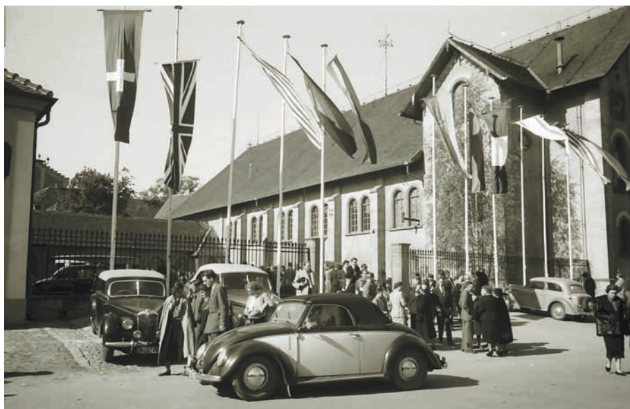
Die fürstliche Reithalle, in der das Orchesterkonzert der Musiktage 1950 stattfand.