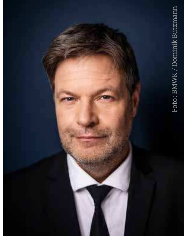
Dr. Robert Habeck Bundesminister für Wirtschaft und Klimaschutz

Ein jüdischer Freund berichtete mir von seiner Angst, seiner schieren Verzweiflung, seinem Gefühl von Einsamkeit. Die jüdischen Gemeinden warnen ihre Mitglieder, bestimmte Plätze zu meiden – zu ihrer eigenen Sicherheit.