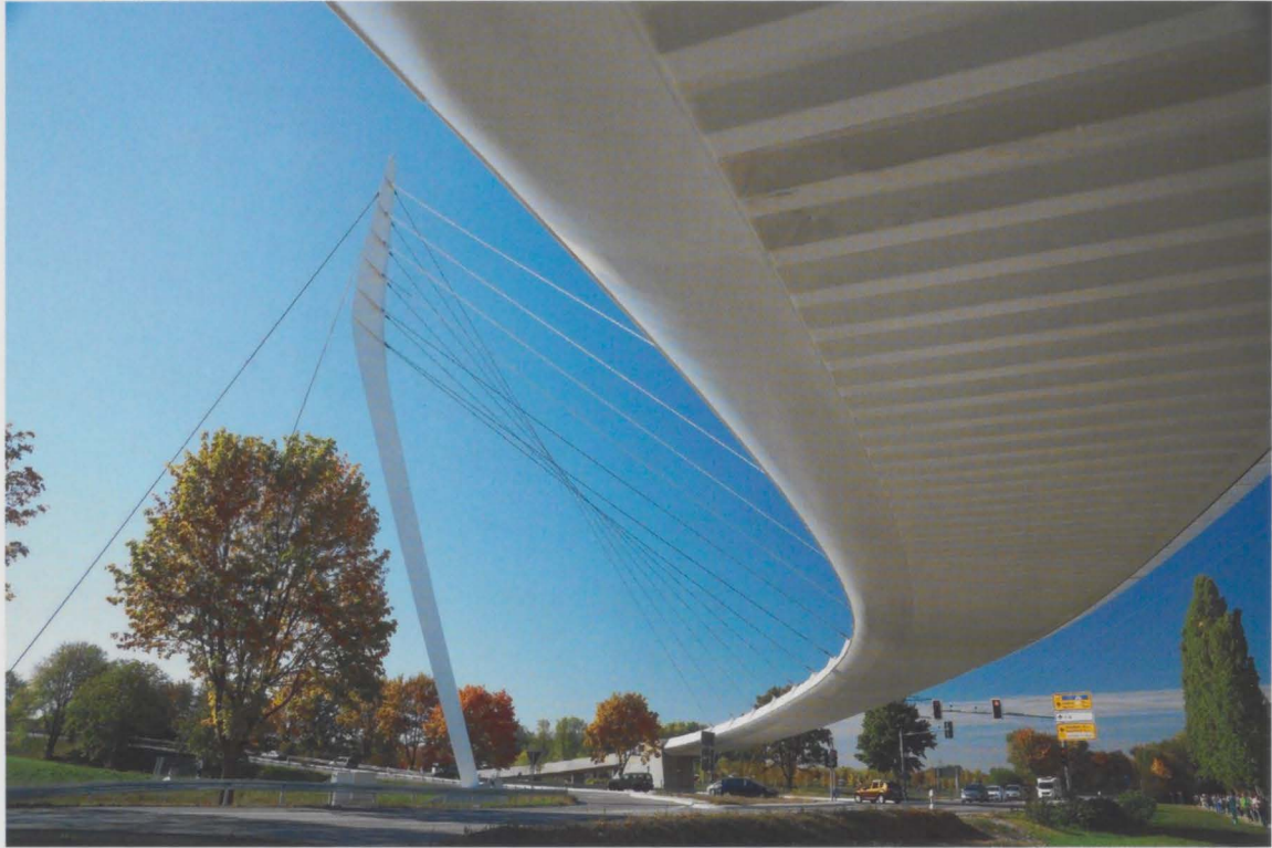
Die Ortenau- Brücke überspannt mit Schwung und Eleganz die Bundes- straße.