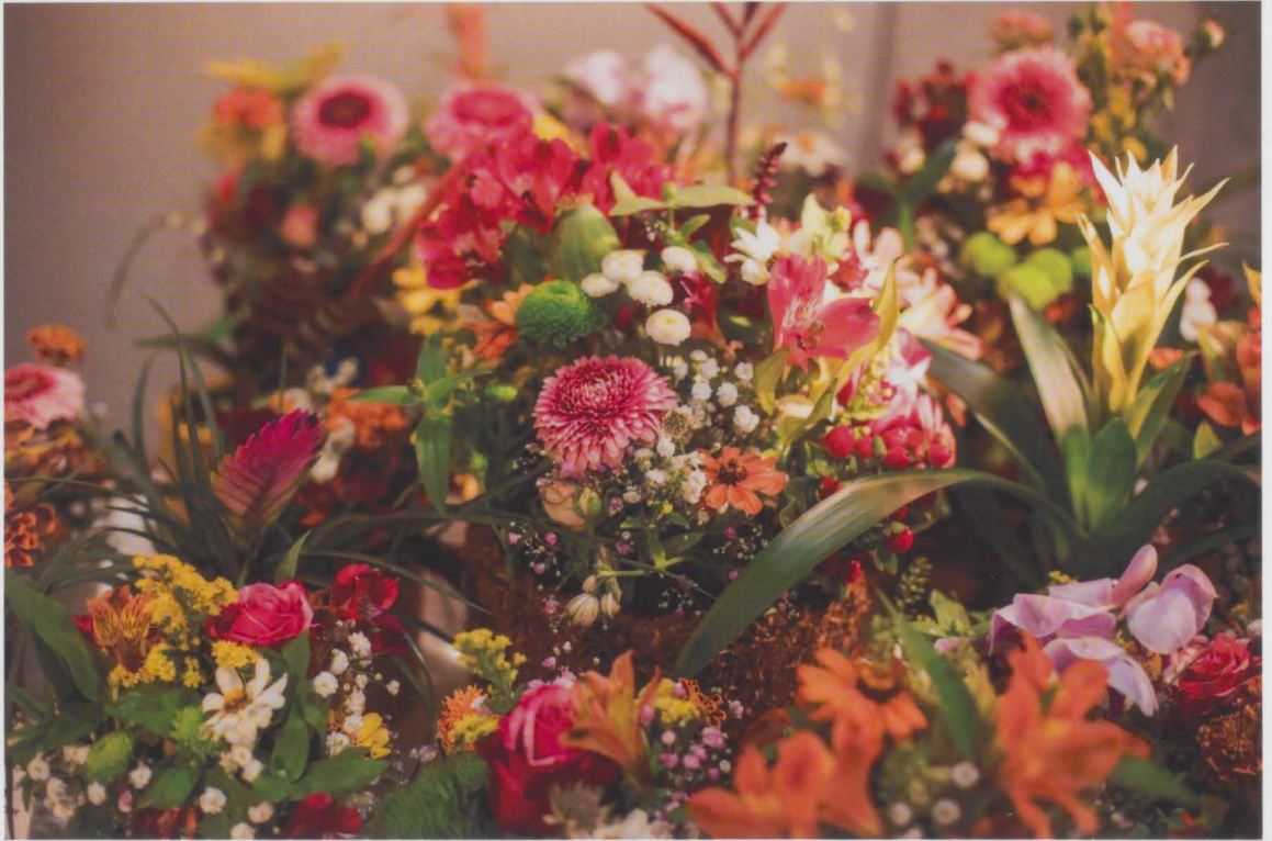
Der Blumen-Mix in der Blumenhalle war eine der großen Attraktion auf der LGS.