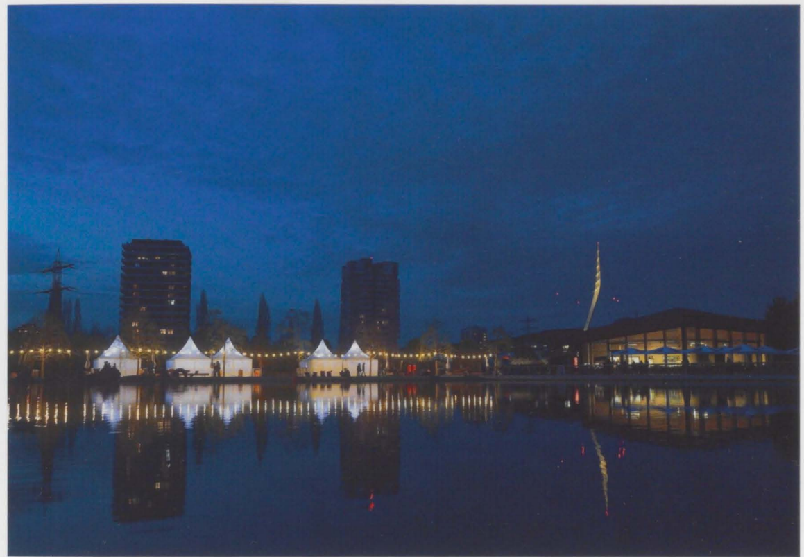
Ein Spiegelbild in der Abendstimmung: Das Haus am See und die Seepromenade im Lichterglanz.

Wohn- und Geschäftshaus am See www.wilshornbesitzer.de