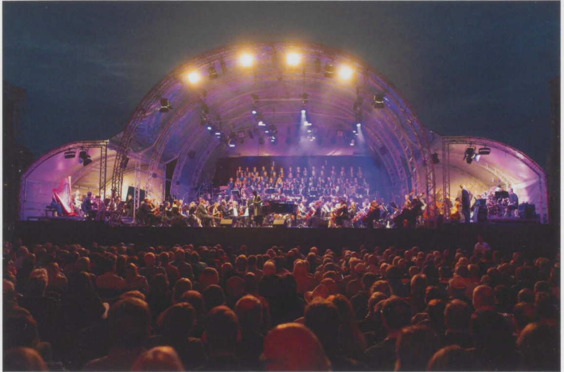
Das ORSO im Licht der Bürgerparkbühne: Ein Abendspektakel begeistert die Zuschauer.