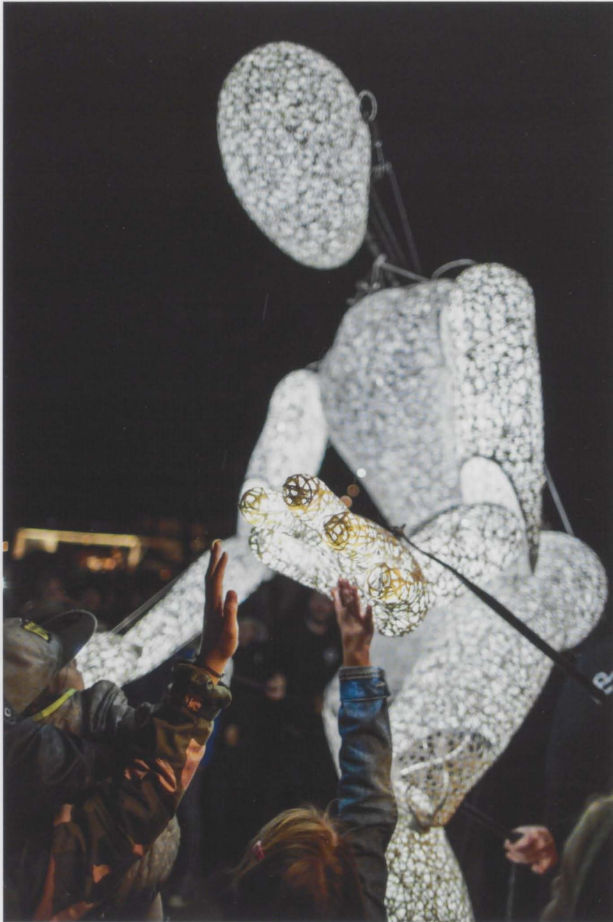
Der leuchtende DUNDU des Puppenspieler Tobias Husemann faszinierte Groß und Klein.