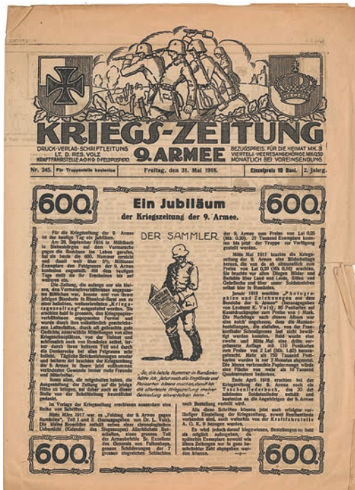
Jubiläumsnummer 600 mit Sammelappell. Titelseite der Kriegszeitung der 9. Armee Nr. 245 vom 31.5.1918.

Mappen mit patentierter Einklemmvorrichtung« verkauft oder auch vorgefertigte Einbanddecken. Es erschienen aus Einzelbeiträgen zusammengestellte Sammelhefte und ab 1916 auch Auswahlbände, entweder themenbezogen oder nach Art der Beiträge unterschieden in Fotoalben, Gedichtbände, Karikaturensammlungen etc. »Zu jedem Büchlein wird ein Briefumschlag zur Versendung in die Heimat unentgeltlich mitgeliefert«, warb die Champagne-Kriegszeitung beim Erscheinen ihrer Foto-Auswahlbände. Ziel war immer, »das Beste der Kriegszeitung als dauernden Besitz für später zu erhalten«.