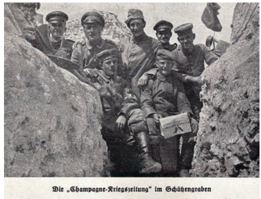
Die Champagne-Kriegszeitung im Schützengraben, 1915/1917. Aus: Von Aubérive bis Brimont. Bilder aus der Champagne. 3. Folge. Hrsg. von der Schriftleitung der Champagne-Kriegszeitung. Gedruckt im Felde 1918, S. 142.

Einnahmen wurden im Wesentlichen durch Bezugsgelder erzielt. Häufig wurde die Zeitung an die eigenen Truppenteile unentgeltlich abgegeben und gegen Bezugsgebühr auch anderen Formationen überlassen. Und im Regelfall war der Bezugspreis für Abonnenten in der Heimat höher als der für Abnehmer an der Front – der Champagne-Kamerad etwa, die Zeitung der 3. Armee, finanzierte sich vor allem über seine 3000 zah-