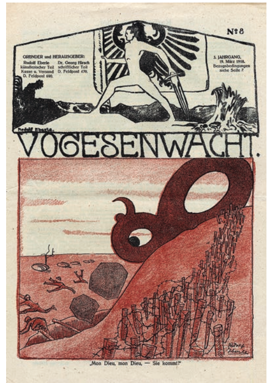
»Mon Dieu, mon Dieu, – Sie kommt!« Aus: Vogesenwacht Nr. 8 vom 19. März 1918. Karikatur von Rudolf Eberle.

Der schnelle Erfolg der ersten Feldzeitungen führte zu rasanten Auflagensteigerungen und ließ bald bei vielen Truppenteilen an der Westfront ähnliche Blätter entstehen. In kurzer Zeit wurde daraus eine Angelegenheit der Heeresleitung, die für den Frontdienst untaugliche Redakteure, Setzer und Drucker zur Feldpresse abkommandierte und für regelmäßige Papierlieferungen sorgte. Außer den Zeitungen kleinerer Heeresverbände, die mit einfachen Mitteln unweit der Schützengräben erstellt wurden, entstanden bald auch die Zeitungen der Armeen. Namhafte Verleger wie Ludwig Munzinger (3. Armee) und Anton Kippenberg (4. Armee), erfahrene Blattmacher wie Paul Oskar Höcker von Velhagen &