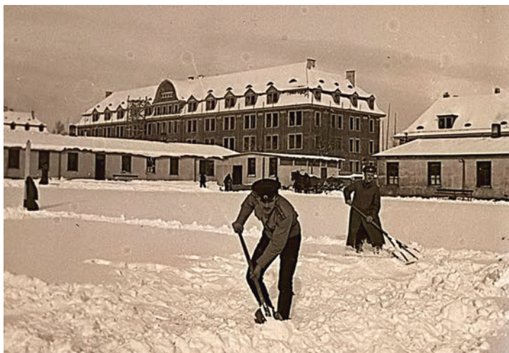
Abb. 3: Villingen, Offiziersgefangenenlager in der 1913 eingerichteten Barackenkaserne, ca. 1916/17 (Stadtarchiv Villingen-Schwenningen)

lage wurde erst im November fertiggestellt. Während das Wirtschaftsgebäude Ende Oktober 1917 erst zur Hälfte eingedeckt war, war das Stabsgebäude mit den Krankstuben Anfang Mai 1917 in Nutzung genommen worden. Nachdem Deutschland am 22. April 1915 mit dem Einsatz von Chlorgas den Giftgaskrieg eröffnet hatte, wurde am 25. Januar 1917 die Errichtung eines Gaskampf- raums für Übungszwecke verfügt. Im Zuge der sich ständig verzögernden Bauarbeiten warfen die Militärbehörden, die sich im Mai 1918 stark in Zahlungsverzug befanden, dem freien Architekten Karl Nägele vor, den Bauvorgang