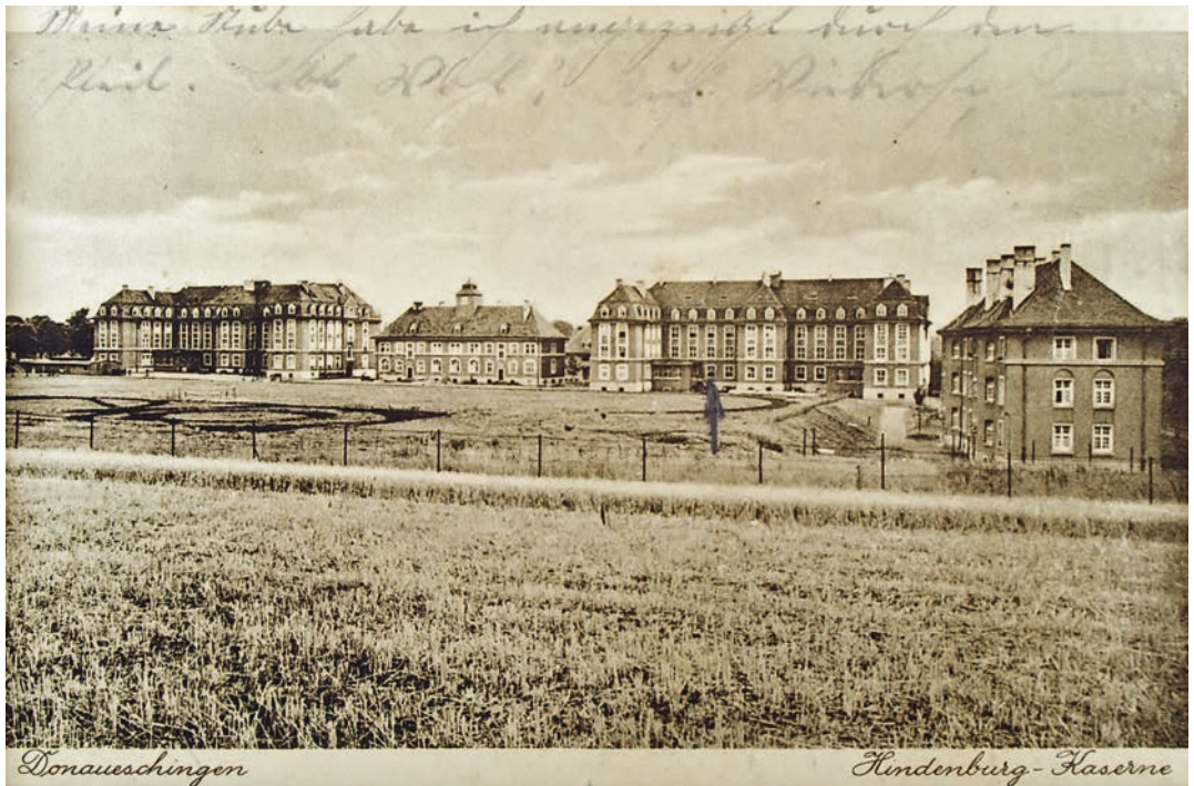
Abb. 7: Donaueschingen, Exerzierplatz der Kaserne, von links nach rechts: Mannschaftsgebäude, Wirtschaftsgebäude, Mannschaftsgebäude und Familienwohnhaus, Postkarte um 1930

schosslur und Treppenhaus jeweils ein Pultdachanbau mit Aborten angefügt.