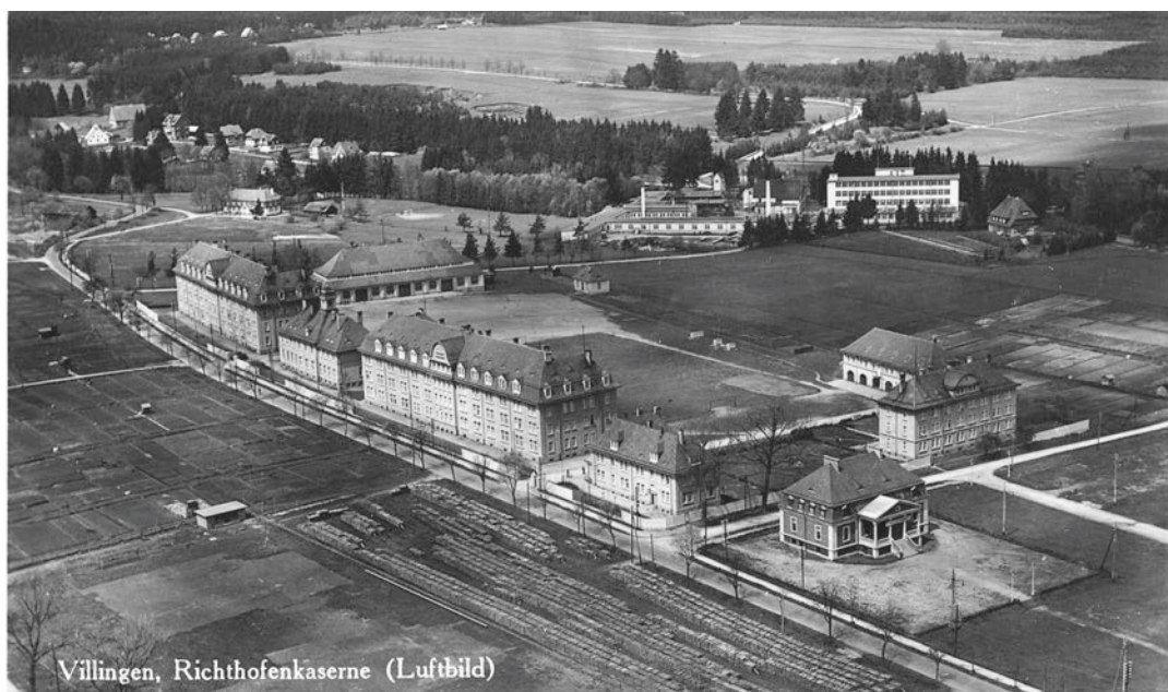
Villingen, Richthofenkaserne (Luftbild)

bewusst zu verschleppen, um sich vor dem Fronteinsatz zu drücken, und beriefen ihn am 3. Juni ins Feld ein. Der eingestellte Innenausbau wurde erst 1921 zu Ende geführt.