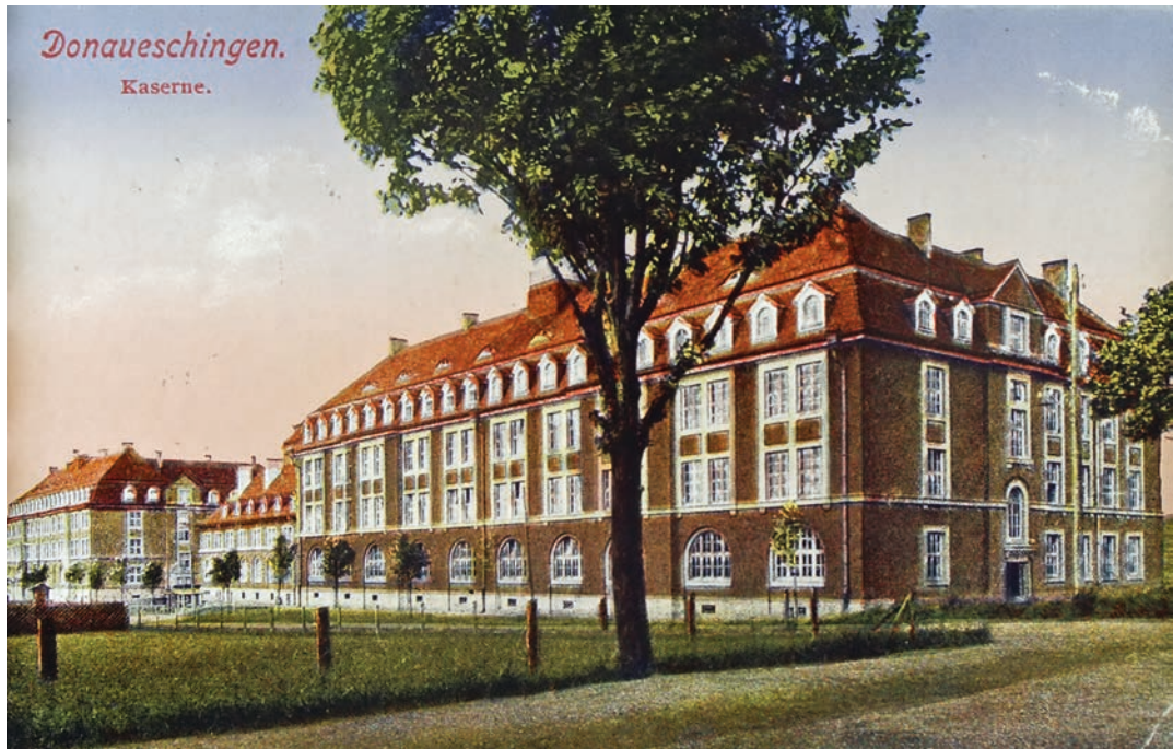
Abb. 10: Donaueschingen, Straßenfront der Kaserne mit dem Wirtschaftsgebäude zwischen den Mannschaftsgebäuden, kolorierte Postkarte, um 1920

Ersten Weltkrieg in Donaueschingen stationierten Regimenter wurden 1924 gegenüber vom Schloss und 1925 vor dem Donaueschinger Rathaus Denkmale gesetzt. Das bis Januar 1919 in Lahr demobilisierte 8. badische Infanterie-Regiment Nr. 169 erhielt 1928 ein Ehrenmal auf dem dortigen Bahnhofplatz. Es musste 1974 dem Bau der B 415 weichen. Eine kleine Erinnerungstafel befindet sich am Villingener Mannschaftsgebäude I.