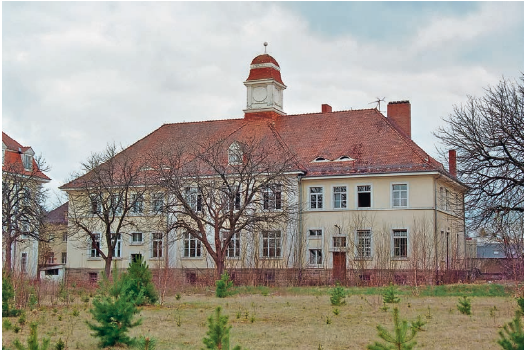
Abb. 5: Villingen, Wirtschaftsgebäude, Hoffront

Die Gebäude sind um einen rechtwinkligen Exerzierplatz gruppiert. Die Architektursprache zeigt Einflüsse der Reformarchitektur des frühen 20. Jahrhunderts mit Anklängen an den Barock. Die zwei- bis dreigeschossigen verputzten Backsteinbauten sind mit Pilastergliederungen repräsentativ gestaltet. Die Fassaden der beiden langgestreckten Mannschaftsgebäude und des von diesem gerahmten Wirtschaftsgebäude sind nach Süden, zur Kirnacher Straße, gerichtet. Das Wirtschaftsgebäude (Abb. 5) ist über der Firstmitte durch einen Dachturm mit Glockendach ausgezeichnet. Die Mannschaftsbauten sind durch Mittelrisalit und pavillonartige Kopfbauten akzentuiert; ihre Mansardwalmdächer sind mit Giebel- und Fledermausgauben besetzt. Die rückwärtig um den Exerzierplatz gruppierten Bauten