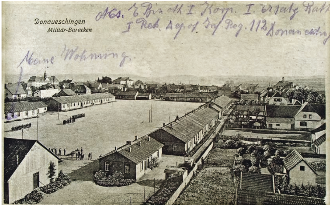
Abb. 2: Donaueschingen, Barackenkaserne. Postkarte, gelaufen 24.2.1917

tioniert. An beiden Standorten gab es 1913/14 nur provisorische Baracken-Unterkünfte (Abb. 2), unweit des jeweiligen Baugeländes, auf dem aber zum Teil schon die Funktionsgebäude (Waffenmeisterei und Patronenhaus, in Donaueschingen auch das Exerzierhaus) errichtet waren.