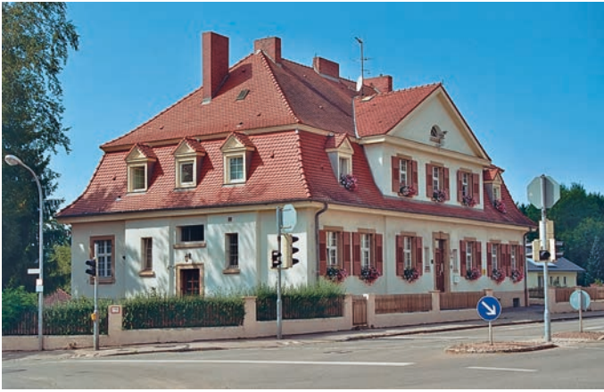
Abb. 8: Donaueschingen, Offizierswohnhaus, Villinger Straße 37

gewandelt. Seit dem Jahr 2000 haben die Bauten durch langen Leerstand und mutwillige Beschädigungen und Zerstörungen stark gelitten.