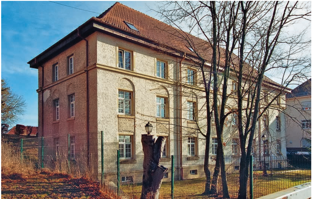
Abb. 9: Donaueschingen, Familienwohnhaus, Villingen Straße 48

erste Mannschaftsunterkünfte in Nutzung genommen werden. Im Frühjahr 1918 wurden die Bauarbeiten vorerst abgeschlossen; der Innenausbau erfolgte wohl 1921 bis 1922. Bis heute erhalten sind das Offizierswohnhaus, die Mannschaftsgebäude, das Familienwohnhaus (Abb. 9) und das Kammergebäude. Das Familienwohnhaus ist ein dreigeschossiger Walmdachbau im Heimatstil, das durch seine ansprechende Fassadengestaltung mit Besenputz, hofseitigen Treppenhauerkern, rundbogigen Fensterverdachungen im ersten Obergeschoss und die beiden Obergeschossen trennendem Gesimsband besticht. Das Kammergebäude ist vom Typus mit dem Villingen identisch. Dagegen folgen die Mannschafsbauten (Abb. 10) zwar, wie in Villingen, dem Typus des Doppel-Kompaniegebäudes, sind mit ihren neubarocken Fronten und Man-